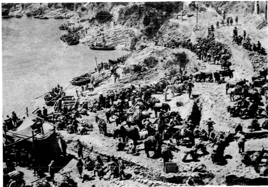
(中国人民解放军十九兵团过黄河到达仁存渡口西岸)

24日 永宁城乡欢庆解放。县城杨和堡群众举着红旗敲锣打鼓欢迎中国人民解放军19兵团主力路过永宁。