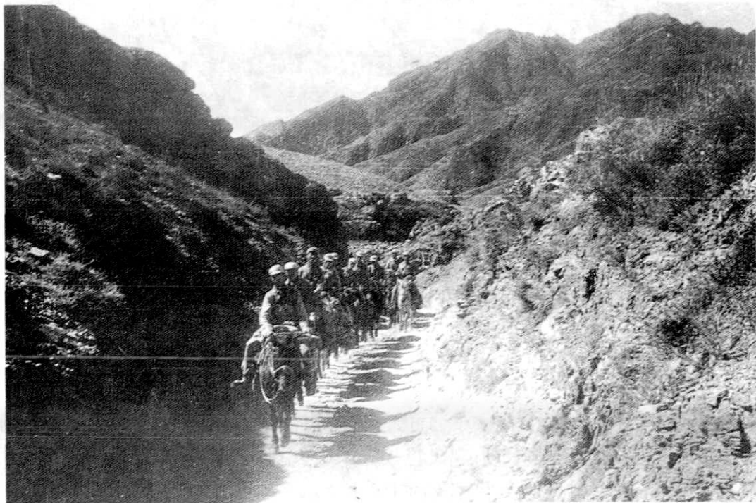
(中国人民解放军十九兵团六十三军一八八师五六四团, 奉命越过腾格里大沙漠,翻过贺兰山脉,穿过茫茫草原,进入阿拉善旗的腰坝地区)

中国人民解放军十九兵团六十三军一八八师一部,越过贺兰山进驻阿拉善旗首府定远营。至此,宁夏全境解放。