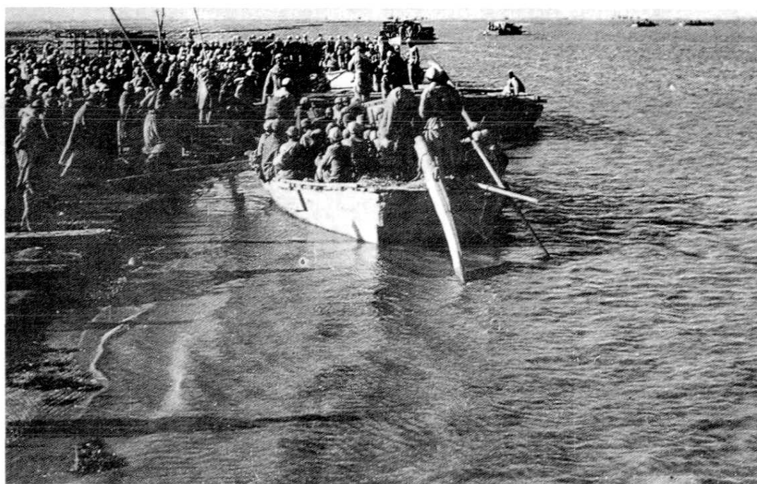
(中国人民解放军十九兵团先头部队从永宁县仁存渡口过黄河)