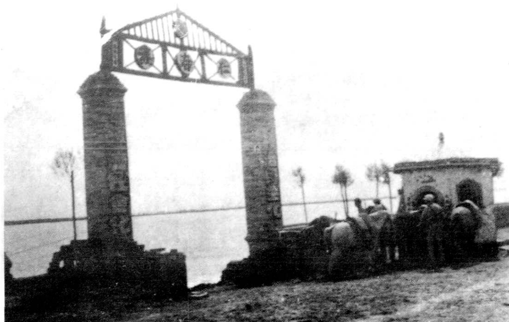
(永宁县仁存渡口)