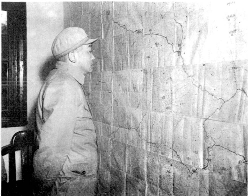
(彭德怀副司令员在兰州指挥第一野战军各兵团向宁夏、青海、新疆进军)