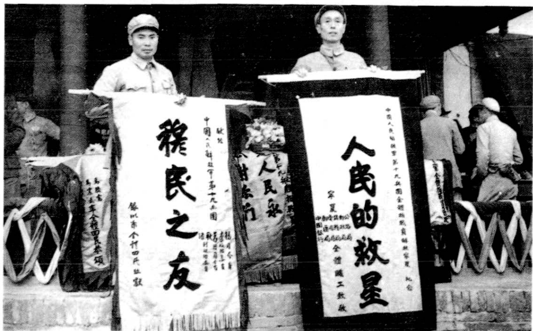
银川解放,回汉人民赠送十九兵团司令员杨得志(左)、政委李志民(右)锦旗

中。另一些从横城渡口逃至石嘴山或陶乐县的宁马官兵,终因无路可逃,才在此渡河至银川,向解放军投诚。