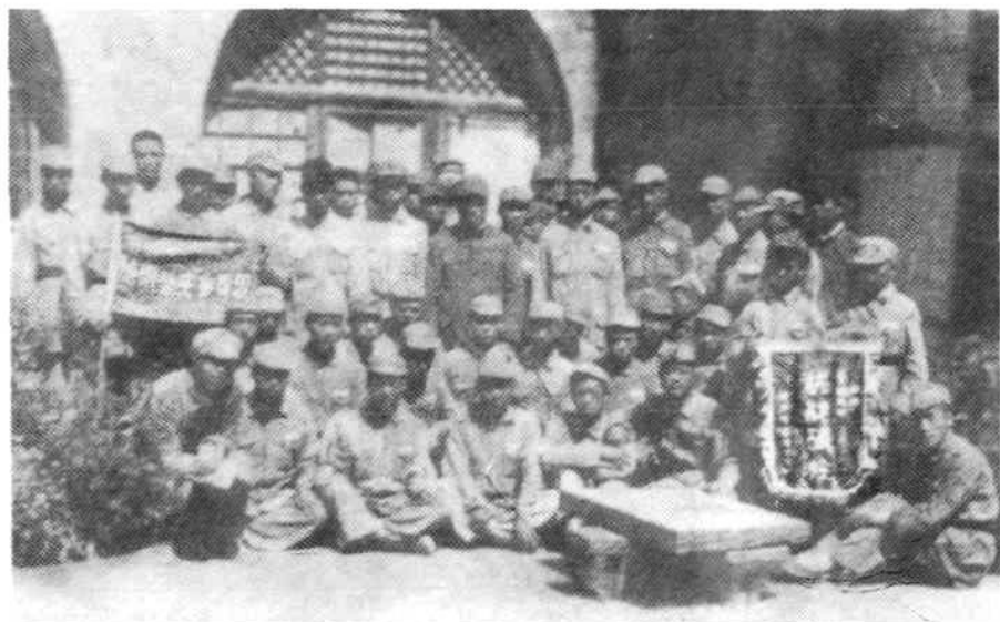
▲1942年8月,朱德总司令在延安八路军总部与陇东中学参观团全体人员合影