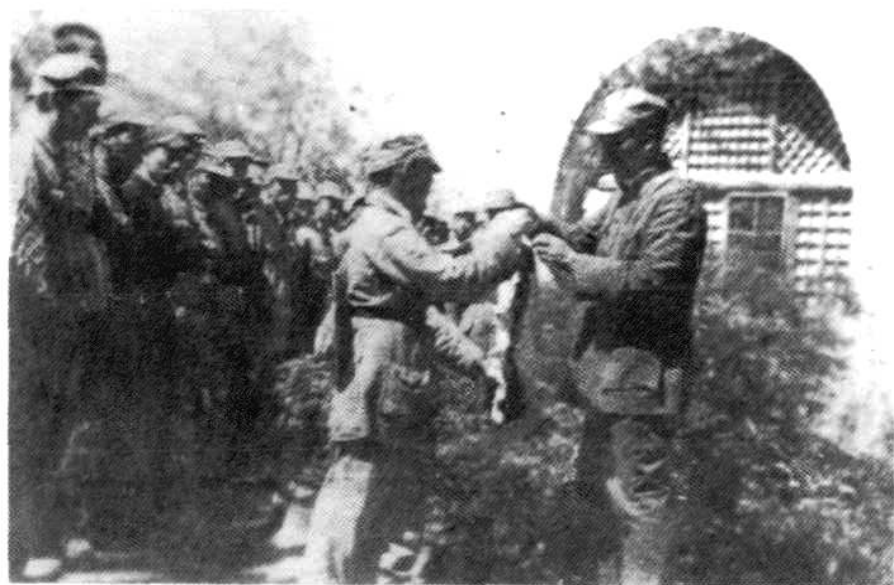
▲1942年8月,陇东中学首届毕业生在延安八路军总部向朱德总司令敬献锦旗