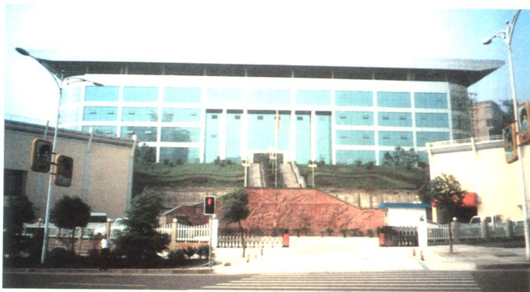
涪陵区交通委员会办公大楼