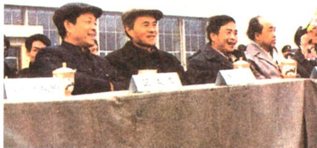
涪陵地区领导参加 加庆祝大会