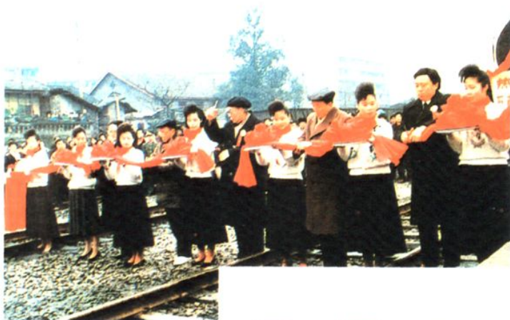
1991年12月29日， 万南地方铁路正线通车， 铁道部、重庆市及有关部门领导为通车剪彩