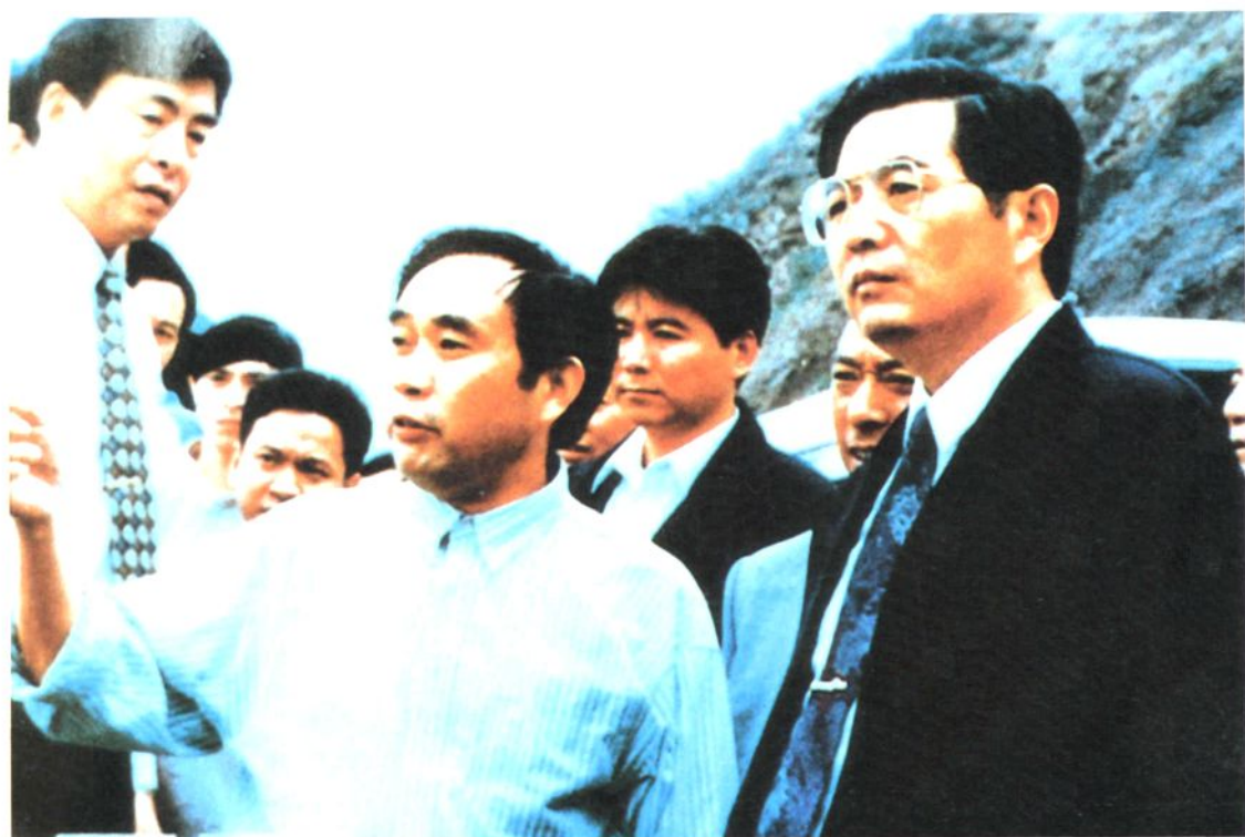
1996年9月20日，中共中央政治局常委、书记处书记胡锦涛（右一）视察建设中的涪陵长江大桥