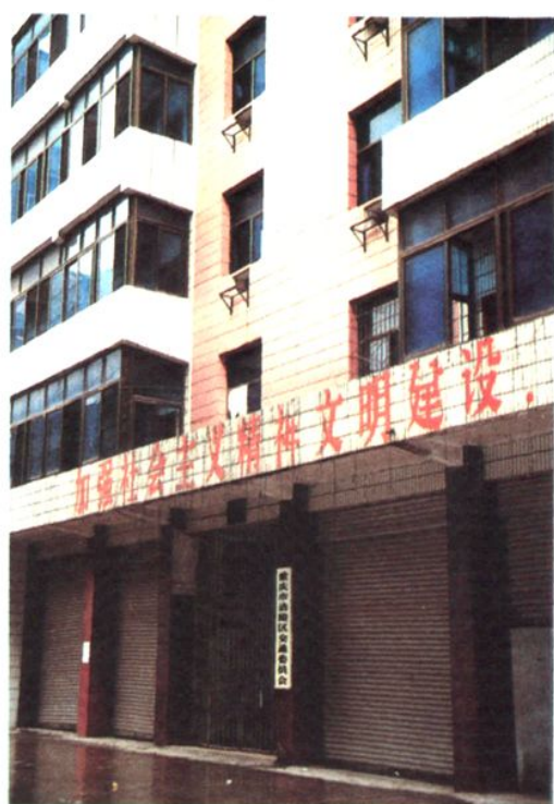
1993年至2004年交委办公楼