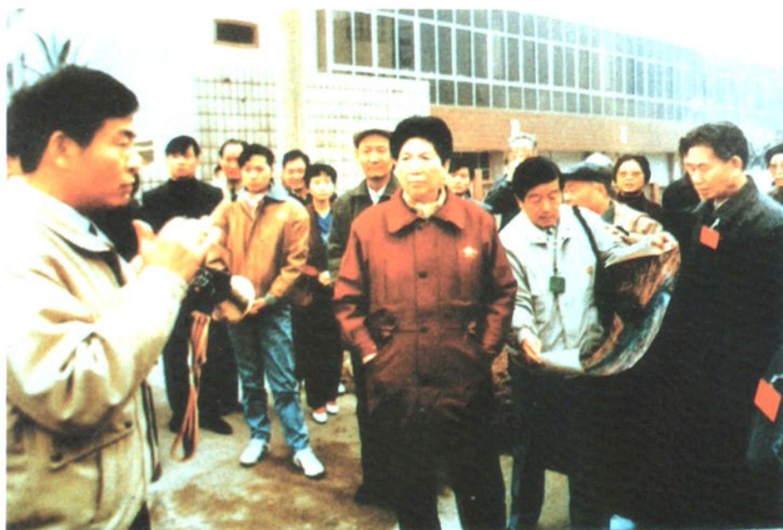
1991年11月14日，全国人大常委会副委员长、全国妇联主席陈慕华（中）视察涪陵汽车客运站