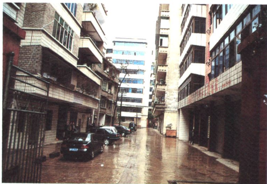
交委办公楼及宿舍旧貌（右一为办公楼、左一幢和正中一幢为宿舍楼局部）