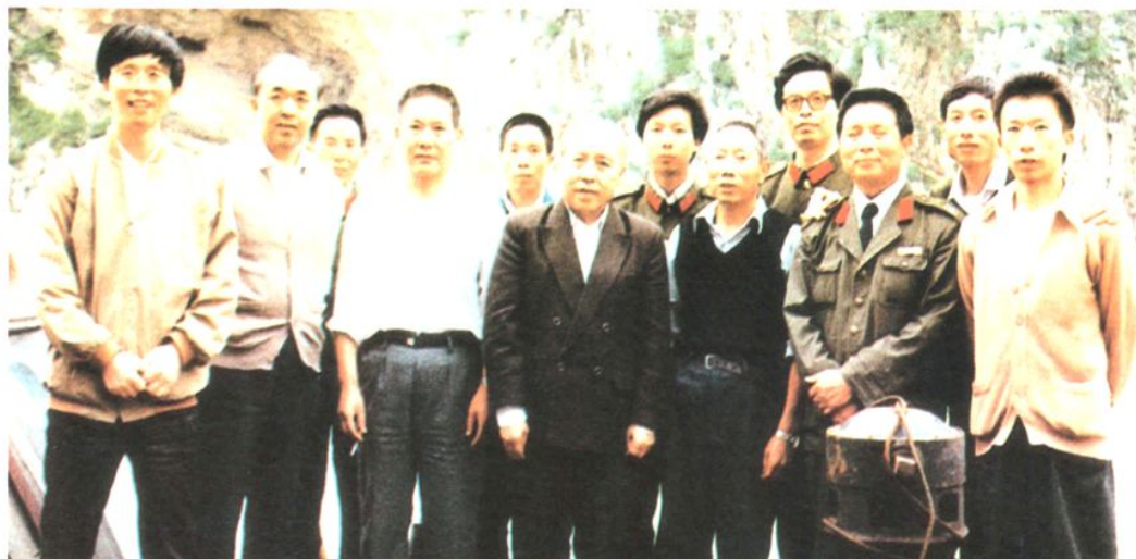
1990年5月15日，中共中央政治局委员、四川省委书记杨汝岱（前排中）视察乌江时与港监人员合影