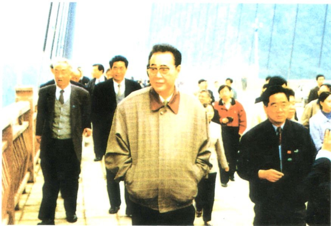
1997年10月30日，国务院总理李鹏（前排左一）在副总理邹家华（后排左一）和有关方面负责人陪同下徒步参观涪陵长江大桥