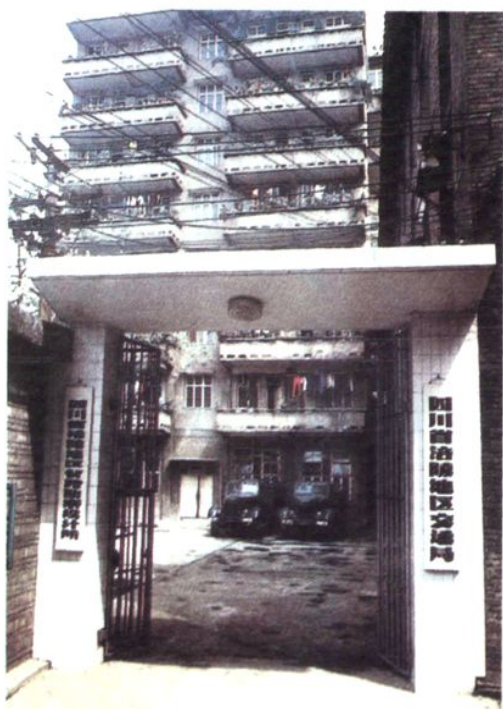
1993年以前的涪陵地区交通局、地区交委 办公楼（右侧）及宿舍楼之一（正面）