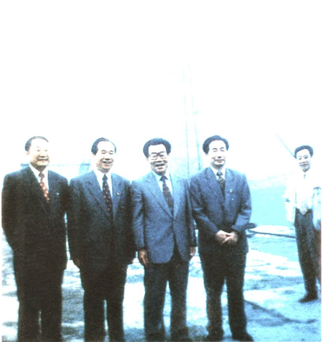
1996年5月13日，全国政协主席李瑞环（左三）在中共四川省委书记谢世杰（左二）、省政协主席聂荣贵（左四）、副省长甘宇平（左一）陪同下视察丰都长江大桥建设工地