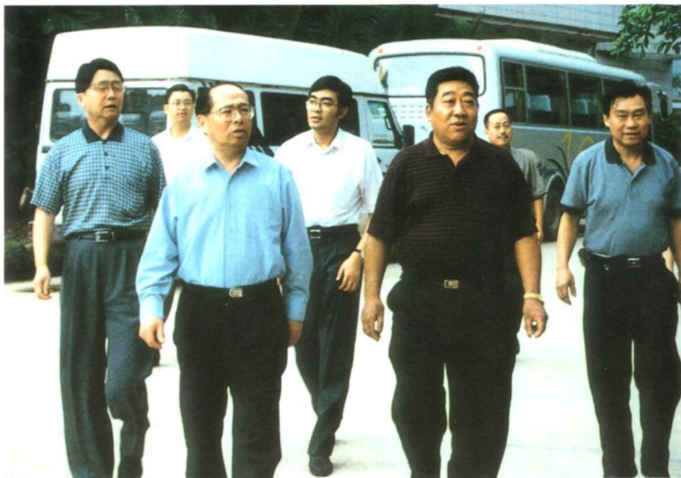
2002年8月19日，交通部长黄镇东（前排左二）检查涪陵交通建设