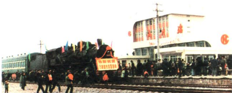
第一列火车驶进南川站