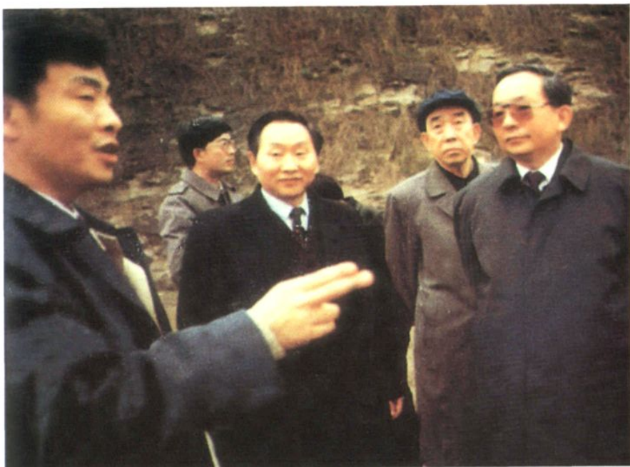
1992年3月3日，国务院副总理田纪云（右一）视察涪陵乌江大桥