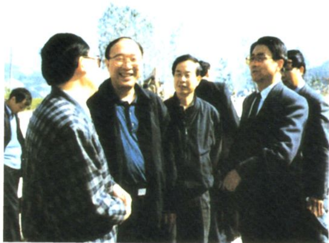
2001年11月15日，重庆市常务副市长黄奇帆（左二）检查国道319线涪陵段“三改二”工程