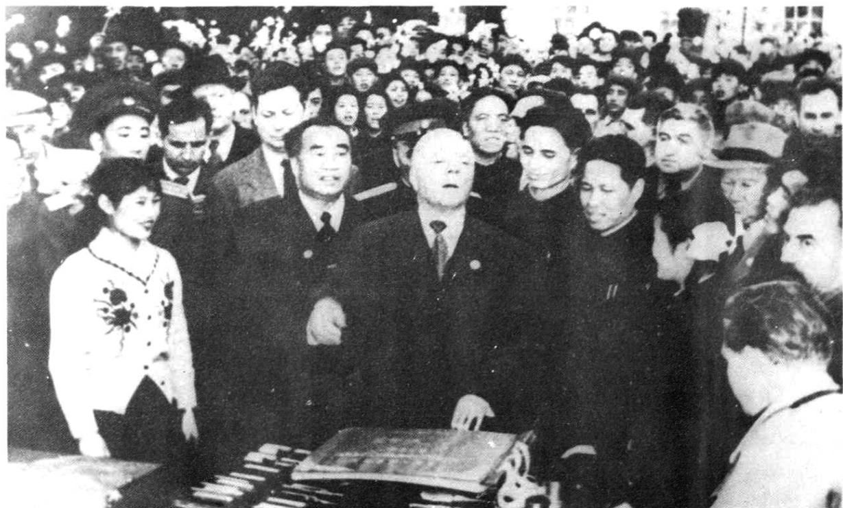
1957年4月20日，朱德委员长陪同苏联最高苏维埃主席团主席伏罗希洛夫 视察沈缆。前排右三是厂长尚格东