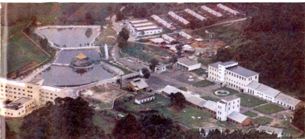
辉山电缆 附件分厂鸟瞰图、正门