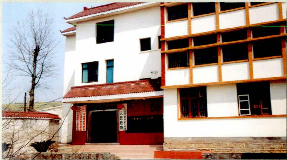
小寨坝镇党政办公楼