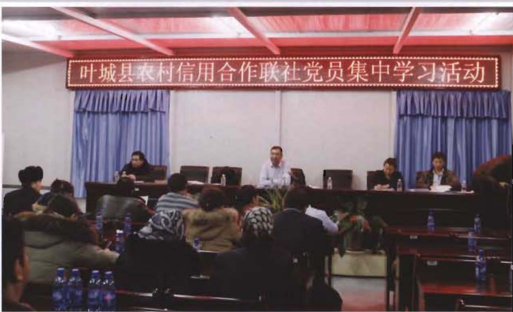
2013年12月26日，县联社党委组织联社党员开展集中学习活动