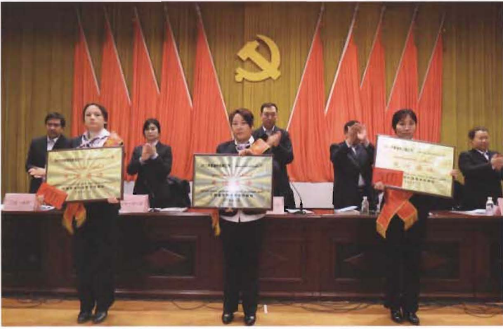
2014年2月14日，县联社召开2013年工作总结“双先”表彰大会。图为表彰现场