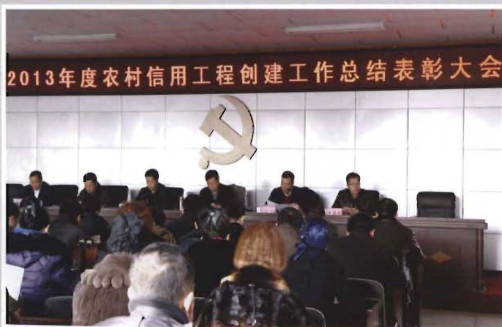
2014年1月9日，县召开2013年度农村信用工程创建工作总结大会