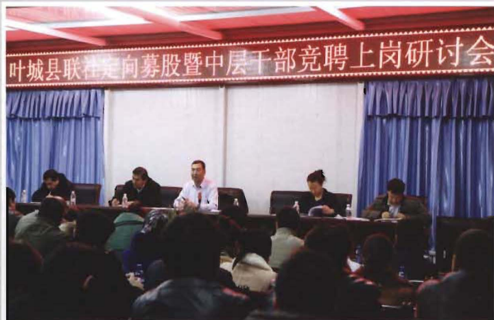
2013年12月26日，县联社召开定向募股暨中层干部竞聘上岗研讨会