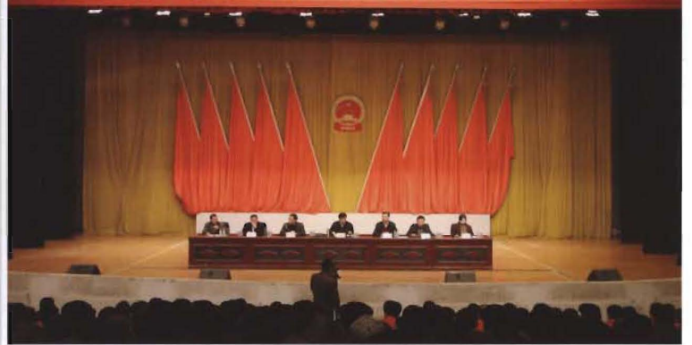
2013年12月3日，县召开农村信用工程创建工作推进会

لىق ناھىيىلىك ھۆكۈمەت قەرز ھەسكەتلىرى پىلانلىق كۆرۈنۈشىنىڭ پارچىسىنىڭ ئىسپاتىنى ئۆز ئىچىگە ئالىدىغان ئىقتىسادىي تەرەققىياتنىڭ سۈپىتىنى يەنىلا ياخشىلاش ۋە يېڭىلىنىش 叶城县农村信用工程创建工作推进会