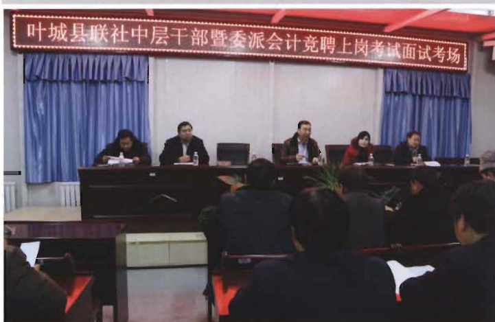
2013年12月28日，县联社举行中层干部暨委派会计竞聘上岗考试面试