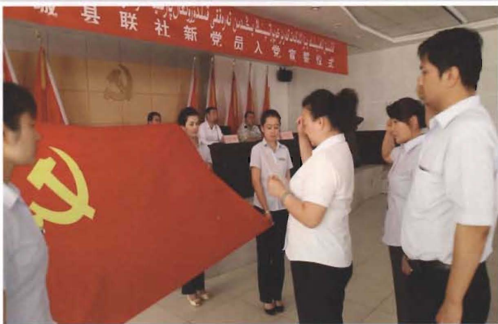
2014年7月3日，县联社党委举行新党员入党宣誓仪式