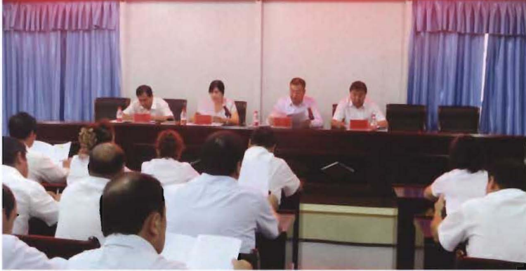
2013年8月1日，县联社召开党的群众路线教育实践活动动员部署会议

لىق ناھىيىلىك ھۆكۈمەت قەرز ھەسكەتلىرى پىلانلىق كۆرۈنۈشىنىڭ پارچىسىنىڭ ئىسپاتىنى ئۆز ئىچىگە ئالىدىغان ئىقتىسادىي تەرەققىياتنىڭ سۈپىتىنى يەنىلا ياخشىلاش ۋە يېڭىلىنىش 叶城县农村信用合作联社党的群众路线教育实践活动动员部署会议