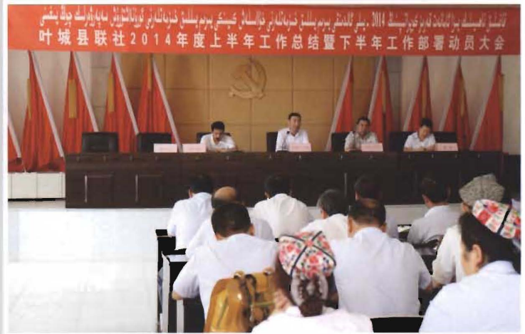
2014年7月1日，县联社召开2014年度上半年工作总结暨下半年工作部署动员大会