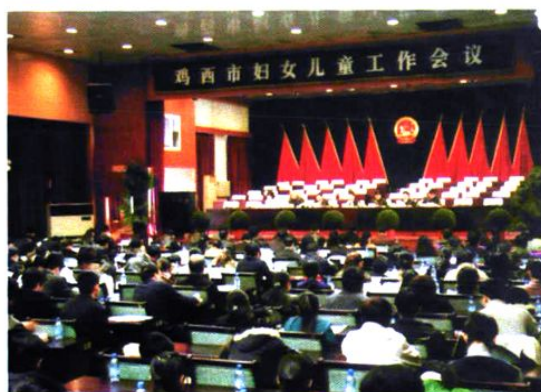
首届鸡西市妇女儿童工作会议