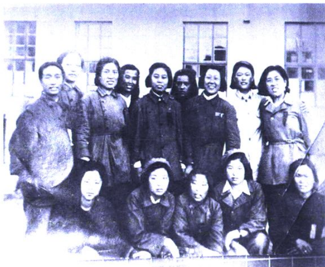
解放前夕,工作在鸡西矿区的妇女干部