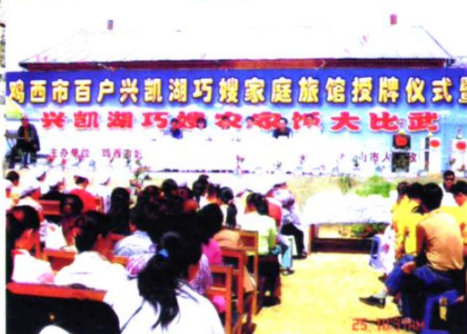
巧嫂家庭旅馆搅热鸡西旅游经济