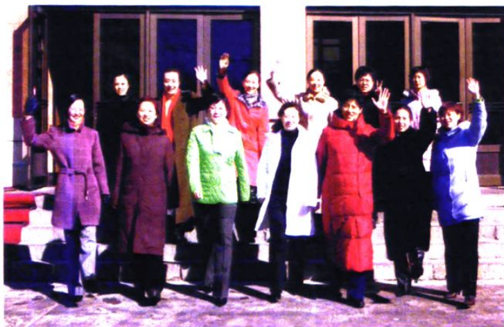
21 世纪初工作在市妇联的年轻女干部