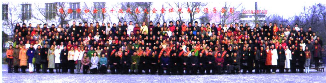
妇女代表大会代表合影