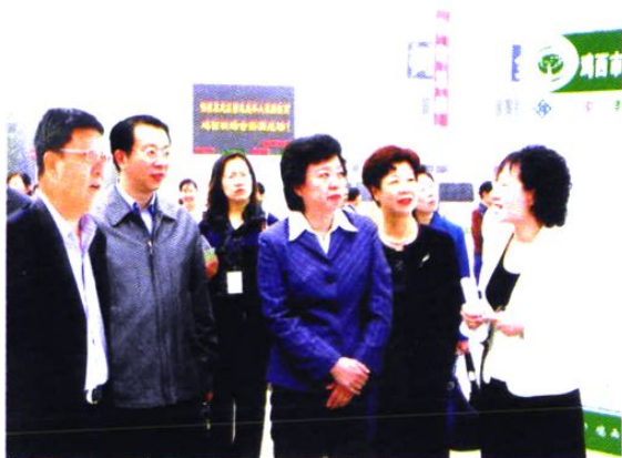
全国妇联书记处书记张世平、省委副秘书长李显刚来鸡西参加全省未成年人家庭教育现场会