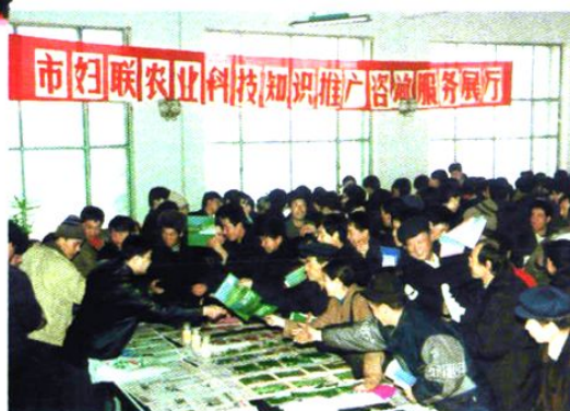
农业科技知识展厅吸引了广大农民