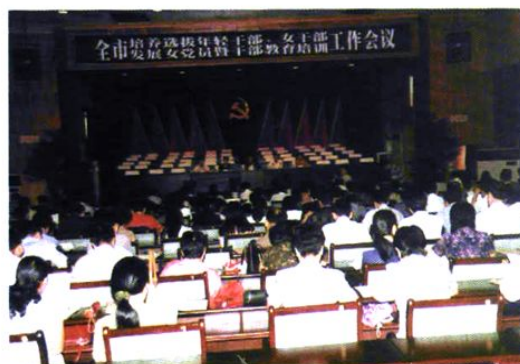
全市培养选拔女干部工作会议