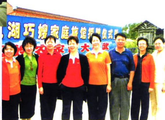
省妇联领导班子视察兴凯湖巧嫂家庭旅馆