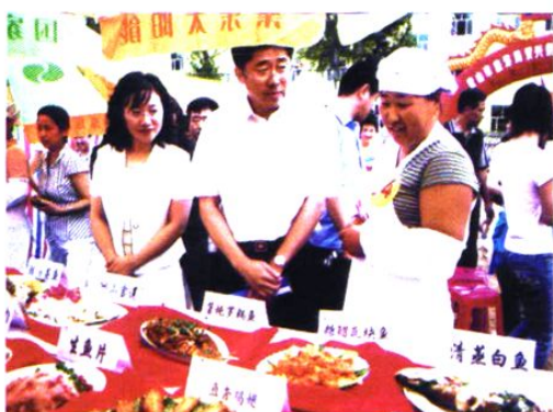
市长王兆力亲临巧嫂农家饭比武大赛