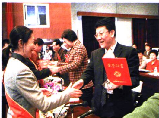
市委书记邱玉泉为市第六届十大杰出妇女颁奖