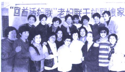
20 世纪 60 ~ 80 年代在妇联工作的女干部