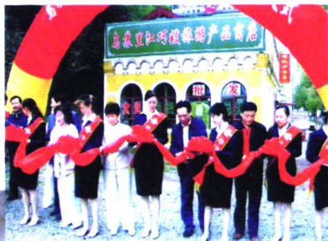
在虎林开发乌苏里江巧嫂旅游产品