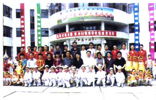
原全国妇联副主席刘海荣来鸡西检查工作，原市委副书记武贵发陪同