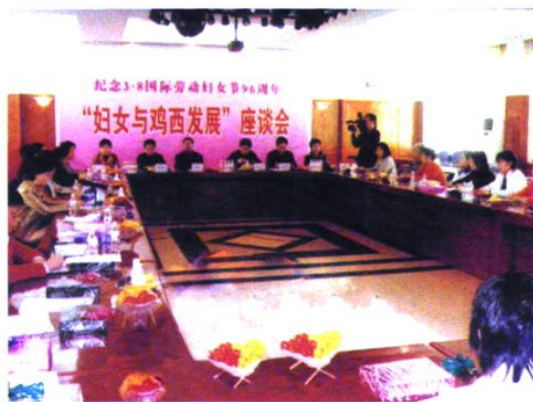
市四大班子领导参加妇女与鸡西发展座谈会