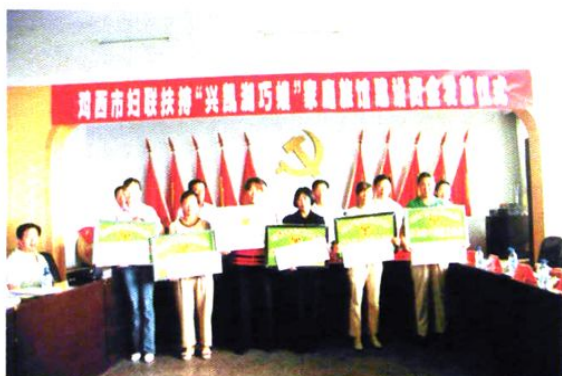
为兴办兴凯湖巧嫂旅馆发放扶持资金