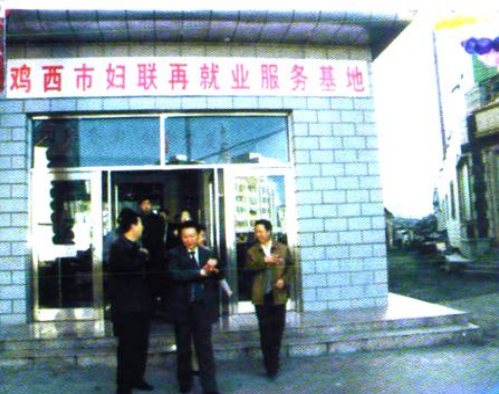
成立了市妇联再就业服务基地