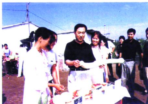
市委副书记韩义德参观鸡东县妇女特菜基地