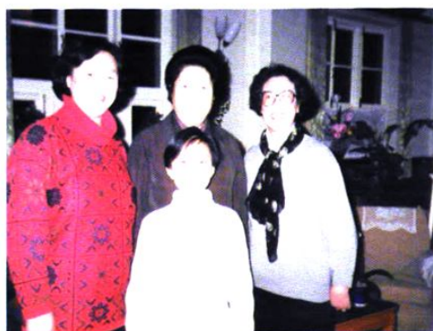
全国妇联主席陈慕华接见市妇联领导