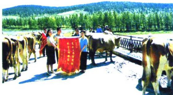
在麻山区发展养牛经济