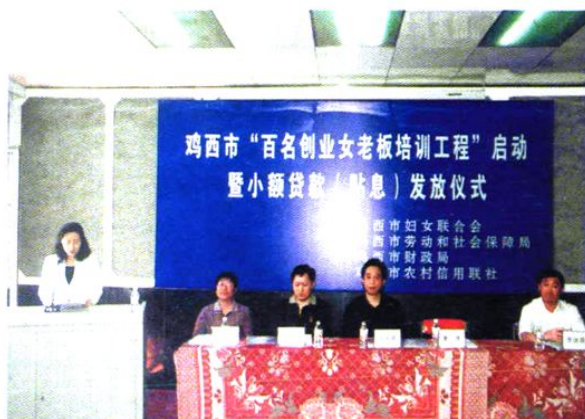
百名创业女老板培训工程启动