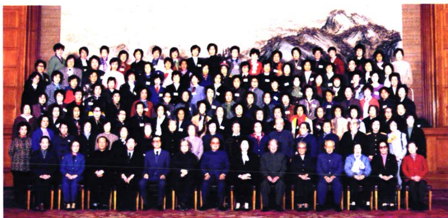
市妇联主任王晓英受到党和国家领导人的亲切接见