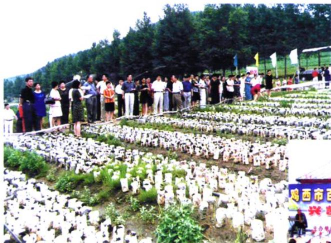
市妇联帮助梨树区妇女争取资金发展地摆木耳