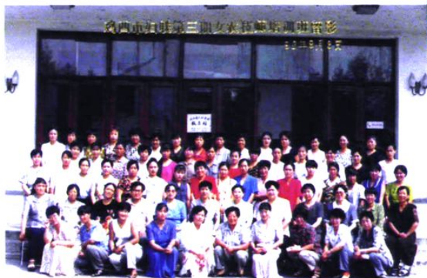
培训女农民技师参加经济建设