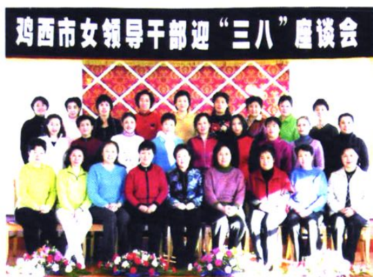
女领导干部联谊会发挥着重要作用