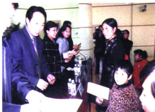
市委副书记马志勇向贫困女童颁发助学金