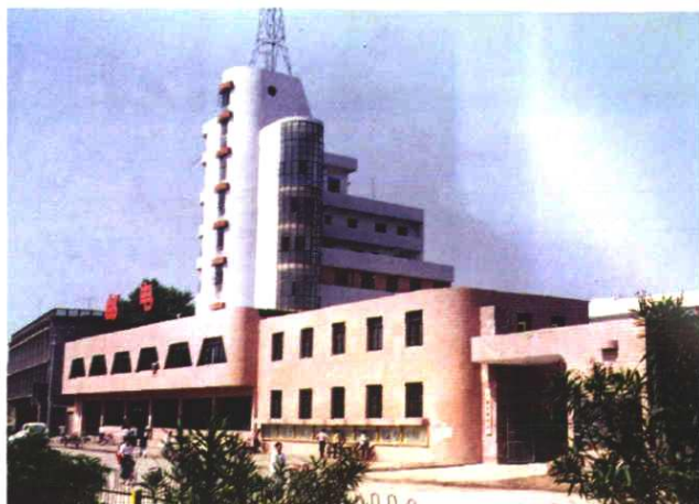
1992 年 11 月竣工投产的万载县第 三幢邮电生产楼