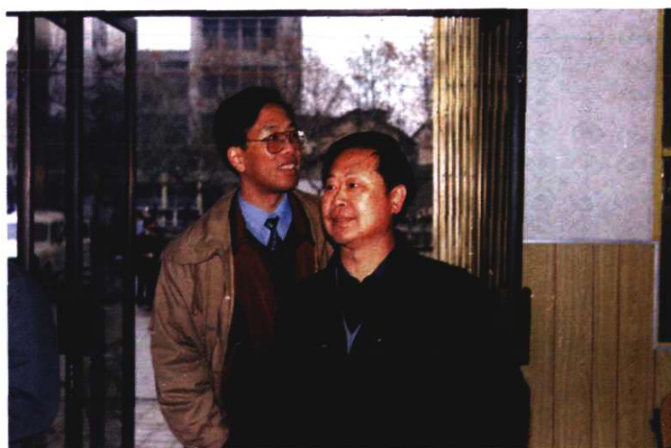
省局局长沈文江视察万载县邮电营业厅