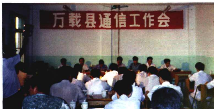
万载县首次通信工作会议