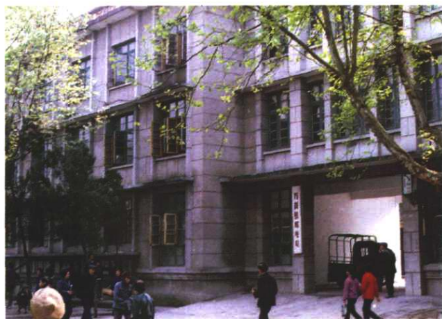
1976 年 7 月竣工投产的万载县第二幢 邮电生产楼