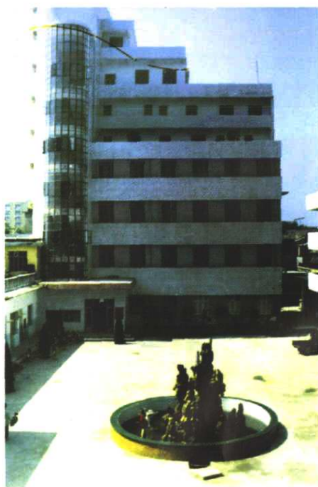
万载县邮电局院内环境