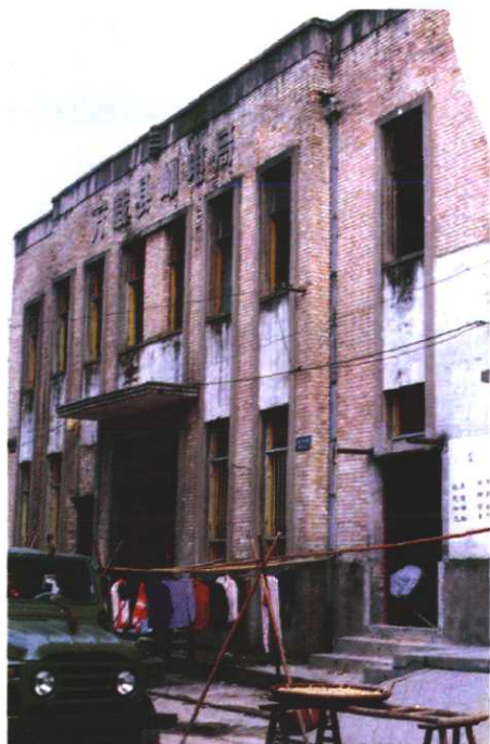
1957 年 9 月竣工投产的万载县 第一幢邮电生产楼