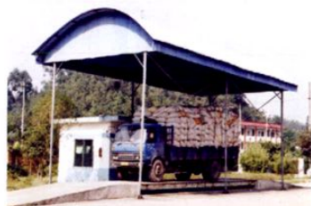
● 粮食入库通过电子秤计量