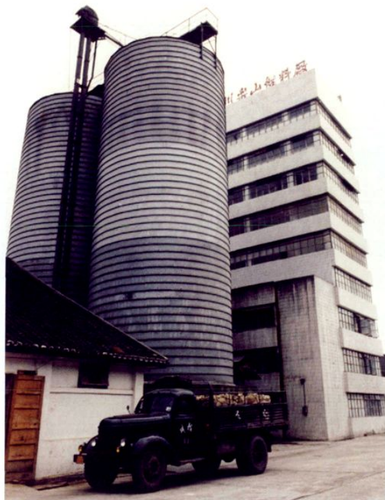
● 1986年，乐山饲料公司引进西德全套设备新建的乐山饲料厂。