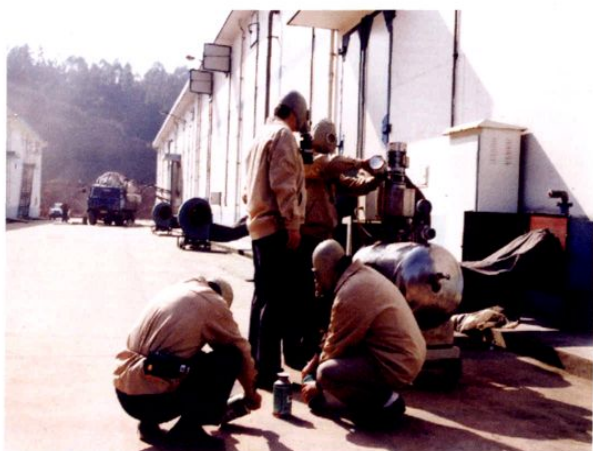
● 保防人员正在进行仓外环流熏蒸杀虫