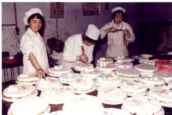
● 发展多种经营，粮食职工加工标花蛋糕