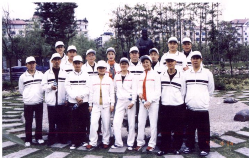
● 2005年，市粮食局机关职工参加市全民健身长跑活动留影。