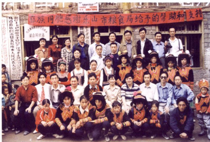
● 1999年，乐山市粮食局干部、职工与对口扶贫的马边彝族自治县瓦候库乡彝族同胞合影。