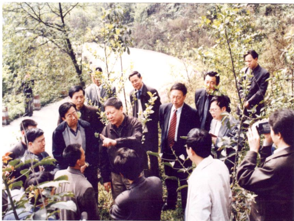
● 2002年3月，国家粮食局局长聂振邦(中左三)在省粮食局局长李益良(中左二)，乐山市人民政府副市长范金绶(中右二)陪同下视察沙湾区退耕还林情况。