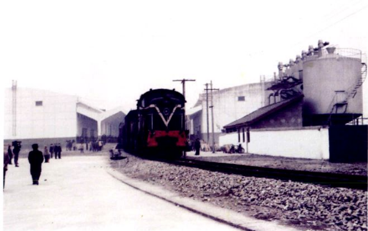
● 90年代初新建的眉山国家粮食储备库及铁路专用线。