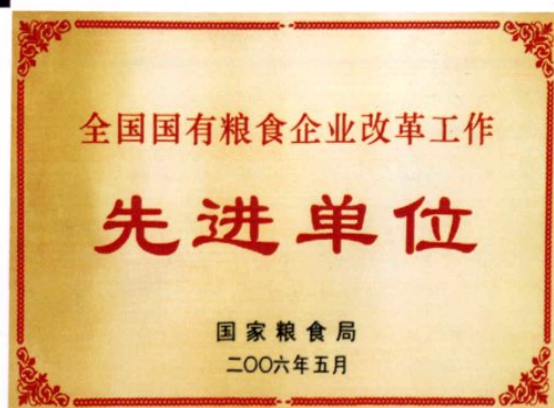
● 2006年5月，乐山市粮食局被国家粮食局评为全国国有粮食企业改革工作先进单位。