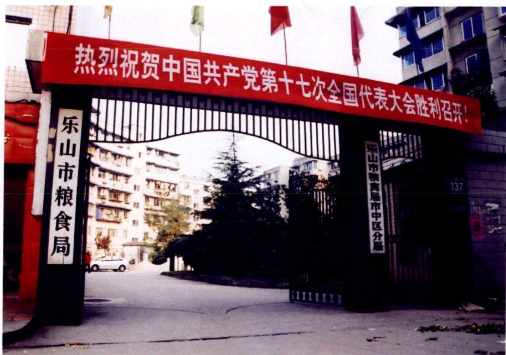
● 乐山市粮食局办公大楼大门