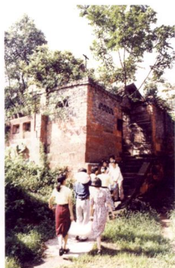
● 乐山城區粮站青年、团员送粮到老红军家。