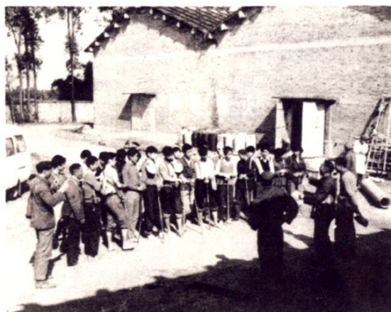
● 70年代保管员准备进仓熏蒸施药杀虫