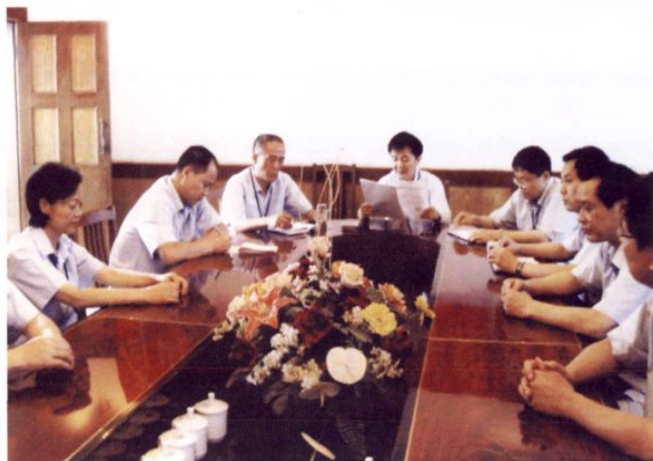
● 组织中层以上干部传达会议精神

四川峨眉山国家粮食储备库严格实行军事化、制度化管理，通过全体职工的共同努力，2002年被峨眉山市委、市政府命名为“2001-