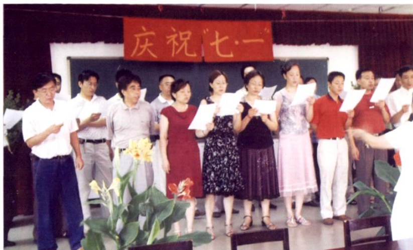
● 2005年，市粮食局机关党支部庆祝“七一”活动场景。