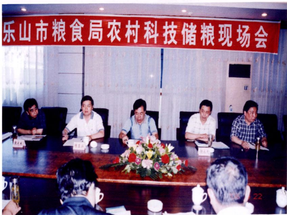
● 2006年，乐山市粮食局在犍为县召开农村科学储粮现场会，推广农村小粮仓建设。图为乐山市人民政府副市长方为加（中）到会指导。