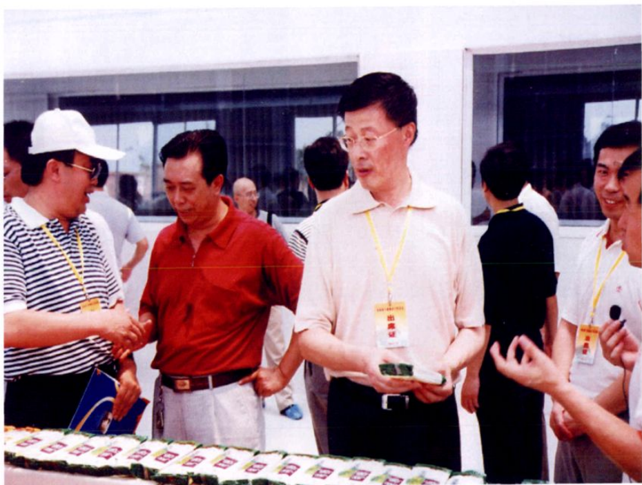
● 2006年，在全市工业工作现场会议期间，乐山市市委书记于伟（左三），视察川粮粉业。