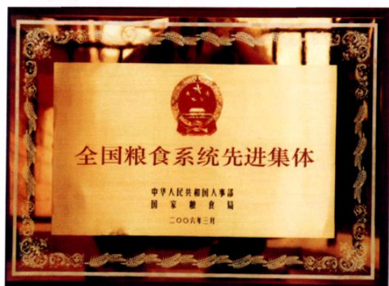
● 2006年3月，乐山市粮食局被中华人民共和国人事部、国家粮食局评为全国粮食系统先进集体。