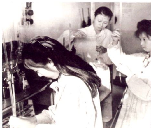
● 80年代检验员正在化验油脂