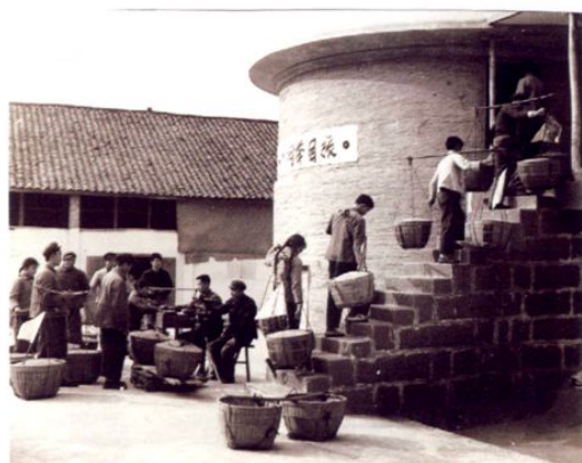
● 70年代粮油入库现场