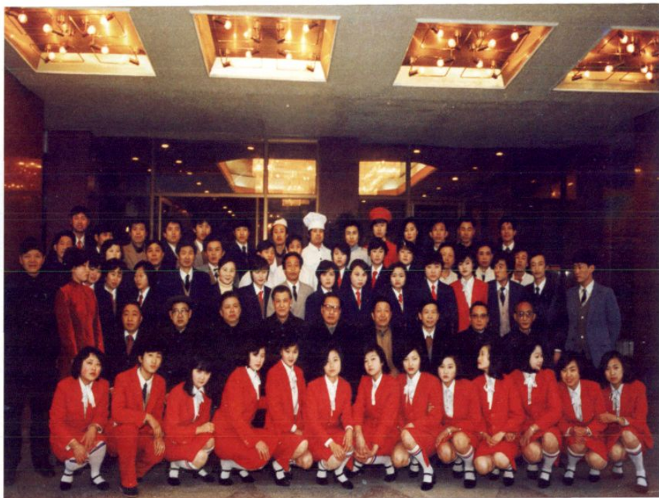
● 1988年2月，中共中央政治局常委、全国人大常委会委员长乔石（二排左五），在乐山视察时与市粮食局八仙洞宾馆员工们合影。