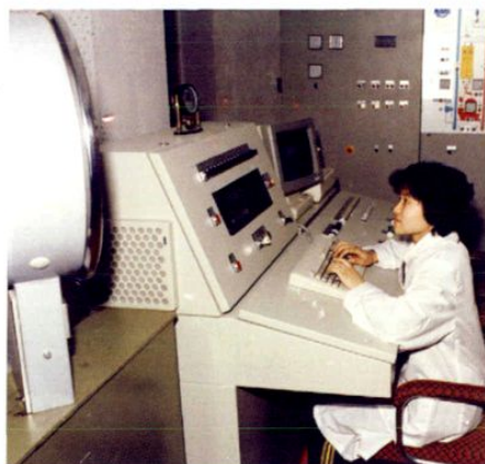
● 乐山饲料厂配料车间一角