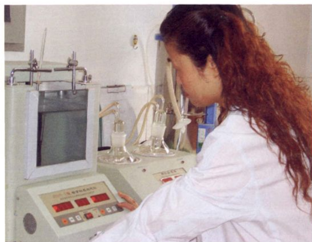
● 2005年检验员正在用先进设备检测粮食质量

● 图一~图三是乐山市粮食局粮油食品监测站2005年新购进的元子吸收分光光度仪、气相色谱仪、旋转蒸发器等先进的粮油、食品质量监测仪器。