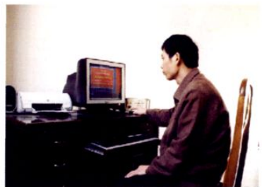
● 微机控制仓外测温