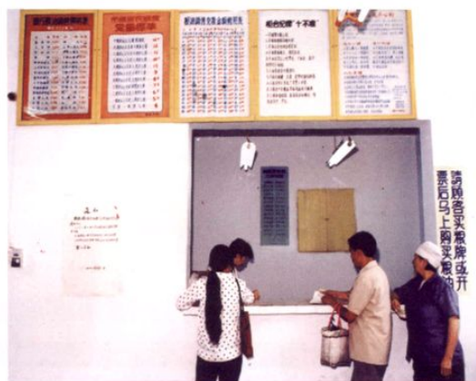
● 计划经济时期的粮店售粮情景