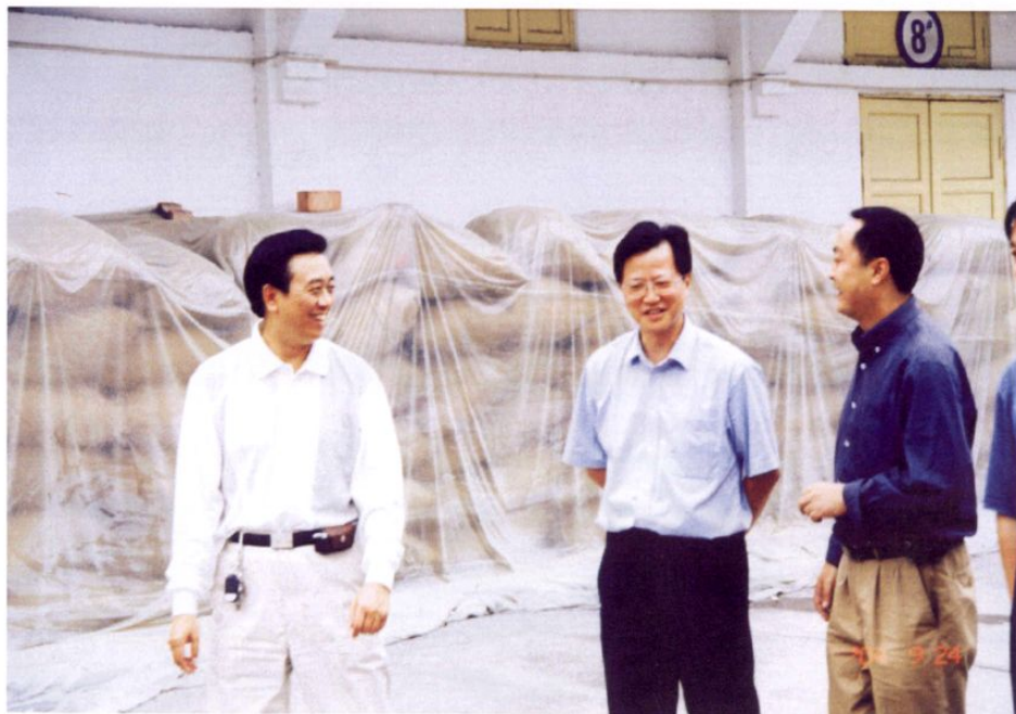
● 2006年，国家粮食局副局长任正晓(右二)，在乐山市粮食局局长颜永先(左一)陪同下视察沙湾恒瑞粮贸公司储粮情况。