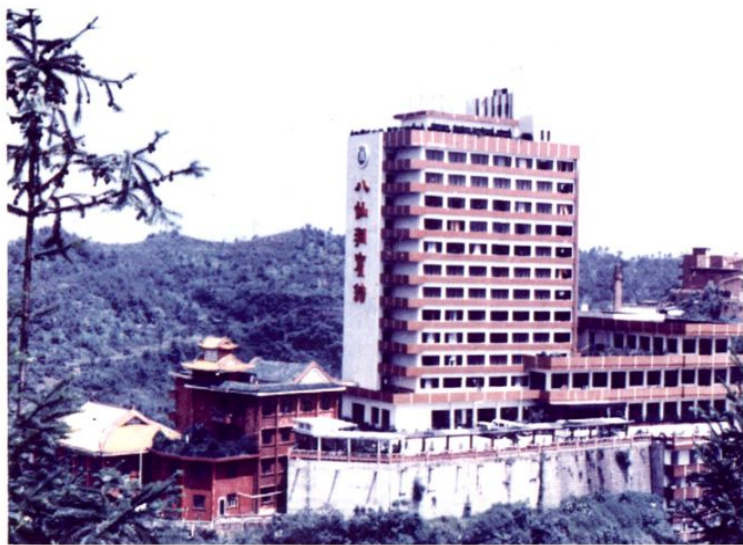
● 1987年建成的乐山市粮食局八仙洞宾馆全貌