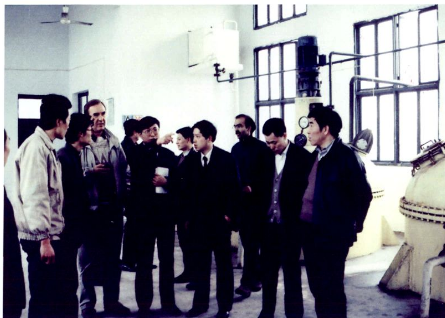
● 1989年，世界银行官员在乐山市经贸委领导陪同下视察眉山粮油工业公司油脂车间。