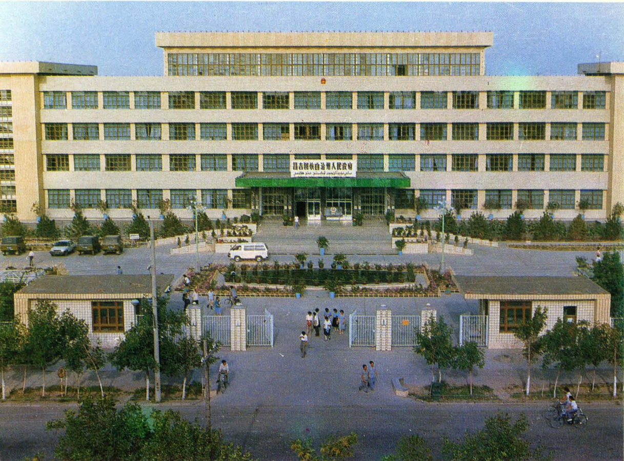
昌吉州人民政府机关