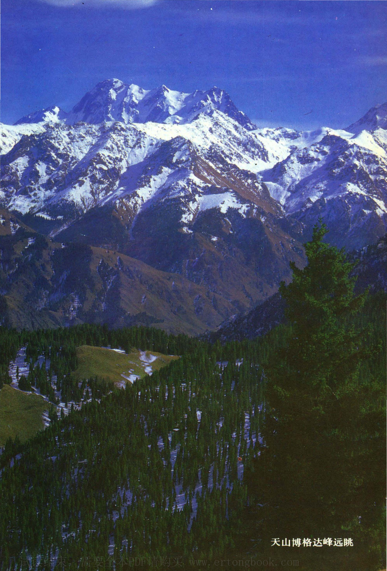
天山博格达峰远眺