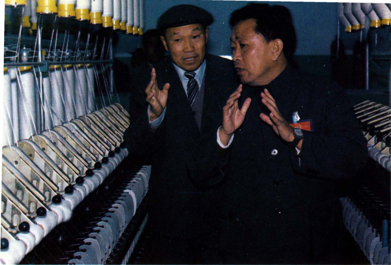
自治区党委书记宋汉良（右）和州党委书记肖桂馨视察昌吉棉纺厂