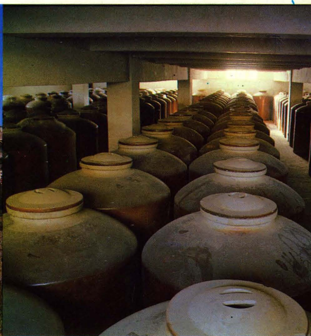
吉木萨尔县三台酒厂