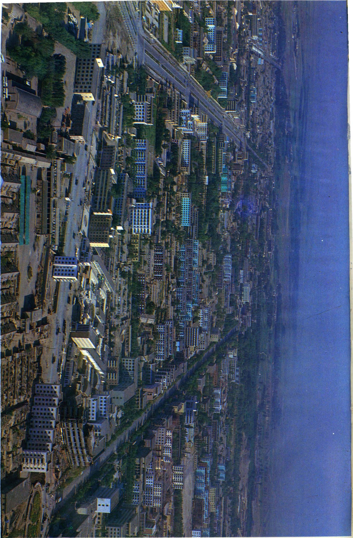
昌吉州府——昌吉市容鸟瞰