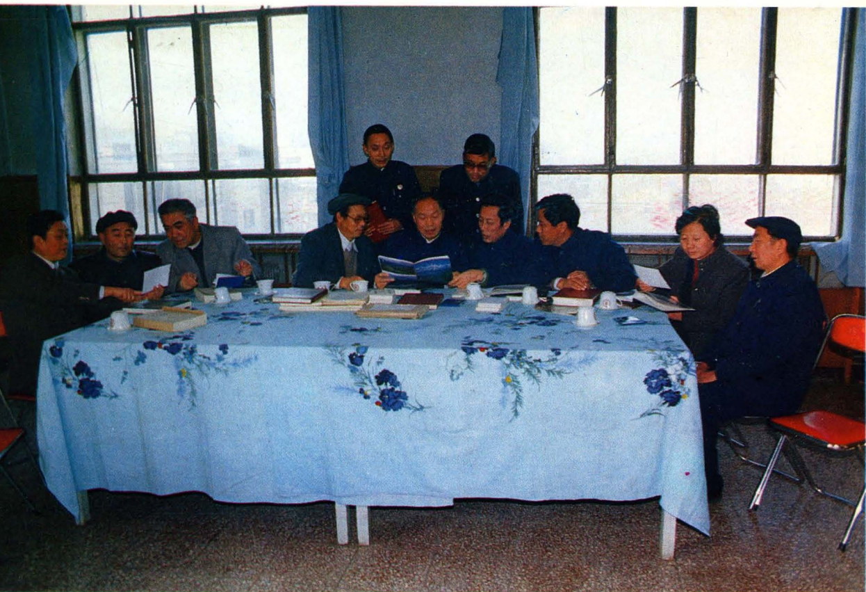
昌吉州委书记肖桂馨、州长马存亮等领导同志听取地名工作汇报