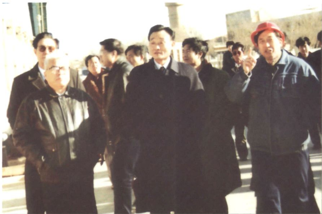
1995年1月4日，中共中央政治局委员、书记处书记吴邦国来厂视察