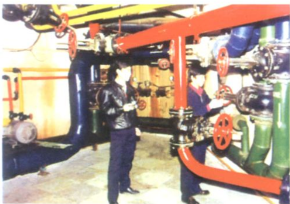
运行人员维护检查水系统