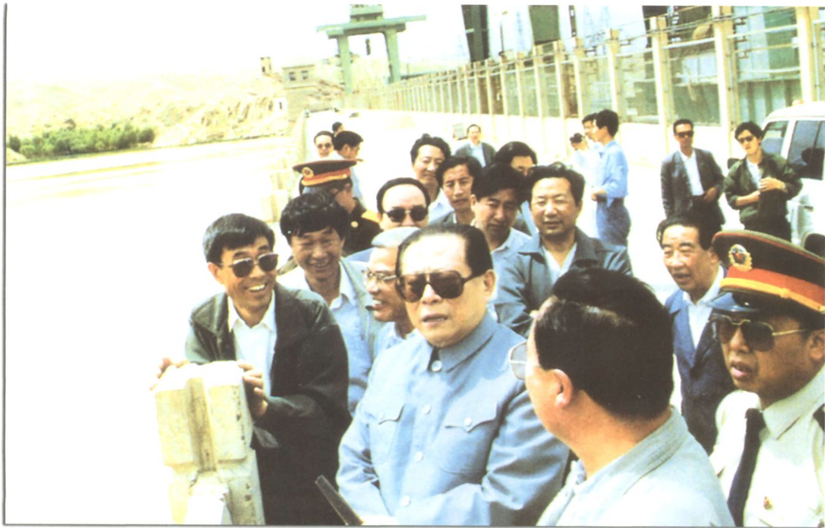
1991年6月17日，中共中央总书记江泽民来厂视察