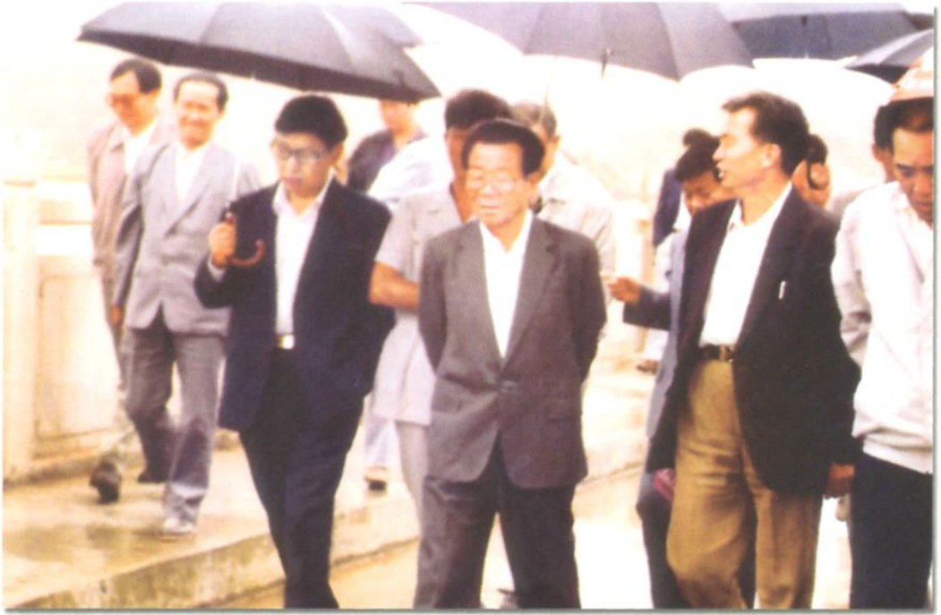
1993年8月24日，全国政协主席李瑞环来厂视察