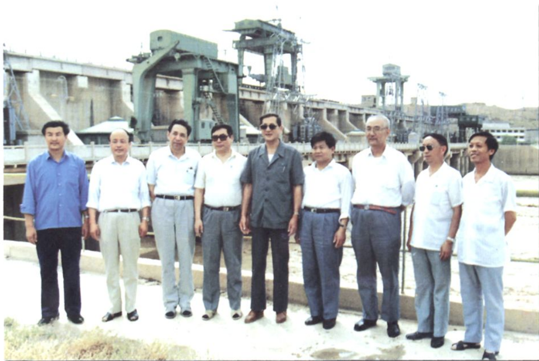
1991年7月21日，中华全国总工会主席倪治福来厂视察