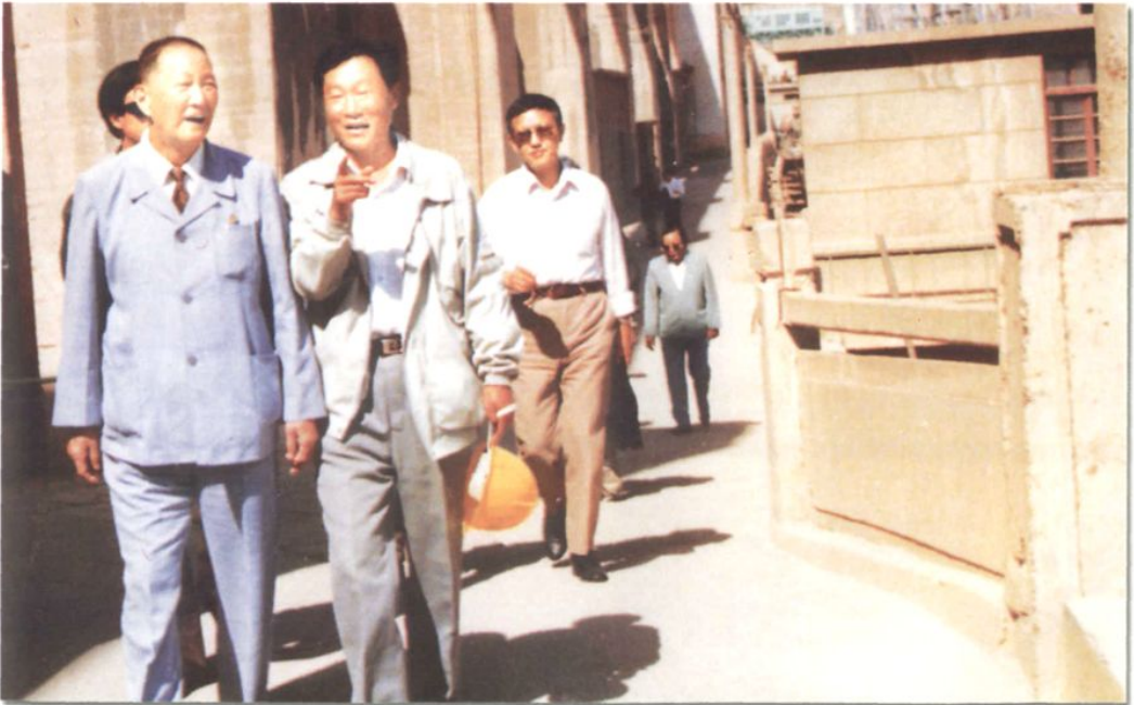
1994年9月10日，全国政协副主席洪学智来厂视察