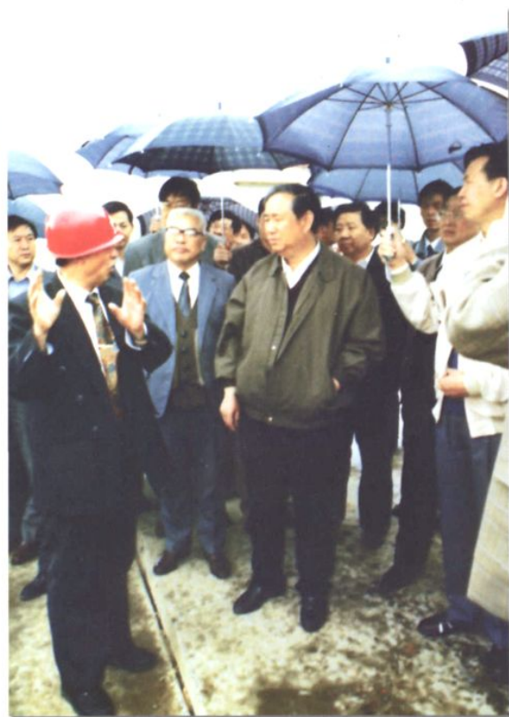
1996年5月14日国务院副总理姜春云来厂视察