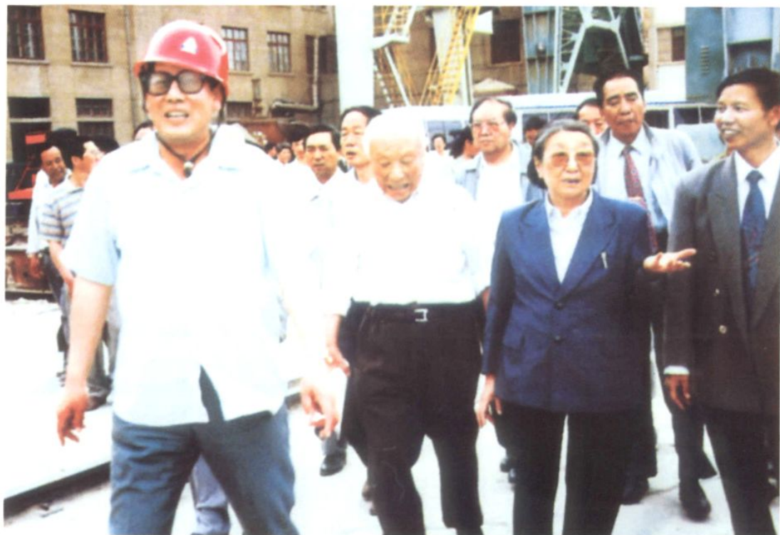
1997年5月7日，全国政协副主席钱正英来厂视察