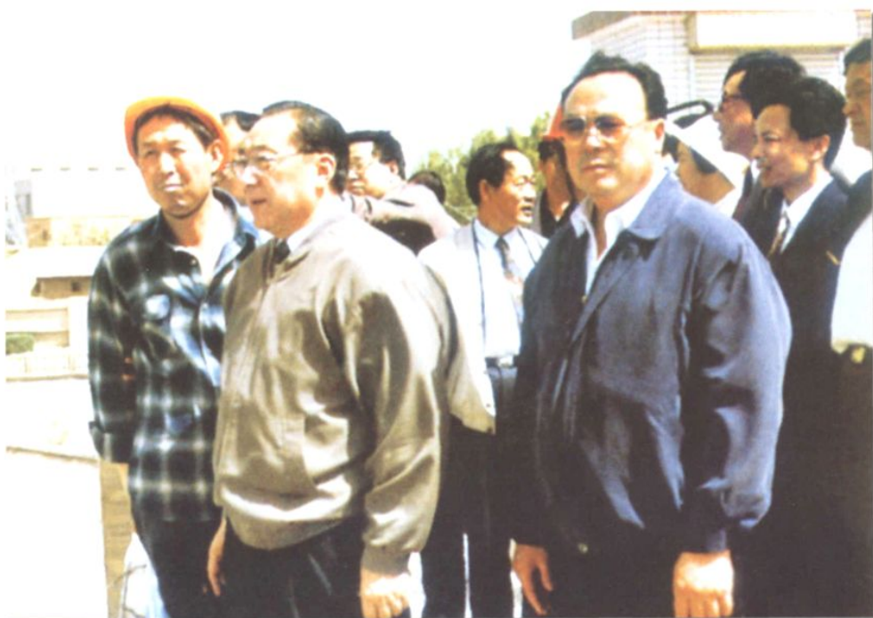
1995年5月23日，国务院副总理李岚清来厂视察