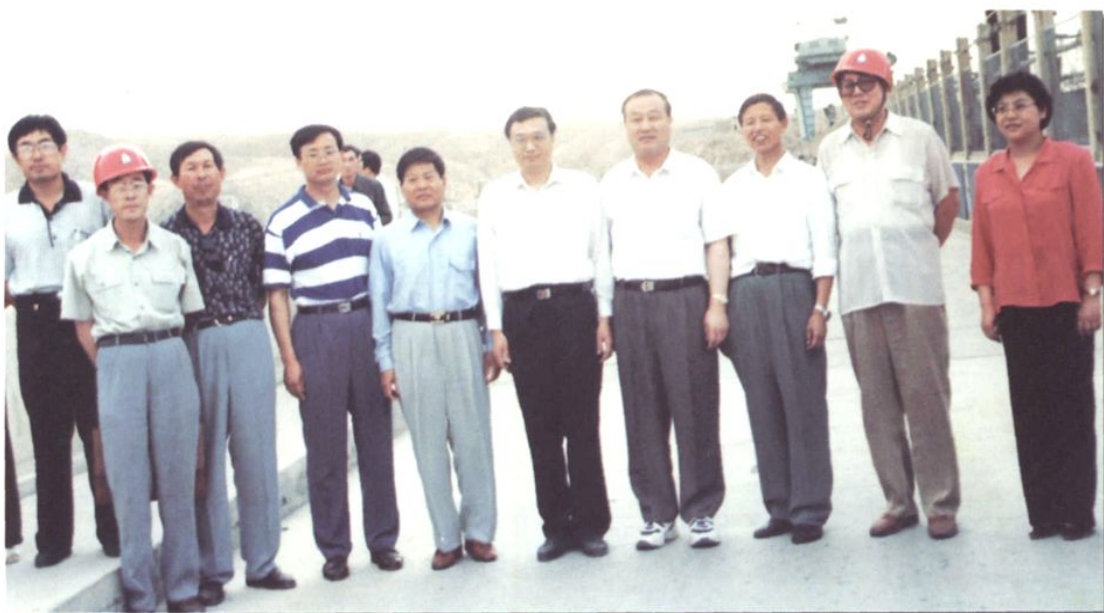
1997年6月17日，团中央第一书记李克强来厂视察