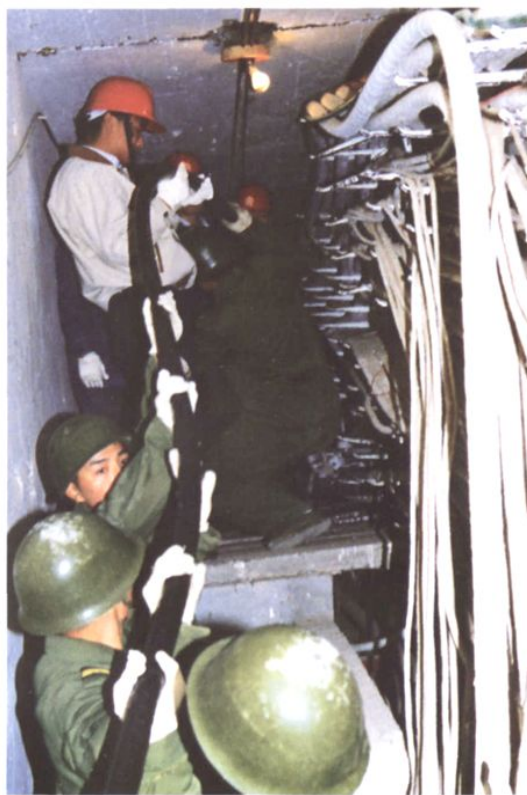
驻地部队帮助整理电缆