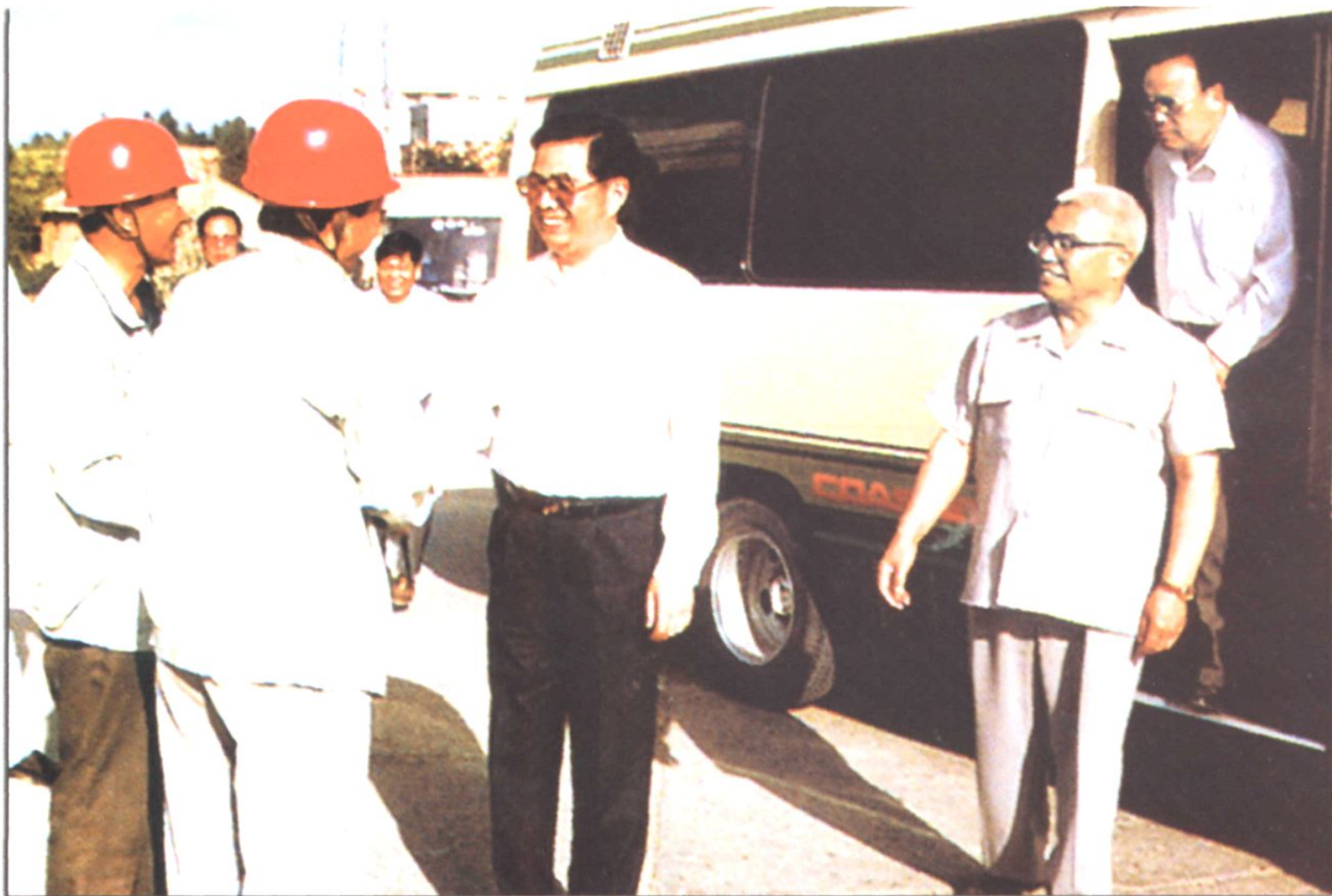
1995年6月12日，中共中央政治局常委、书记处书记胡锦涛来厂视察