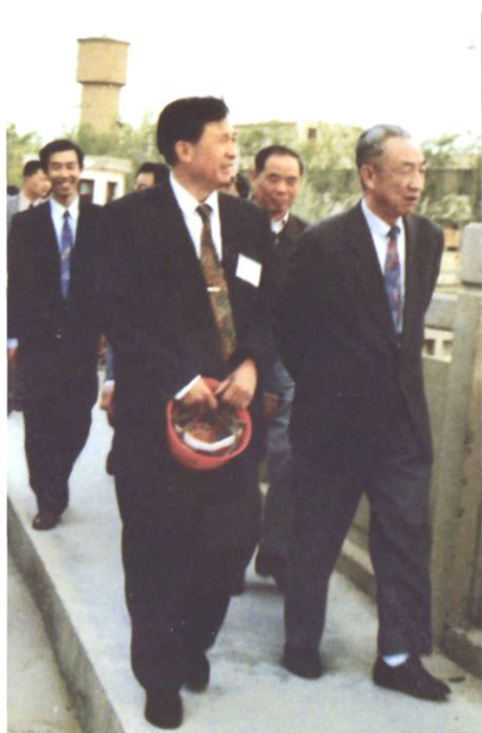
1996年5月12日国务院副总理邹家华来厂视察