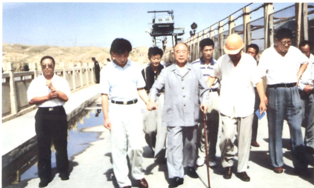
1997年8月，原中共中央副主席李德生来厂视察