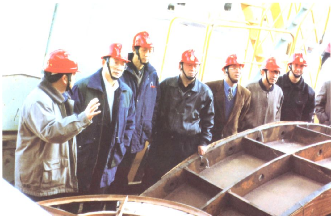
厂领导向宁夏电力局领导介绍设备情况