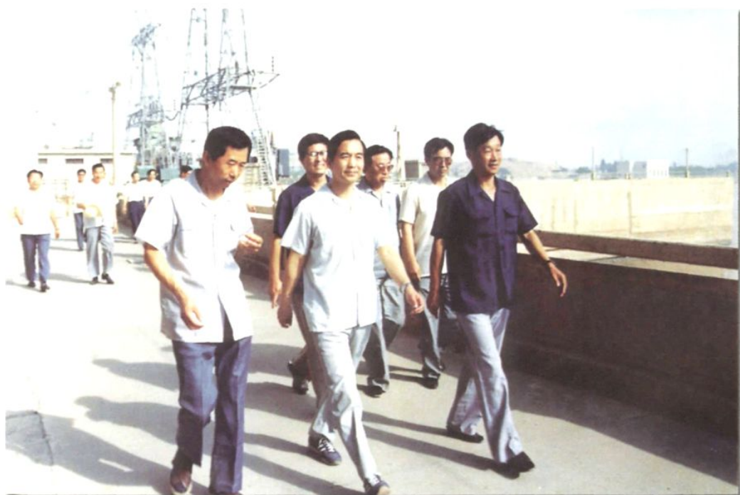
1990年7月24日，中共中央办公厅主任、书记处后补书记温家宝来厂视察