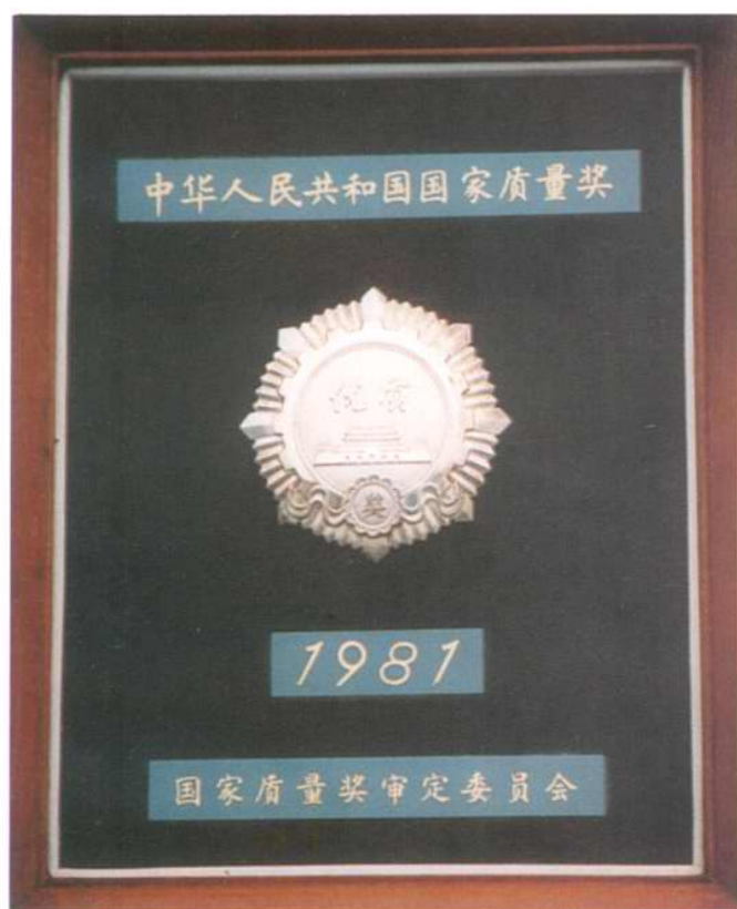
EY501A(B)行波管获国家 银质奖