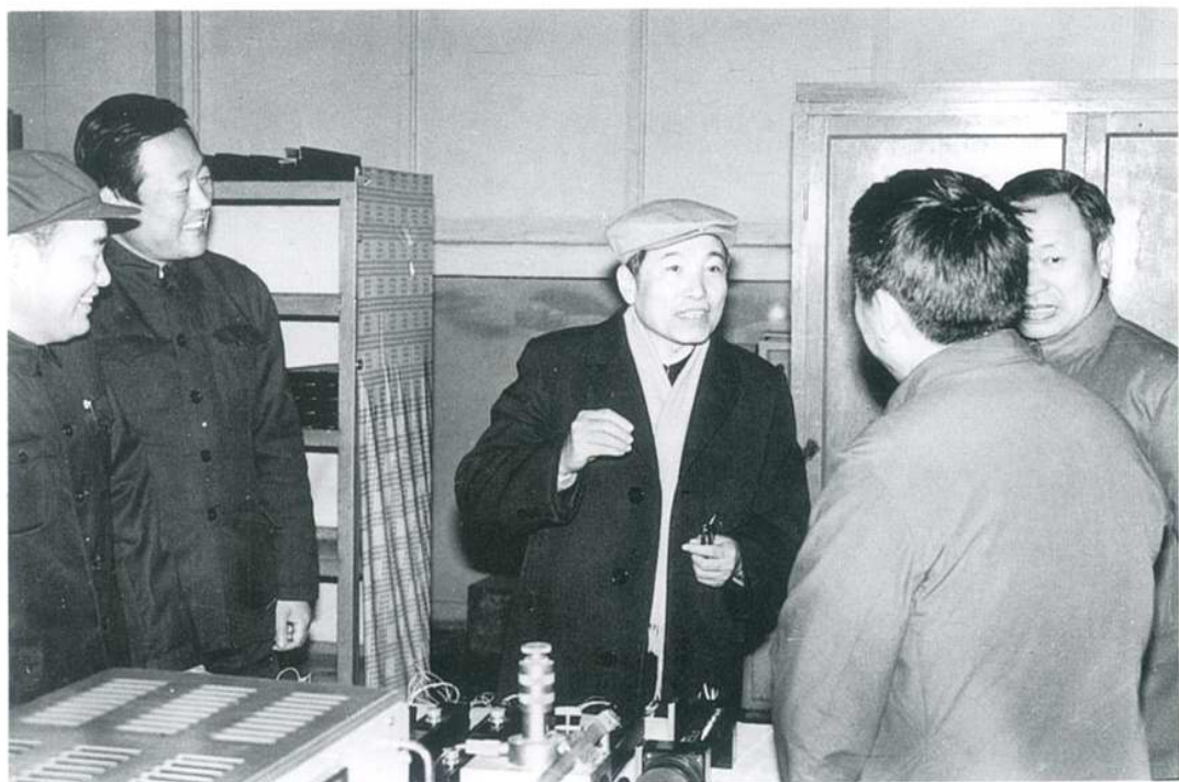
1984年11月邮电部部长杨泰芳视察工厂