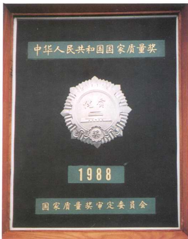
34Mb/s 中频脉码调制解 调机获国家银质奖