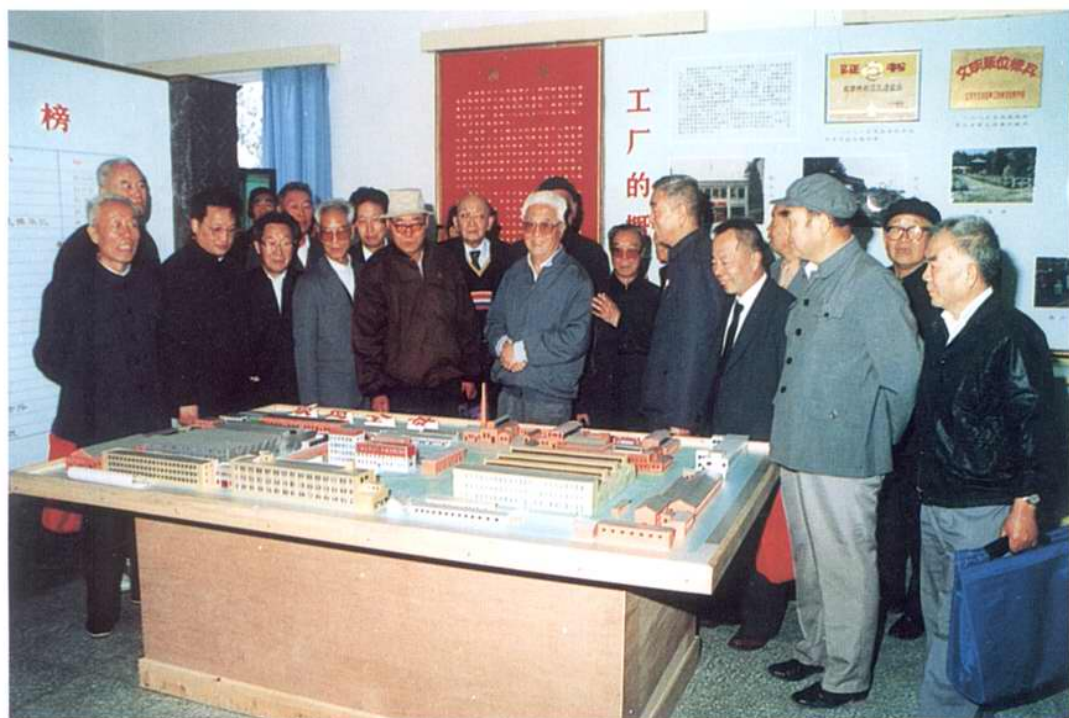
1991年9月邮电部原副部长成安玉、部工业局原局长马生山等参观厂史展览