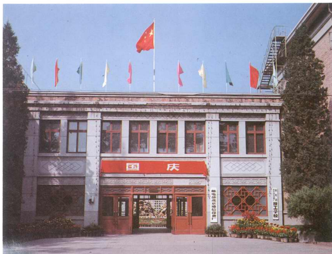
邮电部北京通信设备厂原正门