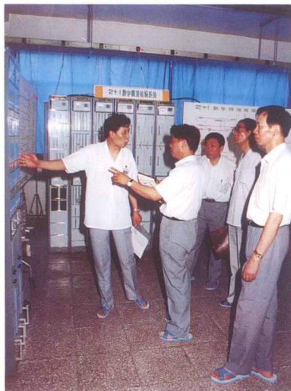
1990年7月邮电部副部长谢高觉等听取厂技术人员汇报新产品