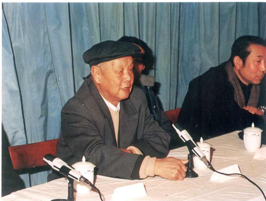
1989年2月邮电部原部长钟夫翔向全厂职工讲话