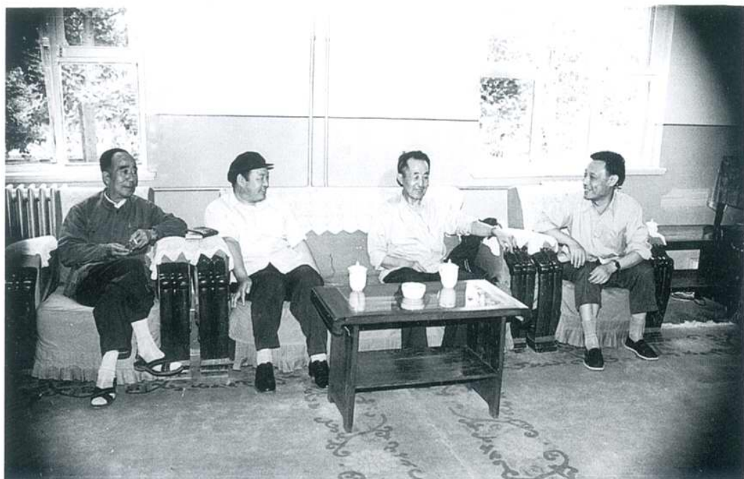
1981年6月邮电部部长文敏生、副部长李玉奎听取厂领导汇报