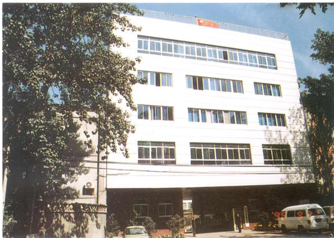
邮电部北京通信设备厂正门