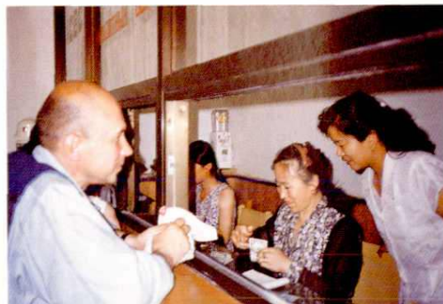
▲ 开拓国际金融业务