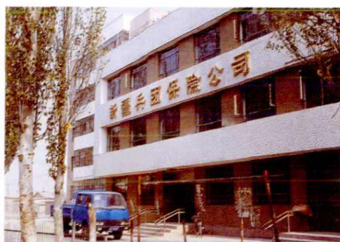
▲ 新疆生产建设兵团保险公司农九师分公司