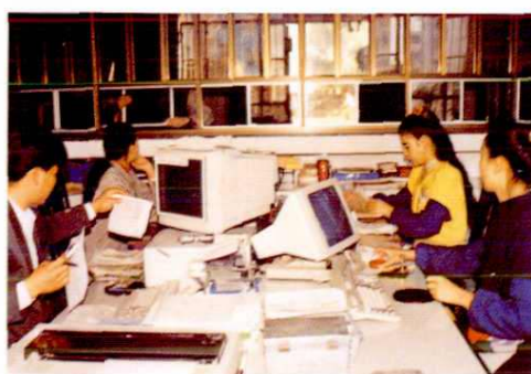
▲ 建设银行系统存款、储蓄业务实现微机化