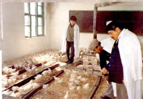
▲ 农行系统积极支持“菜篮子”工程