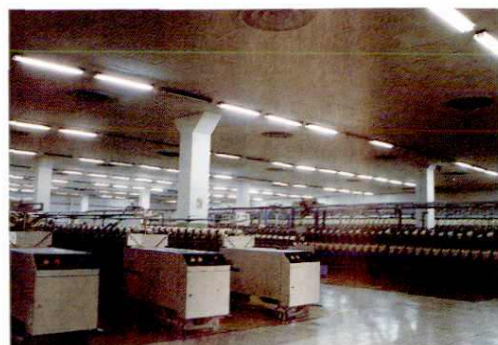
▲ 中外合资金塔毛纺织有限公司