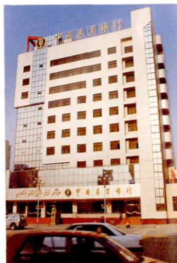
▶ 中国农业银行塔城地区中心支行