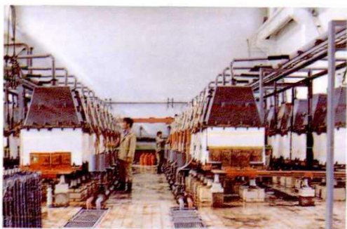
▲ 和布克赛尔化工厂