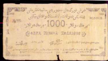
三区期票 1000 圓(1945 年)