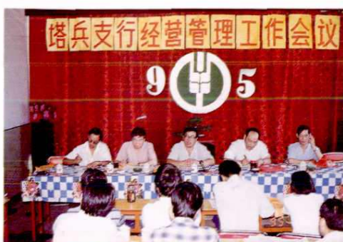
▲ 中国农业银行塔城兵团支行经营管理会议