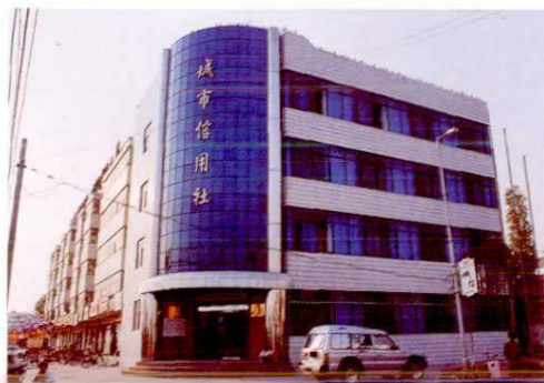
▲ 塔城市城市信用社