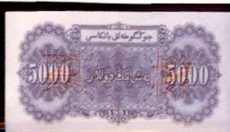
带维吾尔文的旧人民币伍千元(1951 年 10 月发行)