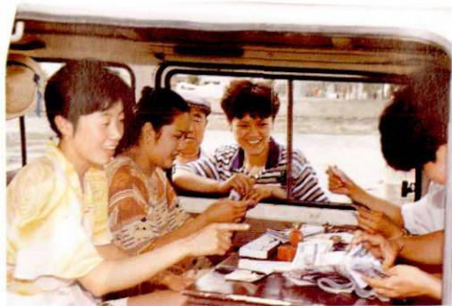
▲ 地区农行推行“汽车银行”服务