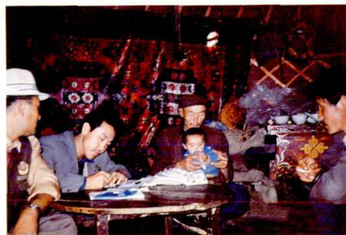
▲ 地区农行系统深入基层开展存款、贷款业务