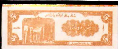
新疆銀圓票伍圓背面(辛兰亭签名)