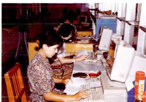
▲ 农行系统实现微机四级联网