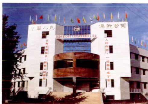
▲ 中国人民保险公司塔城地区中心支公司