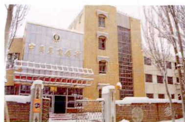
▲ 中国农业银行塔城兵团支行