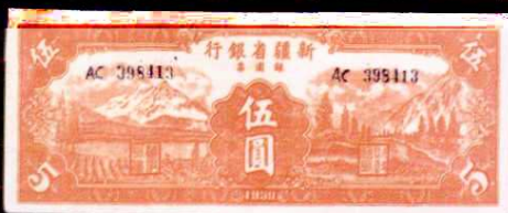
新疆銀圓票伍圓(1950 年)