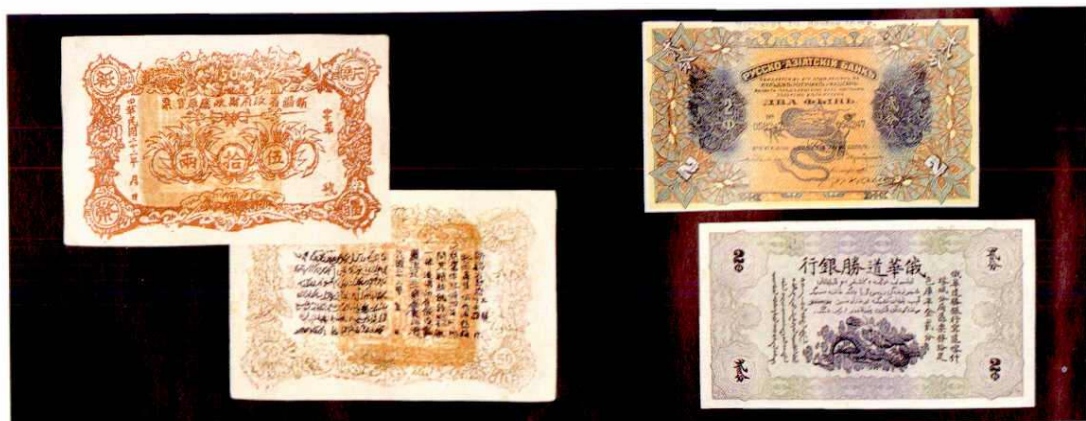
省票五十两(民国22年)