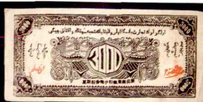
三区期票 3000 圓(1947 年)