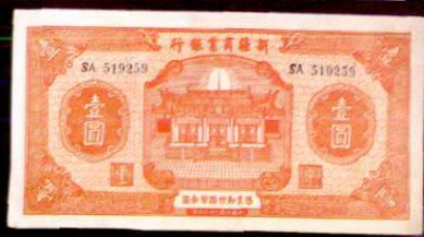
省市一圓(民国 28 年、29 年)