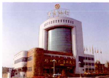
▲ 中国银行塔城地区支行