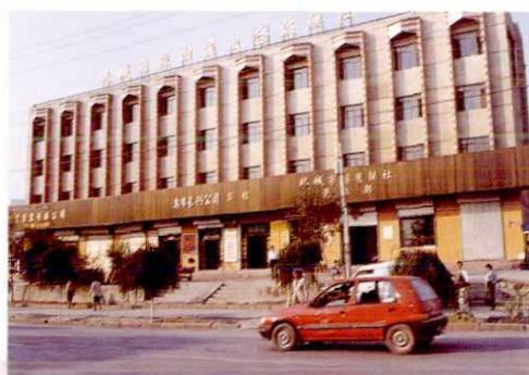
▲ 塔城市农村信用社