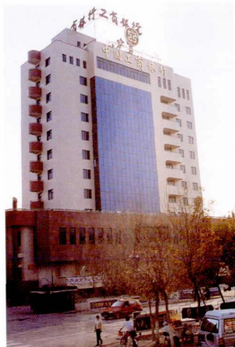
◀ 中国工商银行塔城地区中心支行