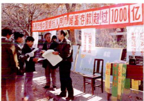
▲ 中国银行塔城地区支行街头宣传储蓄