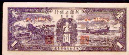
新疆銀圓票一圓(1949 年)