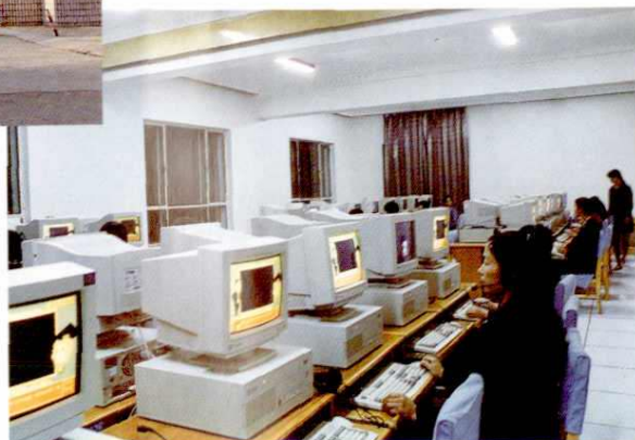
中国人民银行塔城地区分行 ▶ 计算机培训中心