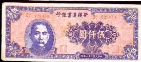
省市五千圓(民国 32 年)