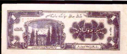
新疆銀圓票一圓背面(白文呈签名)