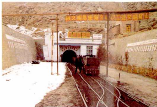
▲ 乌苏四棵树煤矿平洞