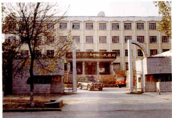
◀ 中国人民银行塔城地区分行