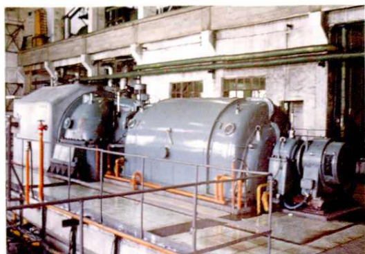
▲ 铁厂沟电厂一号机组