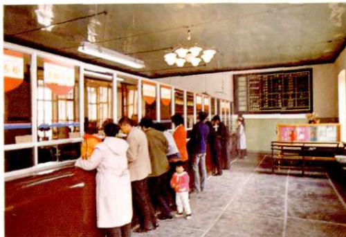
▲ 工商银行塔城市支行新华街营业厅