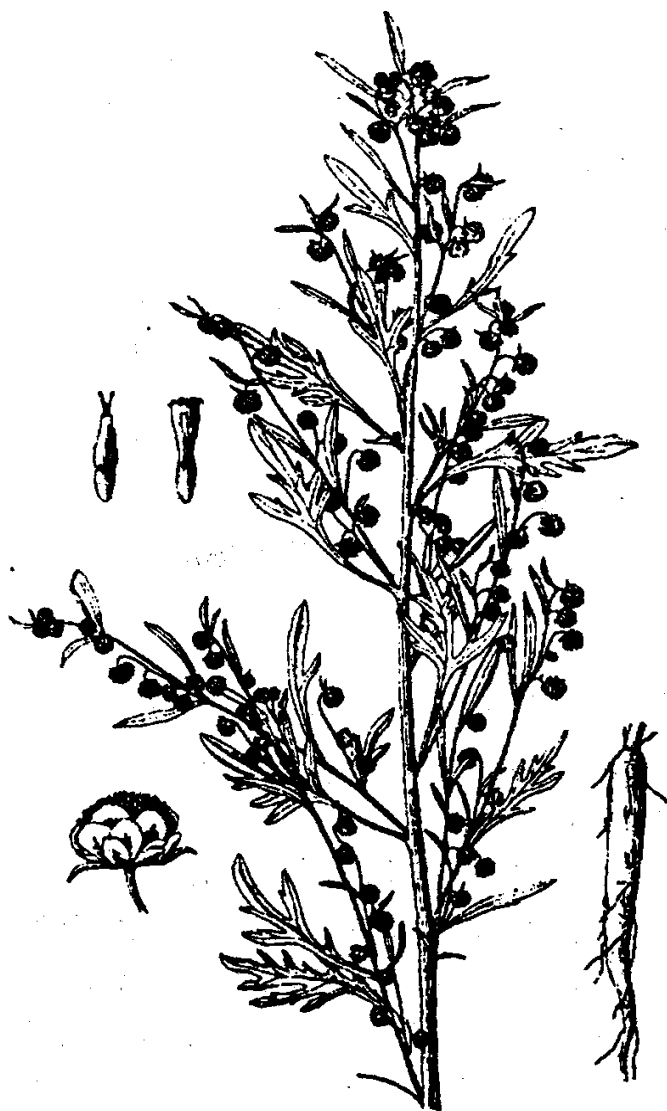
图2 大籽蒿 白蒿 Artemisia sieversiana Willd.