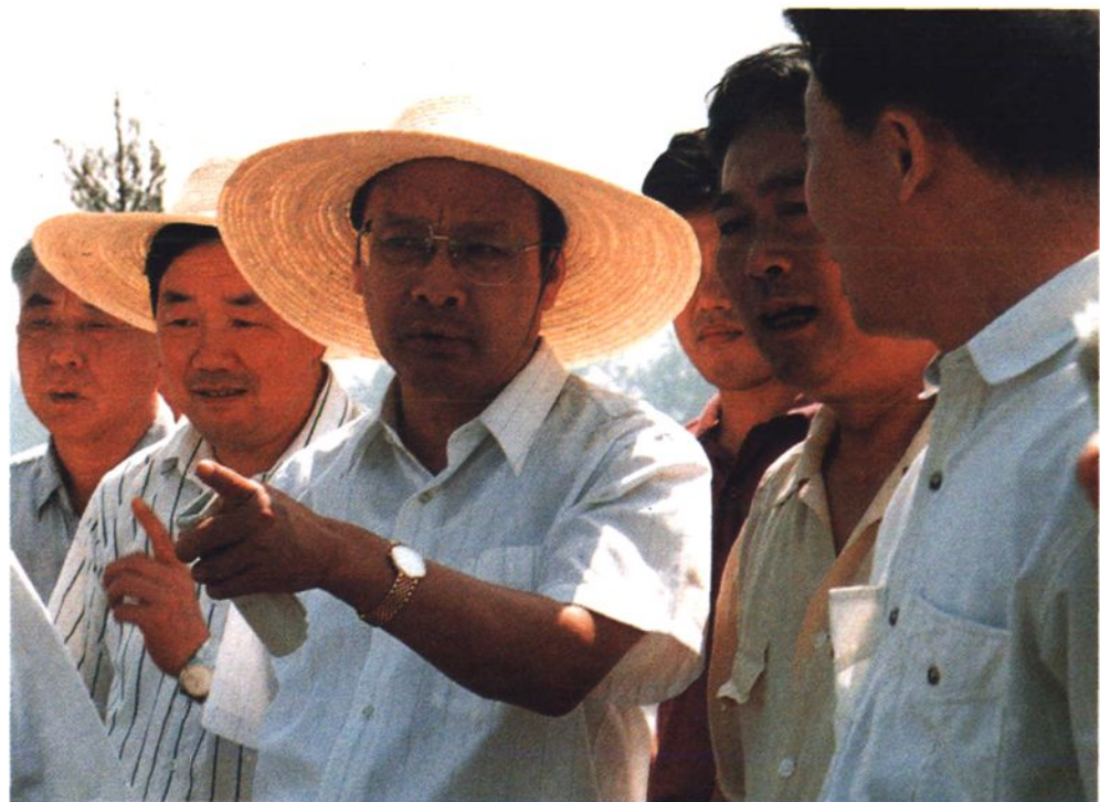
市委书记王武龙来溧水视察农业（1997.6）