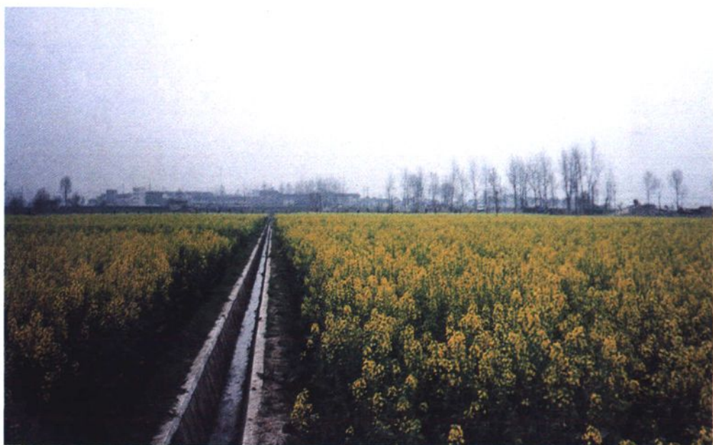
奉贤圩油菜丰产方（1998）