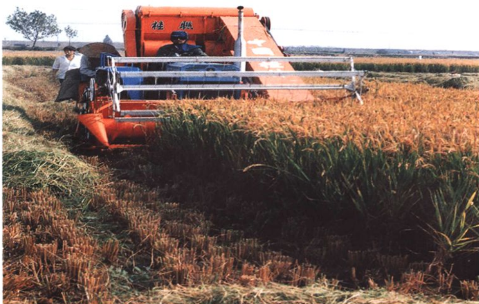
大陈村用小型联合收割机收脱水稻（1998）