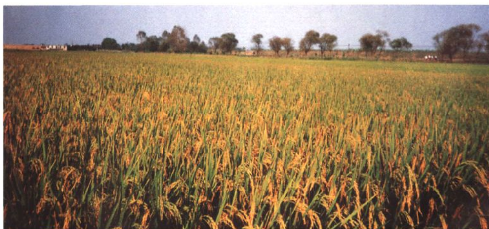
群力五谷圩水稻丰产方（1999）