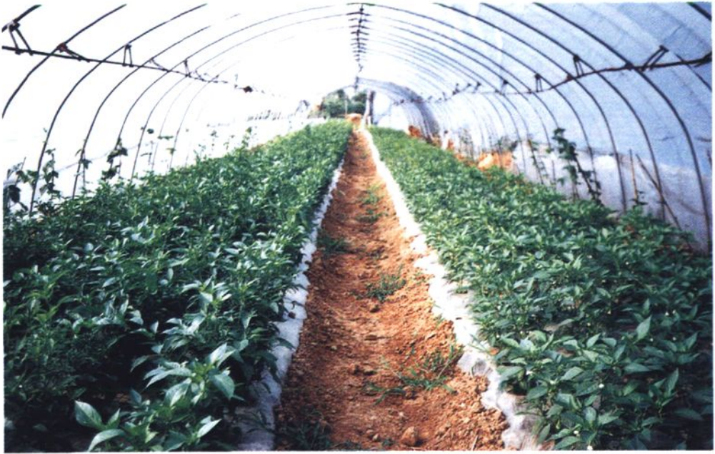
洪蓝镇西旺村蔬菜大棚育苗