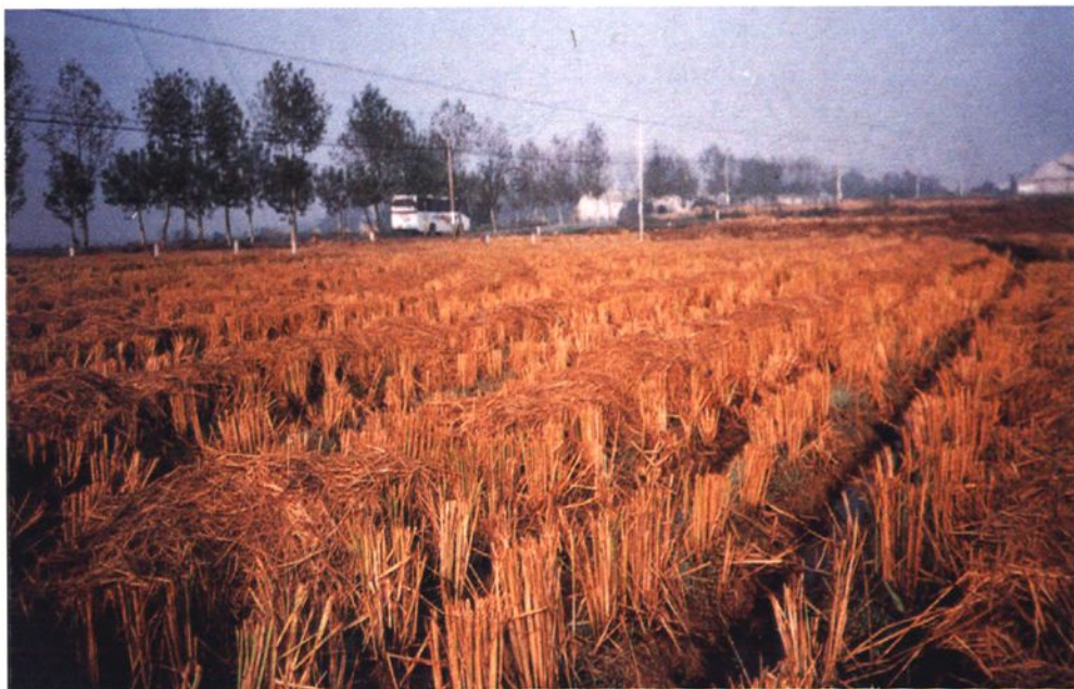
胜水村水稻留高茬还田（1999）