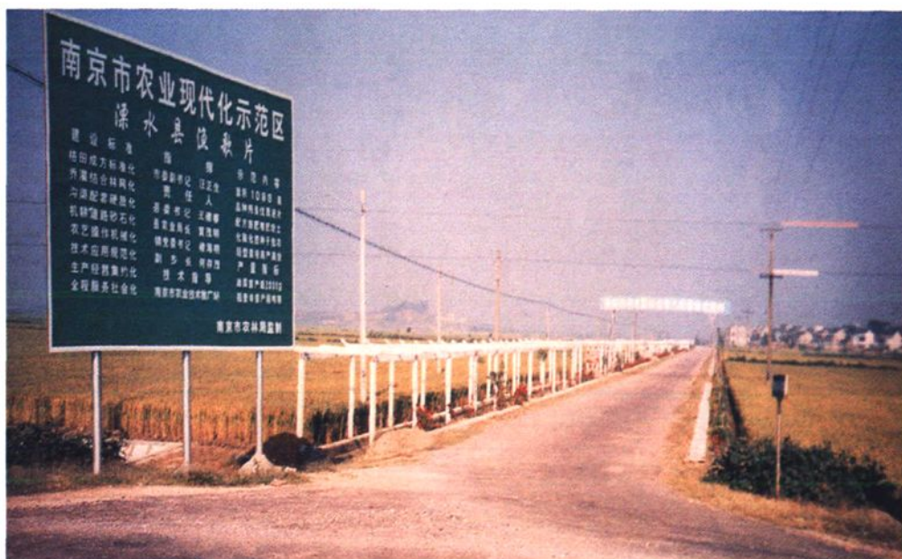
渔歌乡（今洪蓝镇）农业现代化示范片