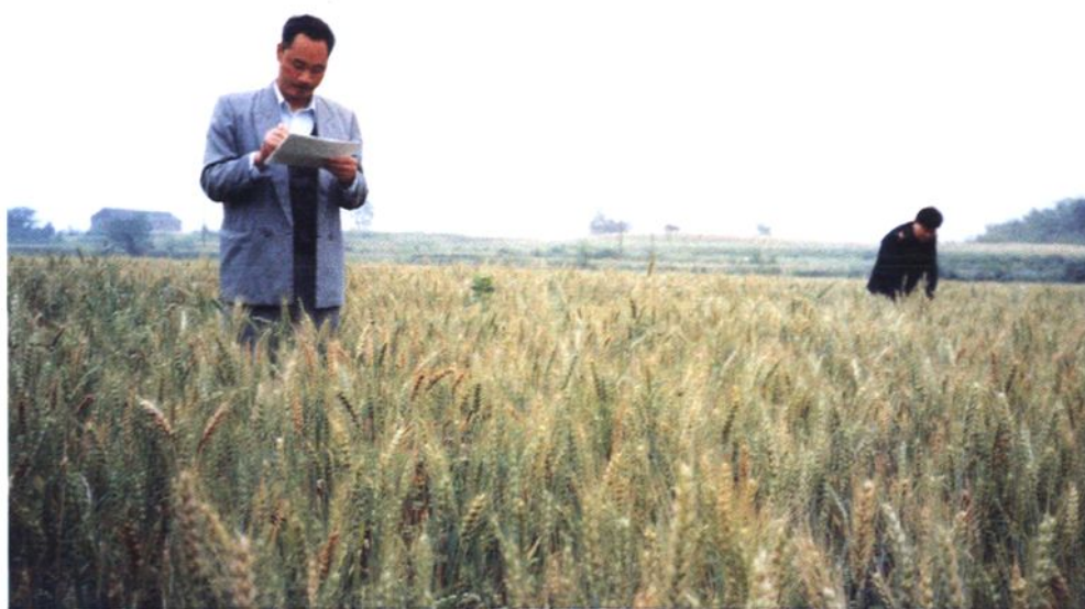
县植保人员进行麦田病虫草害综合考察（1998）