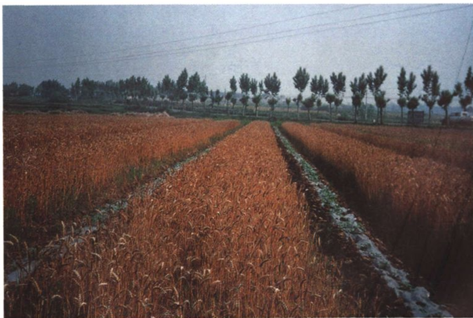
胜水村麦田套种西瓜 (1999)