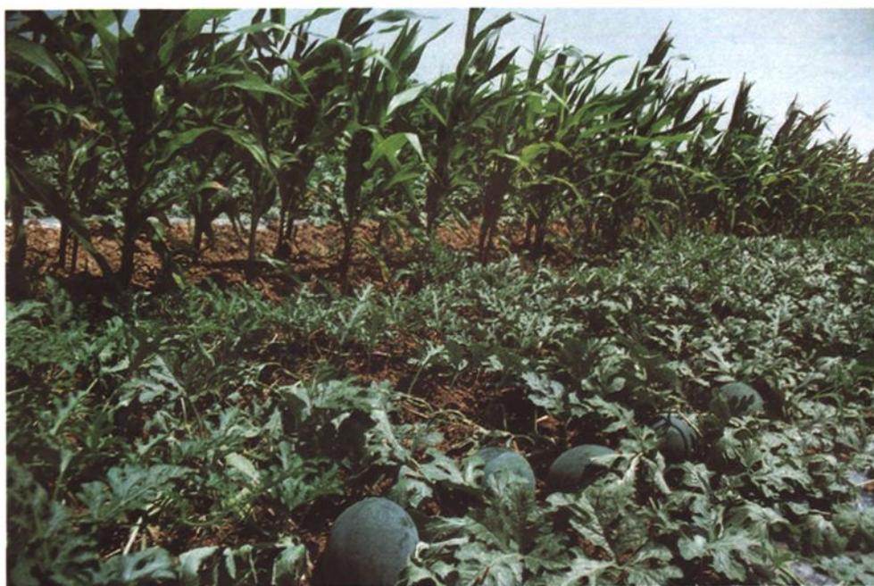
洪蓝镇西瓜、玉米间种 (1997)