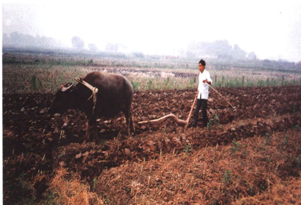
庆丰村（今中山村）农户用传统牛犁耕田（1999）