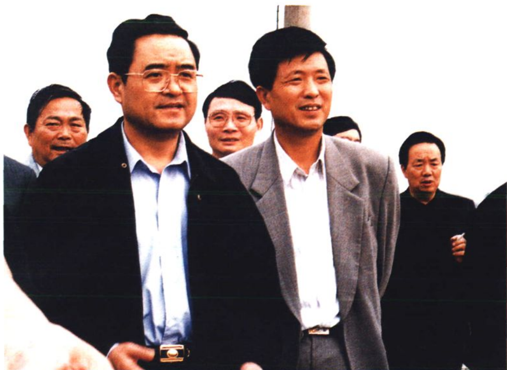
代省长季允石来溧水视察农业（1998.10）