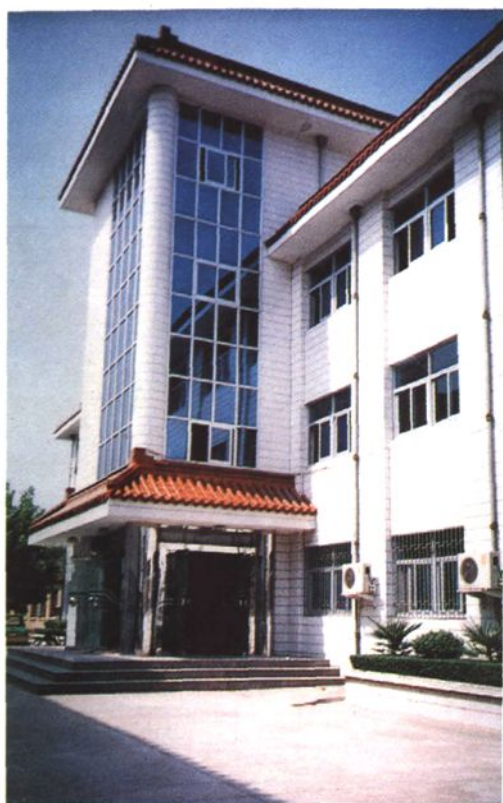
县农业局办公大楼一角