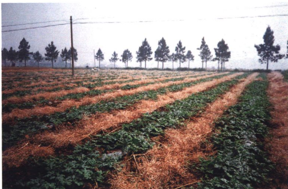
庆丰村（今中山村）油菜秸还田（1999）