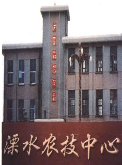
县农业技术推广中心一角