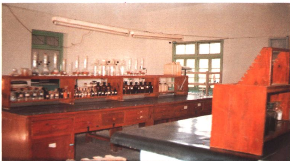
县土壤化验室一角