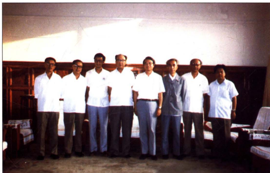
上图：1985年，吉林省社会科学院第一任院长佟冬。