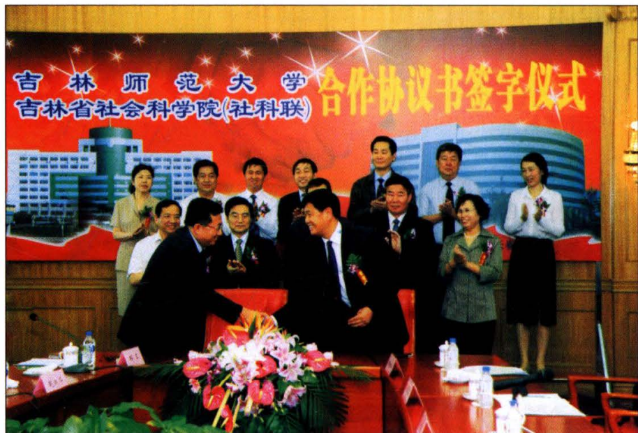
上图：2007年，蒙古国总统恩赫巴亚尔先生接见在蒙古国参加国际学术会议的 邴正院长。