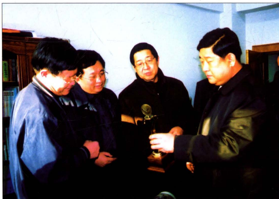
上图：2002年，省委书记王云坤来我院检查指导工作。