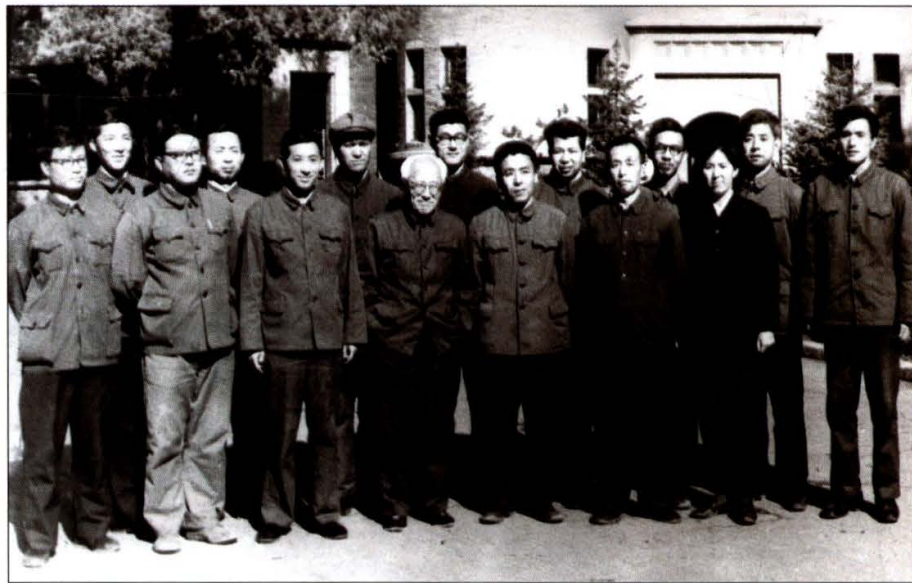
上图：1963年，东北文史研究所建所周年纪念。