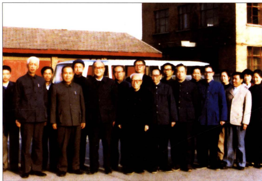
上图：1978年，吉林省哲学社会科学研究所部分人员合影。