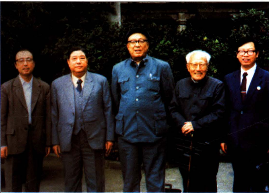
上图：1987年4月，吉林省委副书记王忠禹到我院检查指导工作。