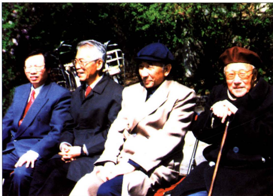
上图：1991年7月，吉林省委书记何竹康来我院检查指导工作。