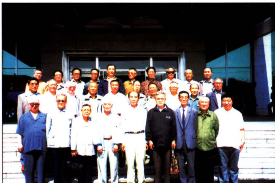
上图：2001年8月，中共中央政治局委员、中国社会科学院院长李铁映在吉林视察期间与我院领导合影。