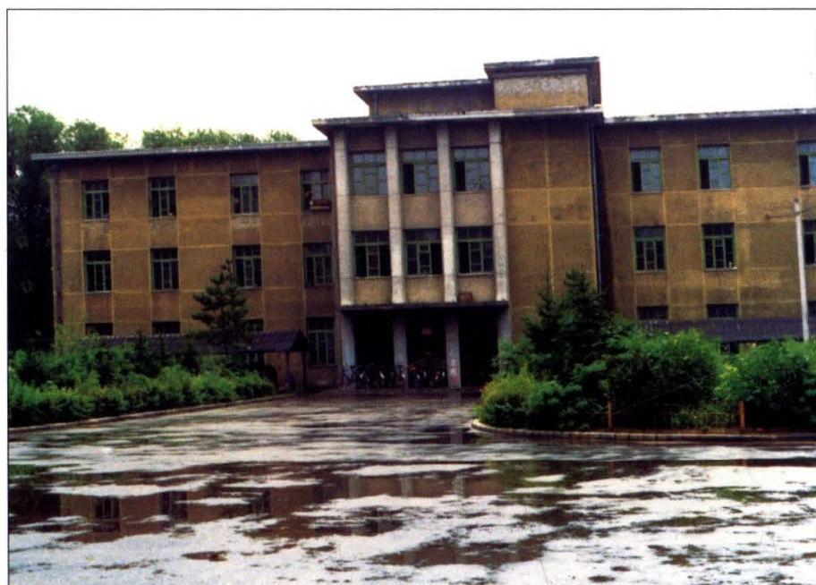
上图：东北文史研究所旧址。