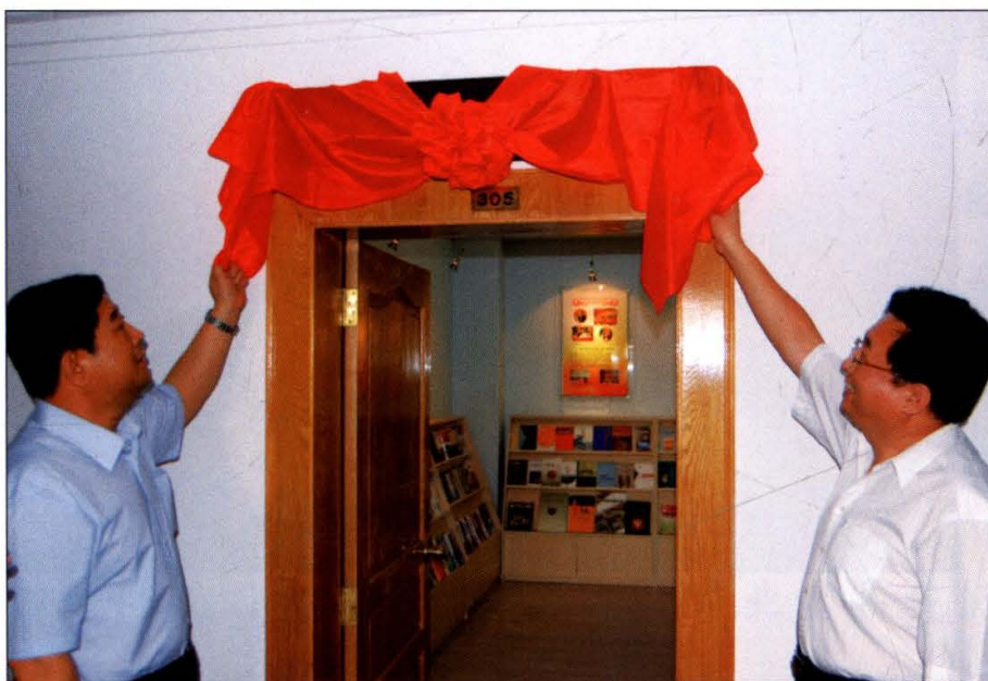
上图：原吉林省社科院副院长，现国家计生委主任李斌。