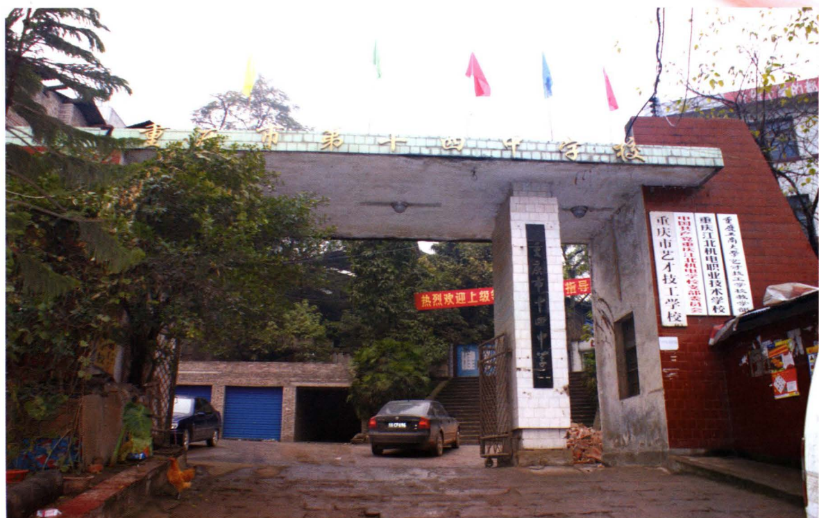
位于街境头塘的重庆市十四中学（2008年摄）