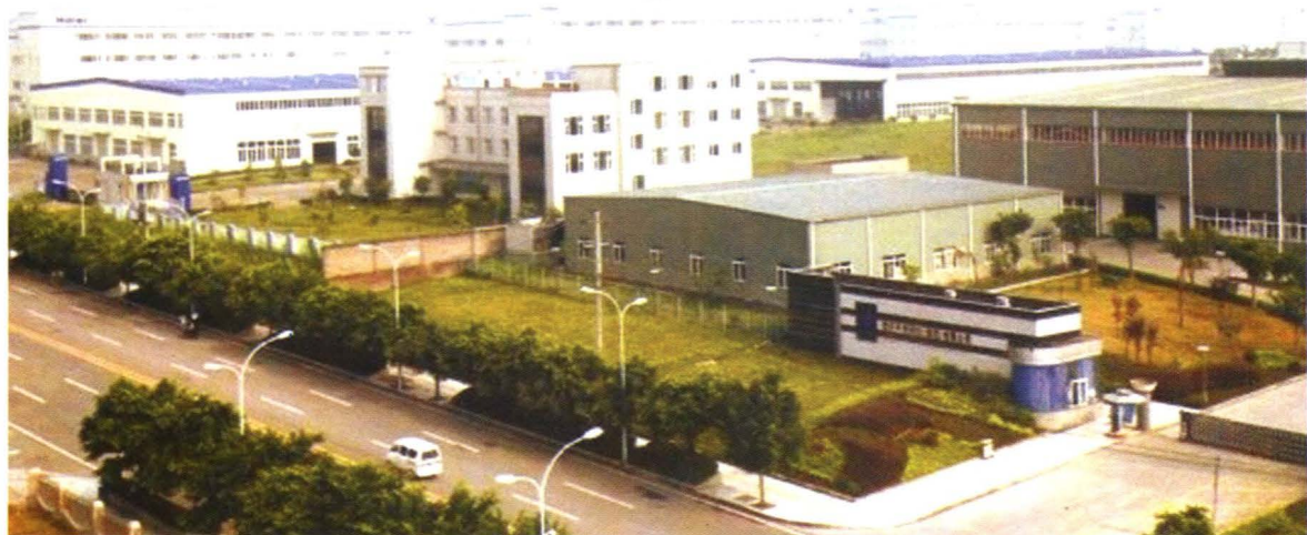
港城工业园区D区（2008年摄）