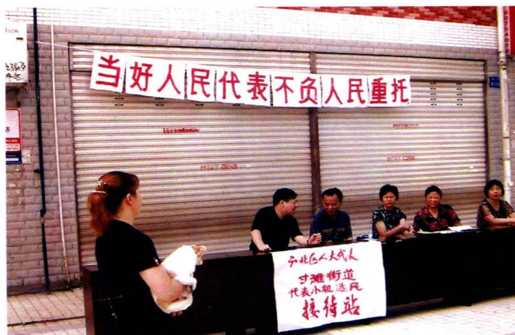
第十五届区人大代表在街 境街头接待辖区选民，倾听、 收集选民的意见