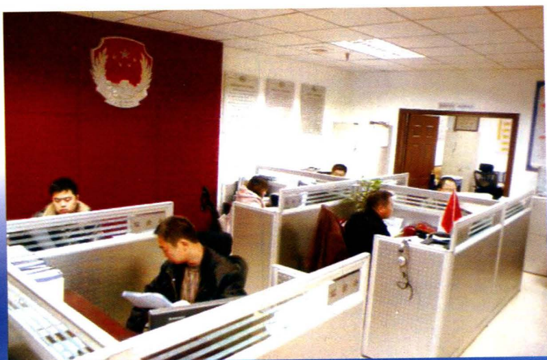
有效利用有限的办公 场地 (2009年摄)