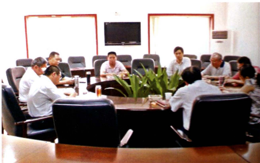
党工委班子中心组 学习（2008年摄）