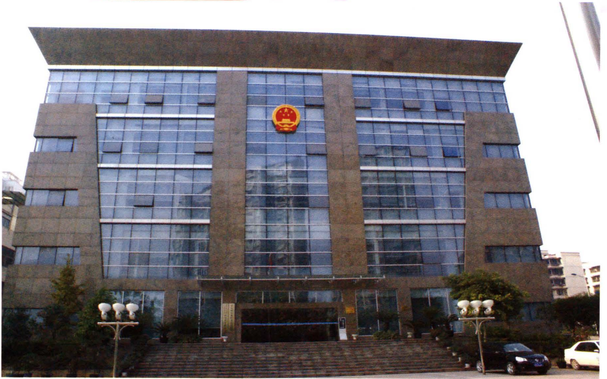
江北区人民检察院办公楼（金港新区27号）于2007年建成投入使用（2008年摄）