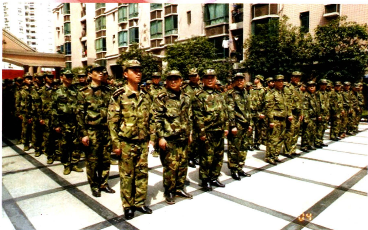
2004年4月，寸滩街道预备役官兵编成的重庆预备役高射炮师一团三营八连在金科广场进行队列训练（上图）及在团训练中心进行三七高炮训练（下图）