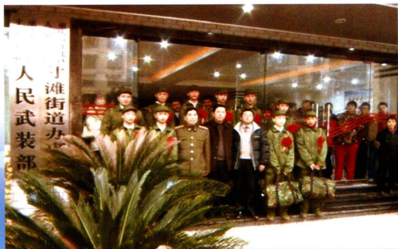
欢送2006年度新兵入伍