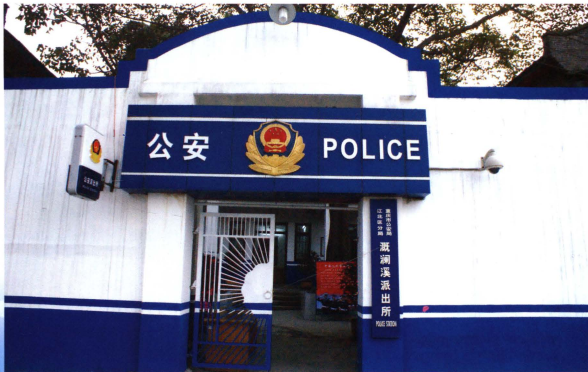
位于街境头塘正街55号的重庆市公安局江北区分局溉澜溪派出所（2008年摄）