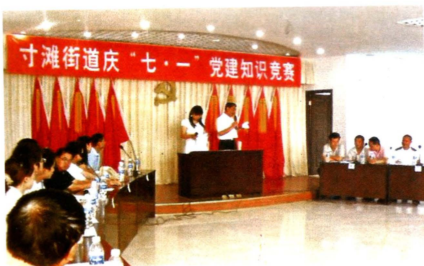
街道庆七一党建 知识竞赛 (2008年摄)