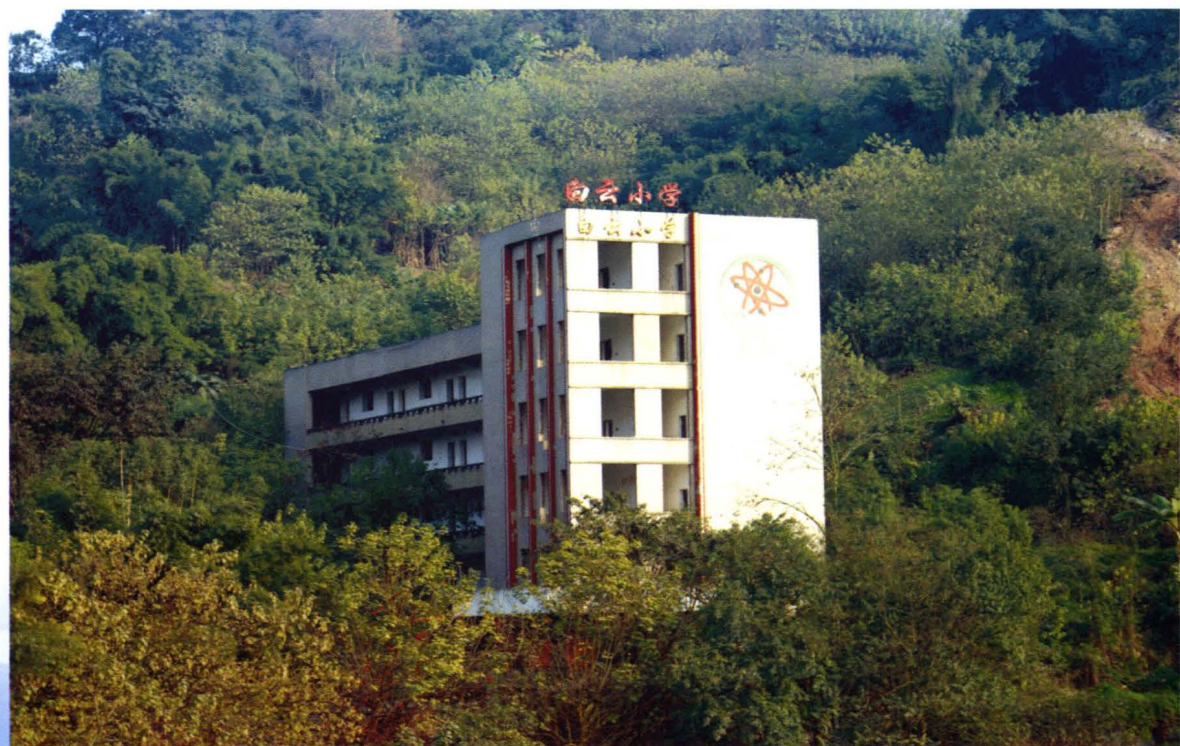
位于茅溪村的白云小学（2008年摄）