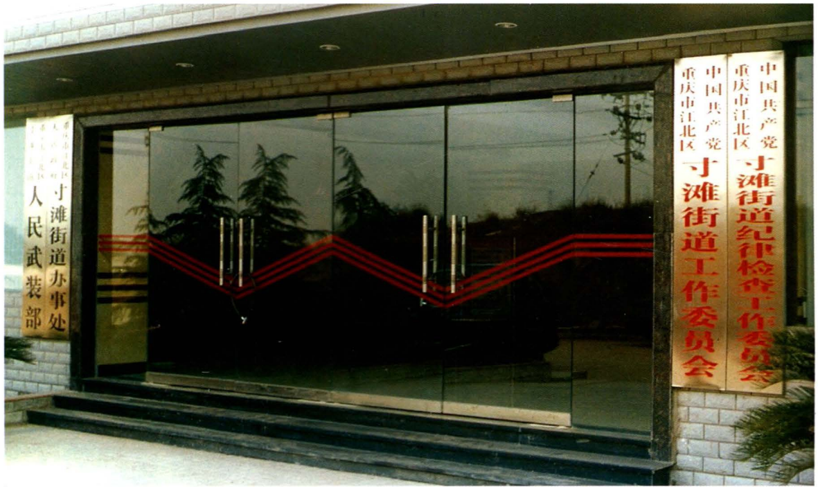
位于街境金港新区6号的江北区人民政府寸滩街道办事处（上图）及寸滩街道社会保障服务中心（下图），于2004年9月26日开始正式对外办公