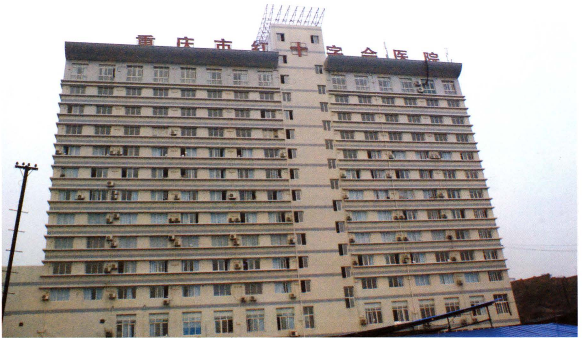
位于街境海尔路168号的重庆红十字会医院新院舍于2006年建成投入使用