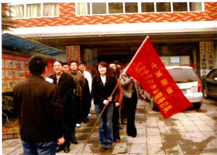
成立于2004年3月的街道红 岩党员志愿者服务总队