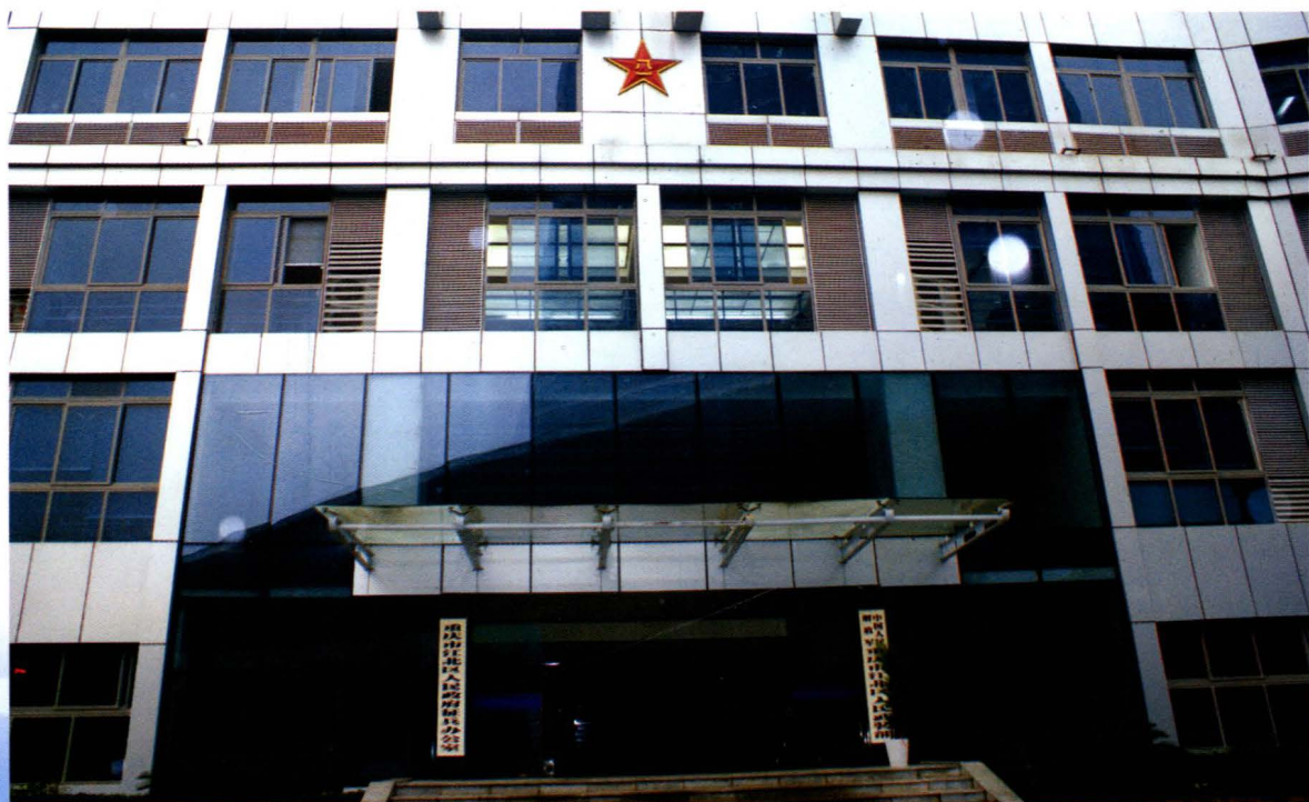
位于街境金港新区的中国人民解放军重庆市江北区人民武装部办公大楼，已于2007年建成投入使用