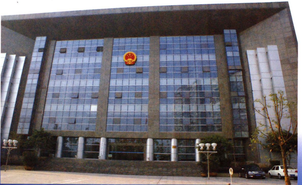
江北区人民法院大楼（金港新区28号）于2007年建成投入使用（2008年摄）