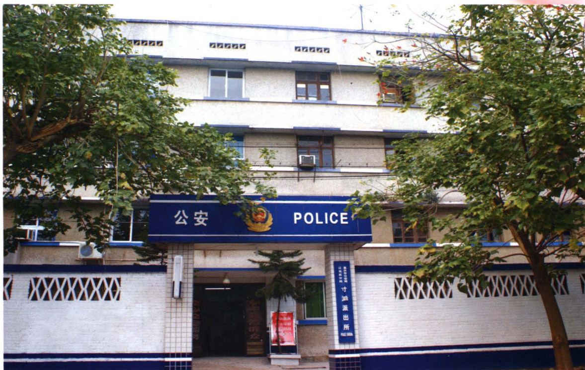
位于街境三家滩至德里54号的重庆市公安局江北区分局寸滩派出所（1991年由寸滩场搬迁至此）（2008年摄）