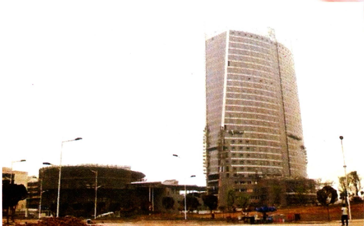
位于街境金港新区16号的江北区行政服务中心（2008年摄）