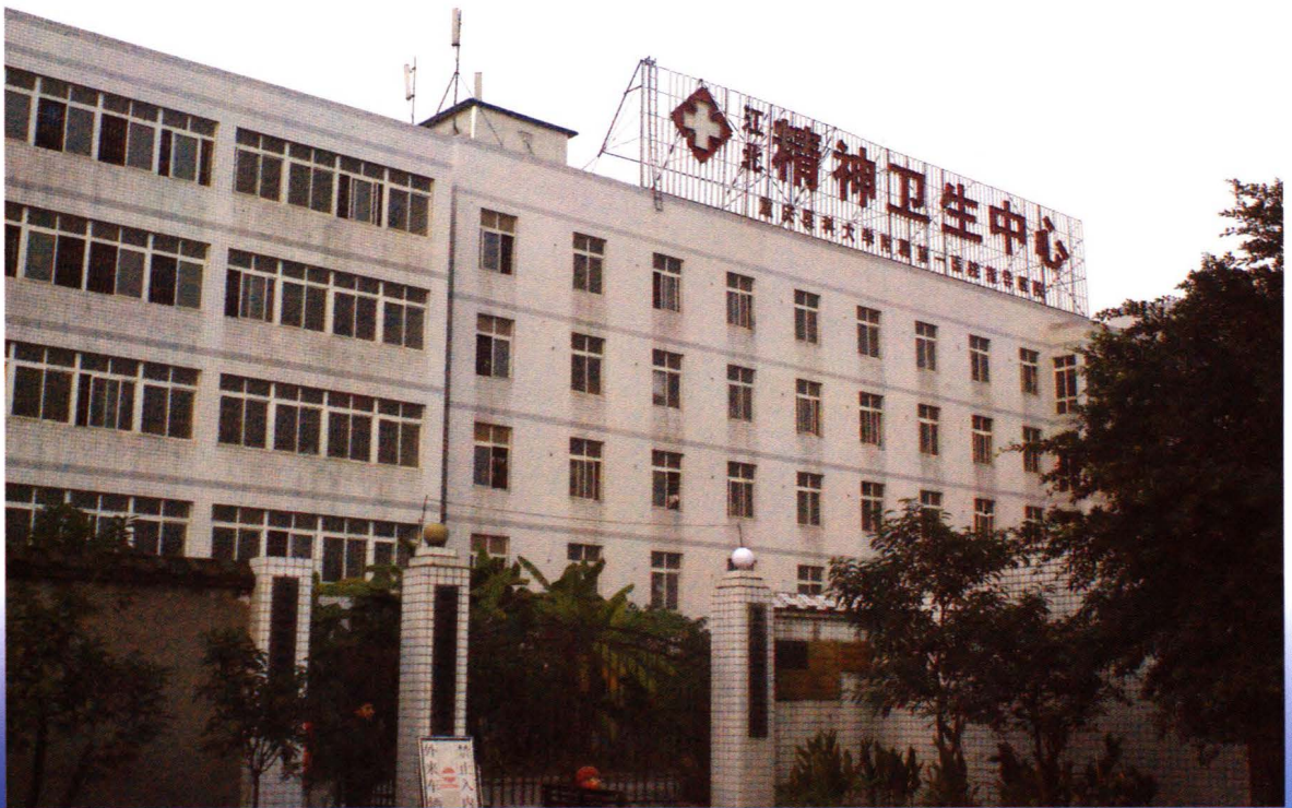
位于街境五江路26号的江北精神卫生中心新址于2006年12月建成投入使用