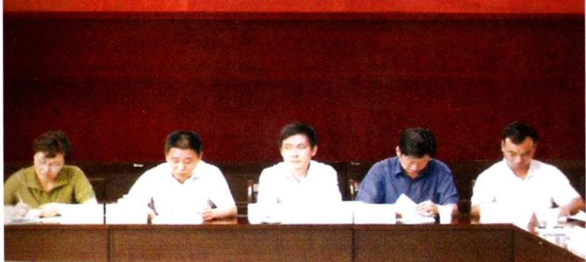
党工委班子民主生活 会（2008年摄）