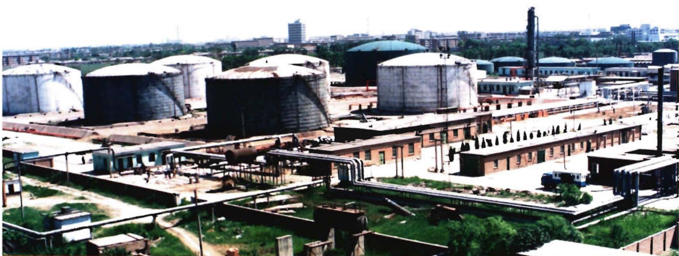
采油一厂任一联合站