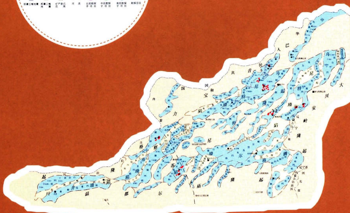
二连探区油气勘探形势图