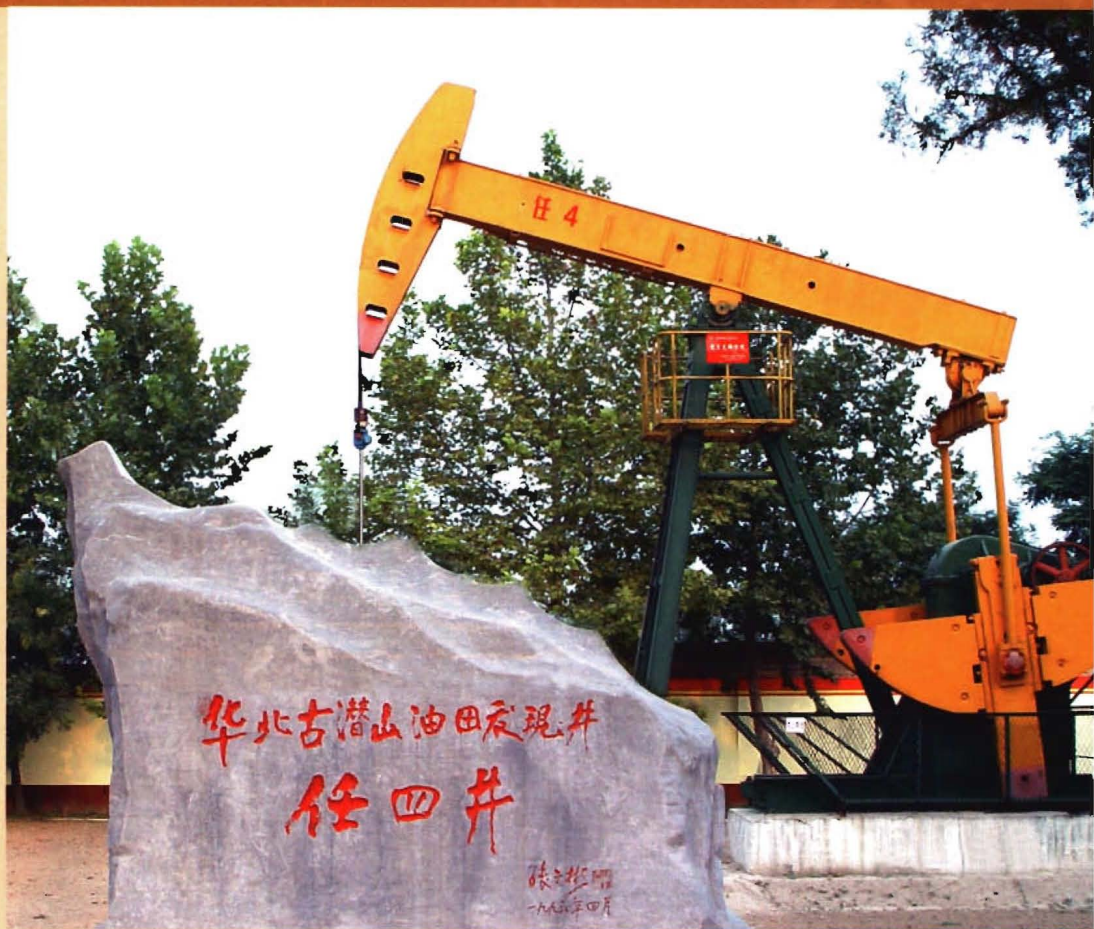
华北古潜山油田发现井——任四井。