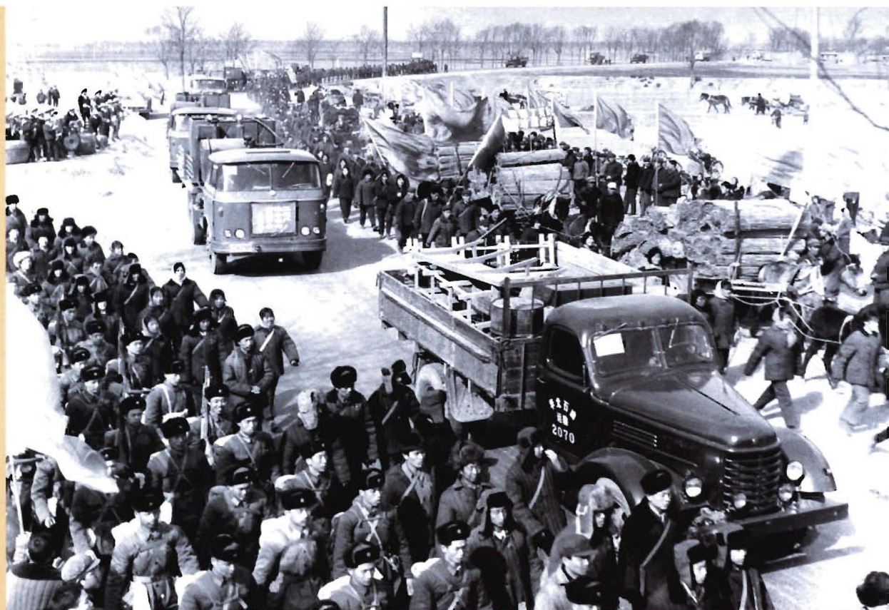
各路石油大军从祖国四面八方云集冀中平原，揭开了华北油田会战的序幕。

1975年7月8日，华北油田发现井——任4井在3200.64米古潜山碳酸盐岩喜获日产千吨油气流，给冀中勘探带来一片生机。由此确定了将包括任4井在内的6口井作为整体解剖任丘构造的勘探方案，最终证实了任丘—辛中驿潜山带是成带连片的碳酸盐岩大油田，并荣获国务院发展研究中心授予的“中华之最”——“中国最大的碳酸盐岩油田——任丘油田”称号。图为任4井出油后在现场召开的祝捷誓师大会。