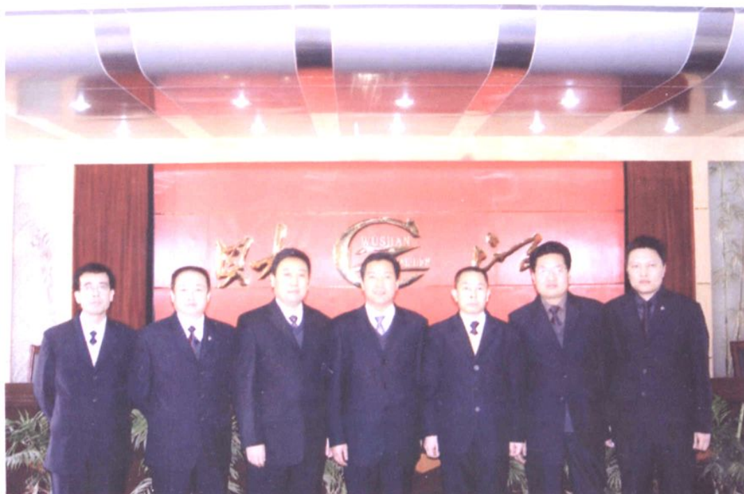
财政局领导班子合影