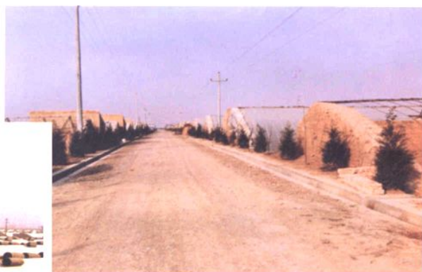
农业综合开发项目建设—— 农电、渠、路、日光温室配套工程