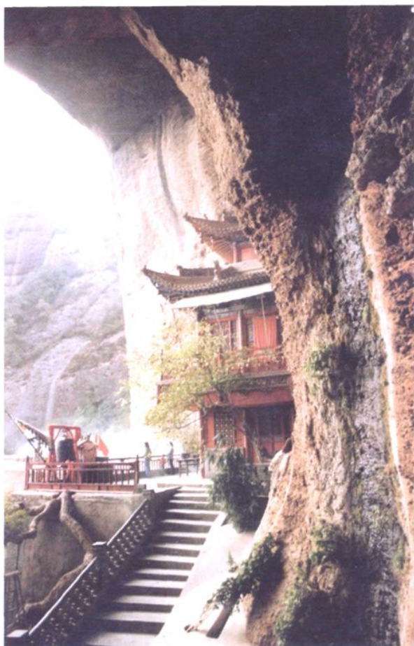
◀武山旅游胜地—水帘洞