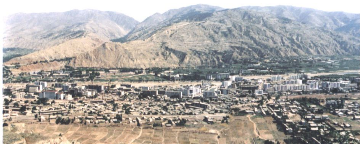
旧城改造前的武山县城