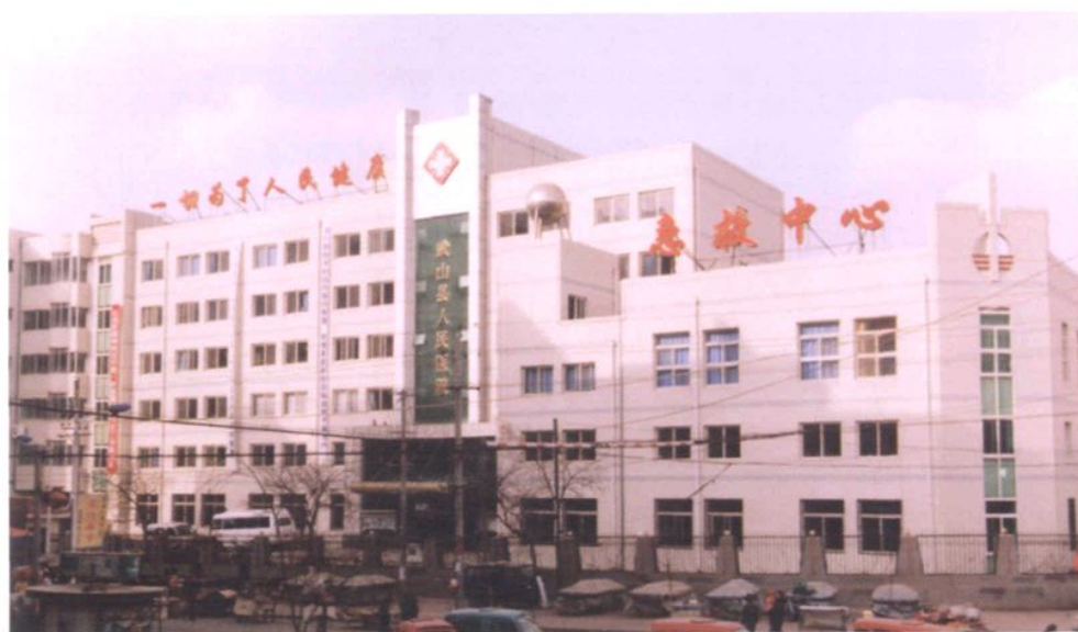
蒸蒸日上的医疗卫生事业