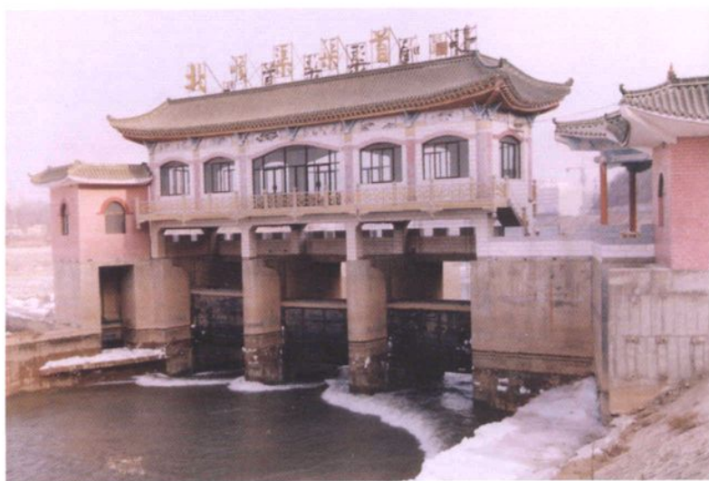
方兴未艾的水利建设事业