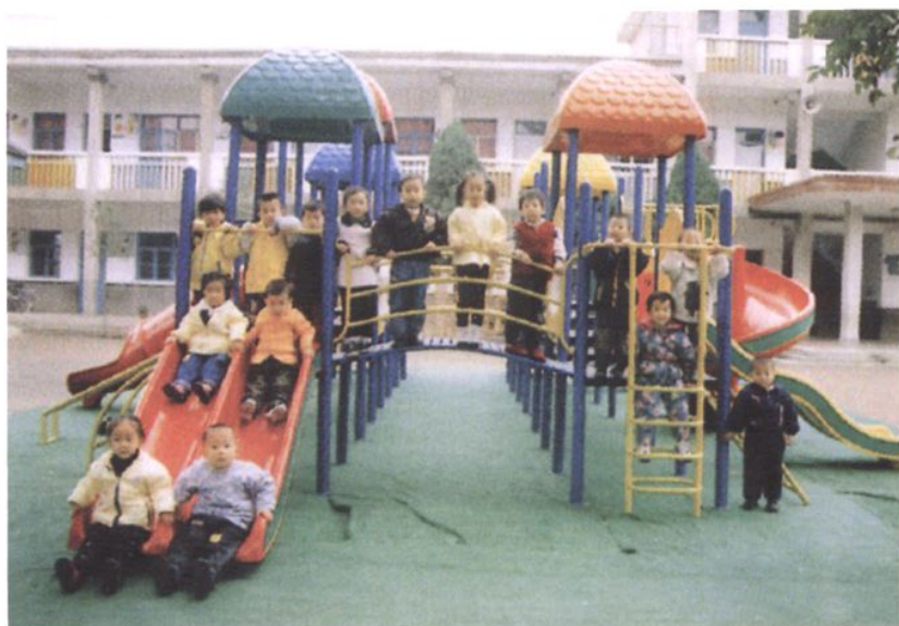
蓬勃发展的教育事业