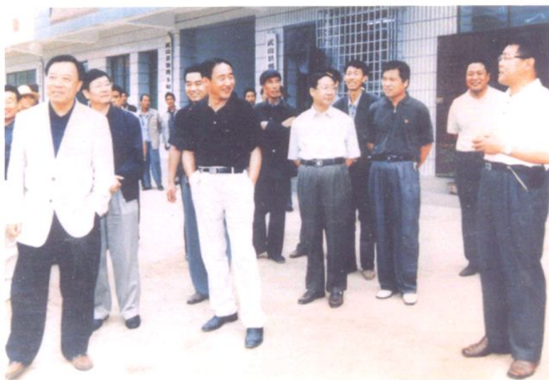
2002年7月，省长陆浩(左一)到武山县调研农村税费改革工作。