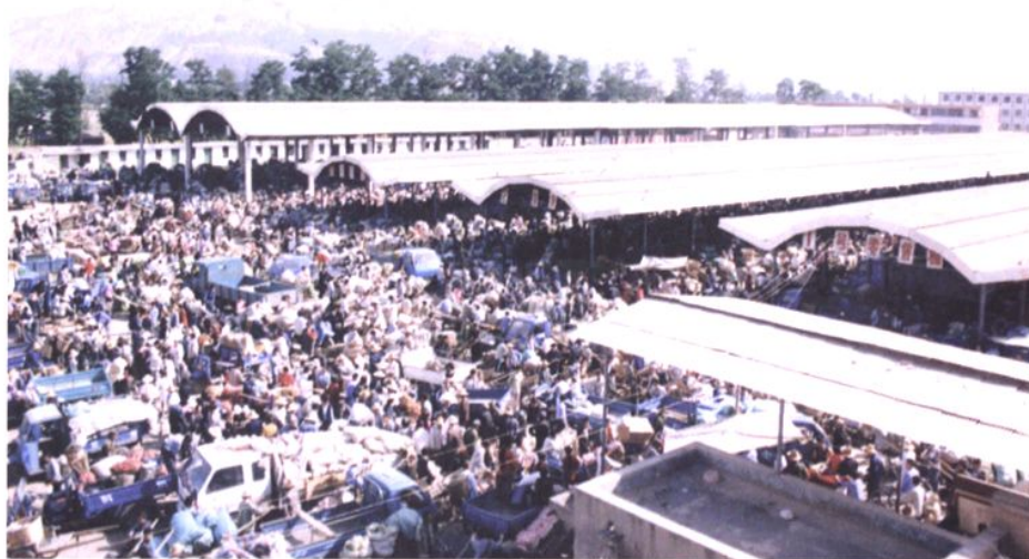
蔬菜批发市场一角