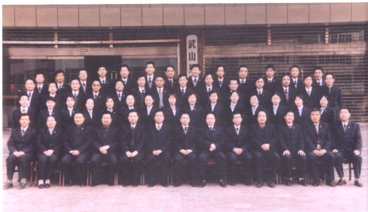
财政局全体职工合影