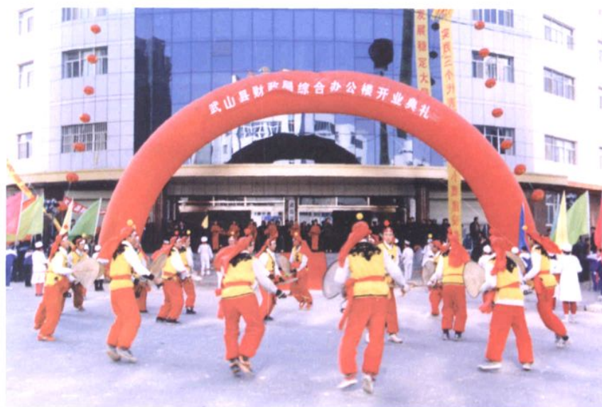
2004年1月，财政局综合 办公楼开业典礼仪式