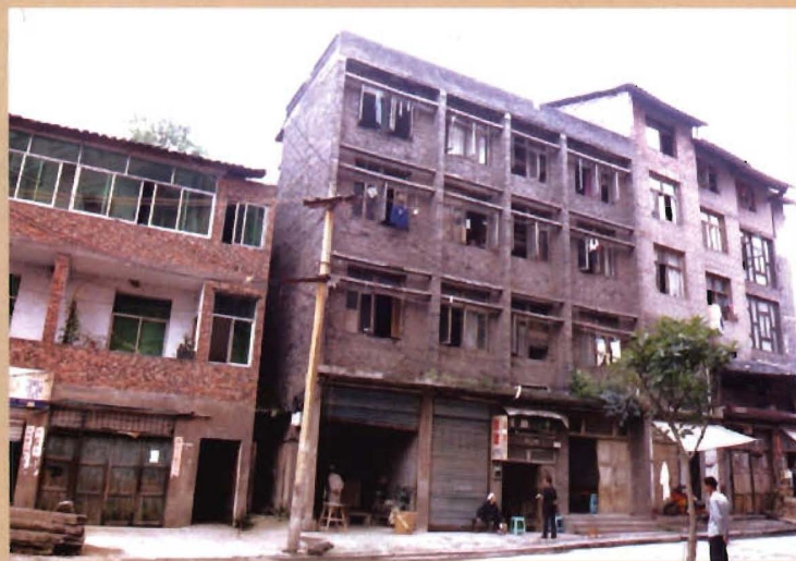
位于红井居委龙井街 的原灯盏乡政府临时驻地 (1992年至1993年)