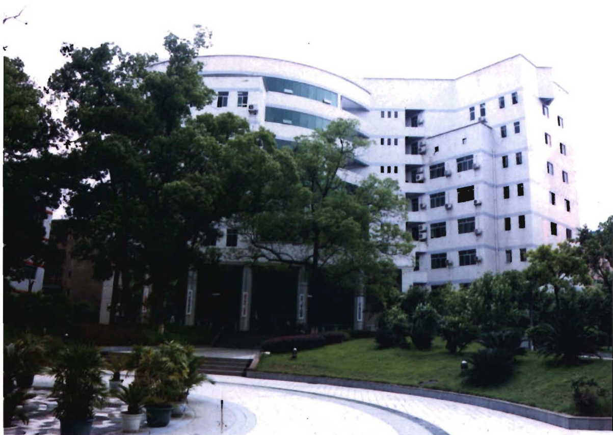
位于横街居委玉带河街1号的县政府驻地