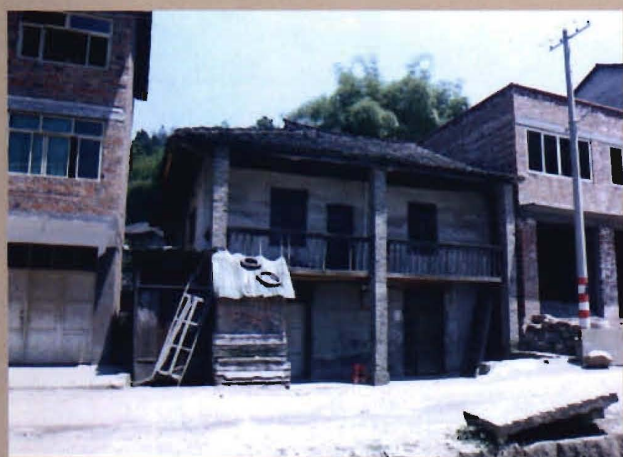
位于黄鹤村双庆场的原双庆乡公所、乡政府旧址 (中间的土墙房, 已毁一部分, 1942年至1980年)