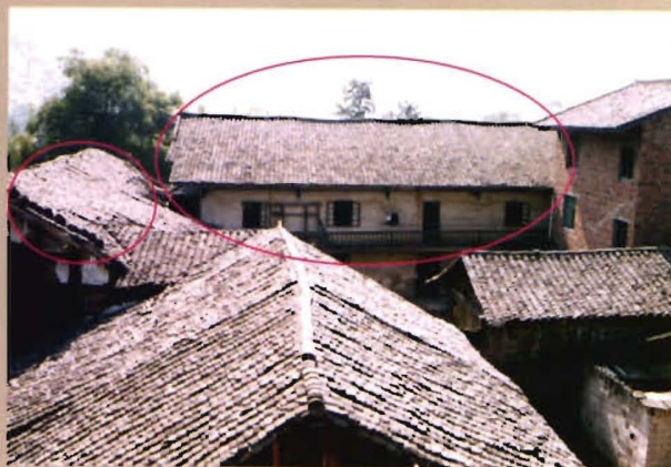
位于灯盏村的原灯盏乡政府旧址（用红线标识的2幢土墙房，1953年至1992年）