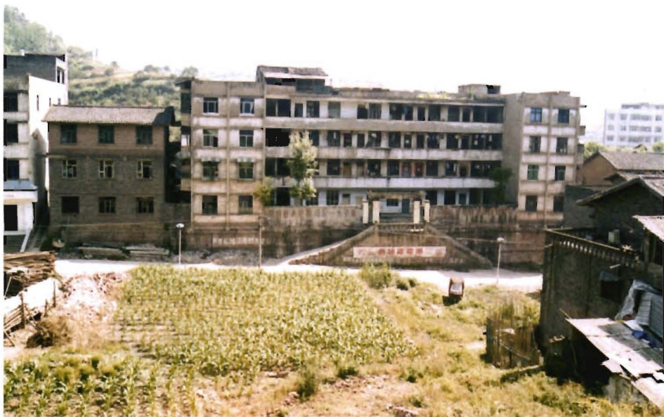
位于红井居委城北西街的原南宾区公所旧址（1984年至1998年，1998年至2001年7月为原灯盏乡政府驻地）