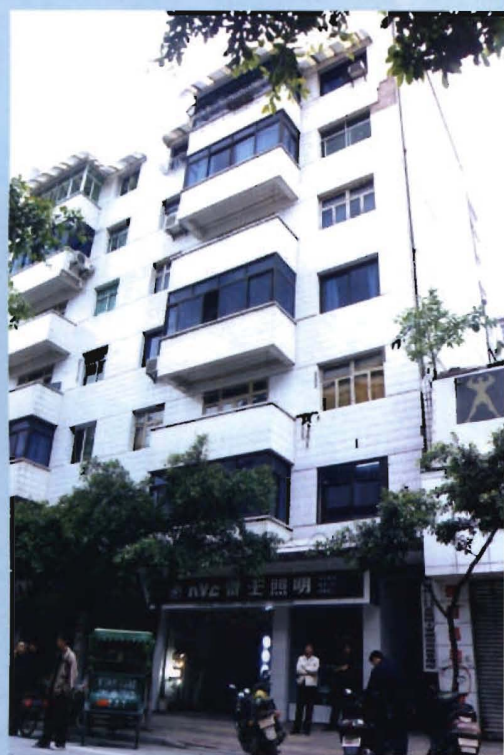
位于正街居委正街55号的原镇政府驻地（1953年至2003年9月13日）