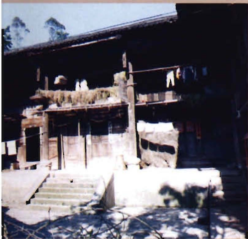
风堡的原凉风乡政府旧址 (1953年至1956年, 风乡并入双庆乡)