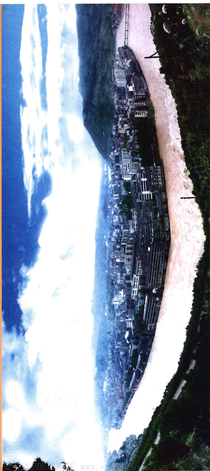
20世纪80年代县城全景