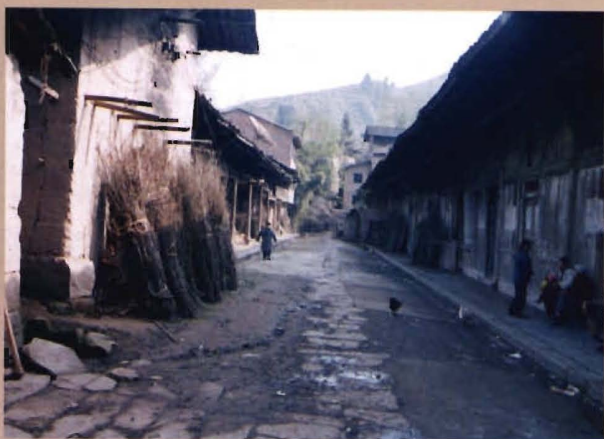
位于沙谷村大河坝场的原沙谷乡公所、乡政府旧址（具体房屋不清，1945年从沙谷嘴迁入至1956年并入灯盏乡止）