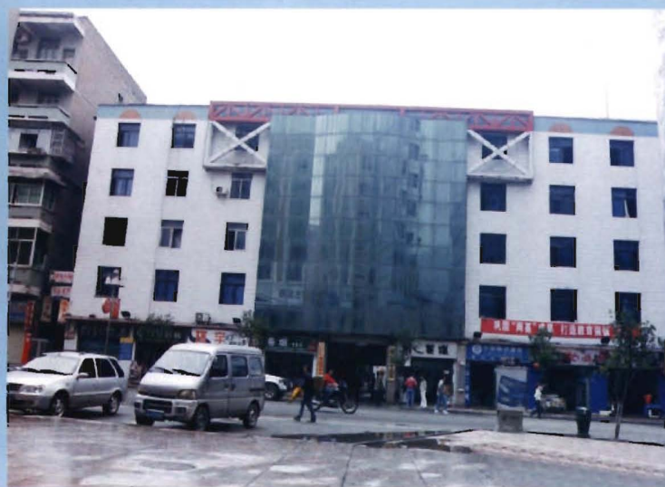
位于老街居委五一街9号的镇政府驻地（原为县财政局办公楼，2003年9月14日启用）