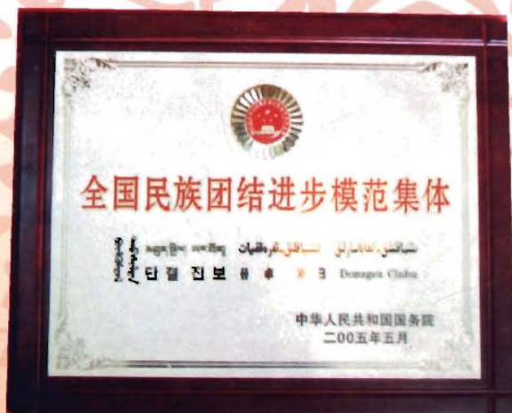
国务院授予沙谷村的奖牌