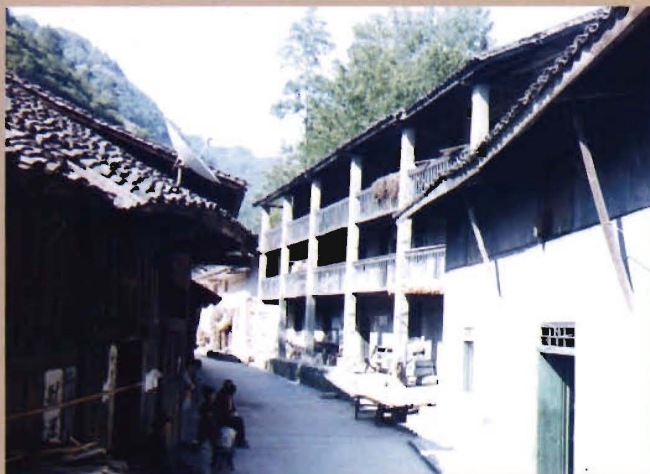
位于河坝村河坝场的原河坝乡政府驻地 (三层栏杆房, 1953年至2001年7月)