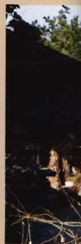
位于梁峰村凉 1956年11月凉