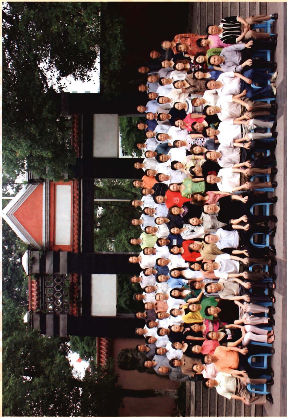
南宾镇党委、人大、政府机关全体职工合影（摄于2006年6月11日，名单见附录一）