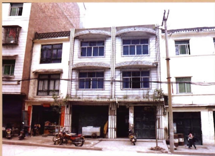
位于红井居委城北路 的原灯盏乡政府旧址 (1993年至1998年)