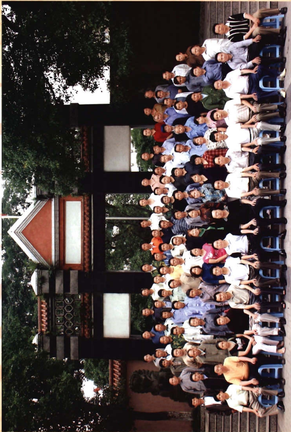
南宾镇村（居）委“三职”干部合影（摄于2006年6月11日，名单见附录二）