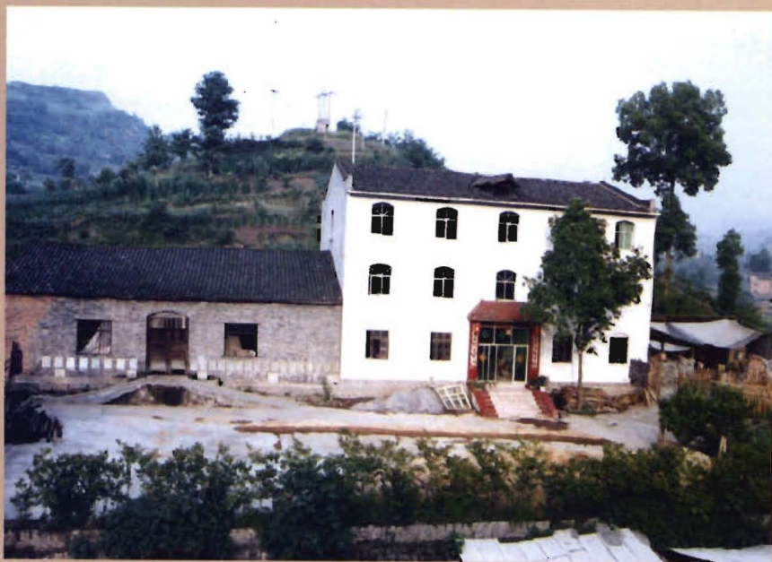
位于华丰居委华丰祠的原华丰乡政府驻地（1953年至2001年7月）