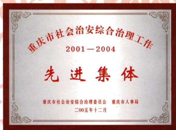
市综治委、人事局授予南宾镇的奖牌