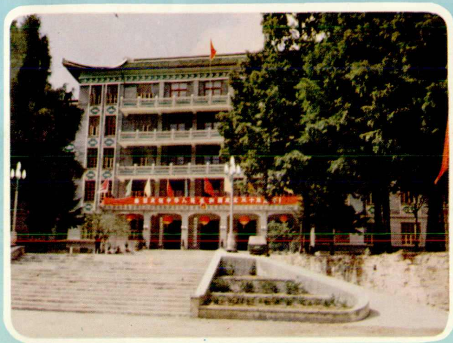
井冈山革命博物馆