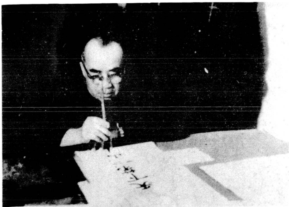
朱德同志一九六二年在井冈山博物馆挥笔题字：“天下第一山”