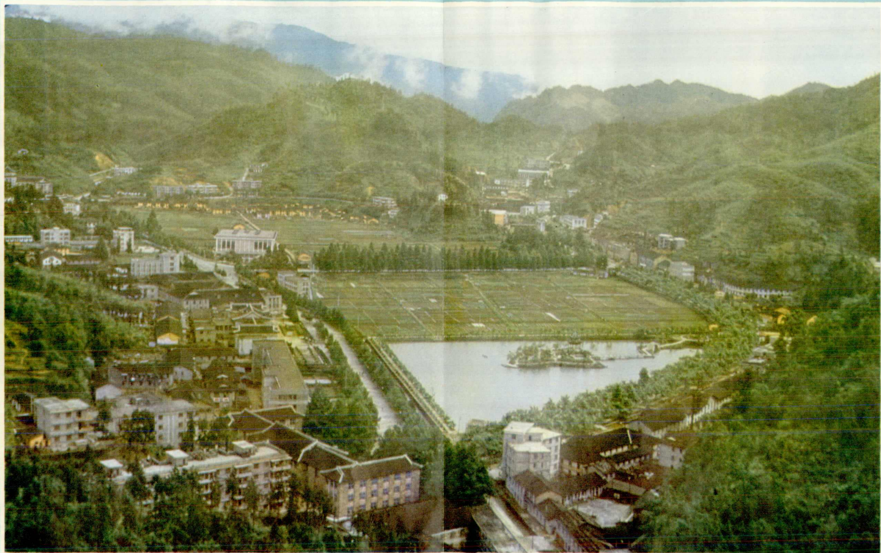
井冈山市区中心—茨坪新貌