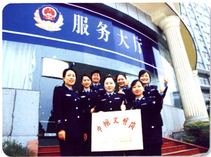
公安局服务大厅2009年 被评为「全国巾帼文明岗」

永川区公安局服务大厅于2004年被评为永川市“巾帼文明岗”，2006年被评为重庆市“巾帼文明岗”，2009年被评为全国“巾帼文明岗”。三年来，服务大厅先后有2名民警在“三基”工程和夏季社会治安综合整治中被重庆市公安局嘉奖，2名民警被永川区委区政府评为政法系统优秀干警，1名民警被区组织部评为党员示范岗，3名民警被区公安局评为综合目标考核先进个人，2名民警被区公安局评为当年优秀党员，1名民警被选为中国共青团重庆市第三次代表大会代表。