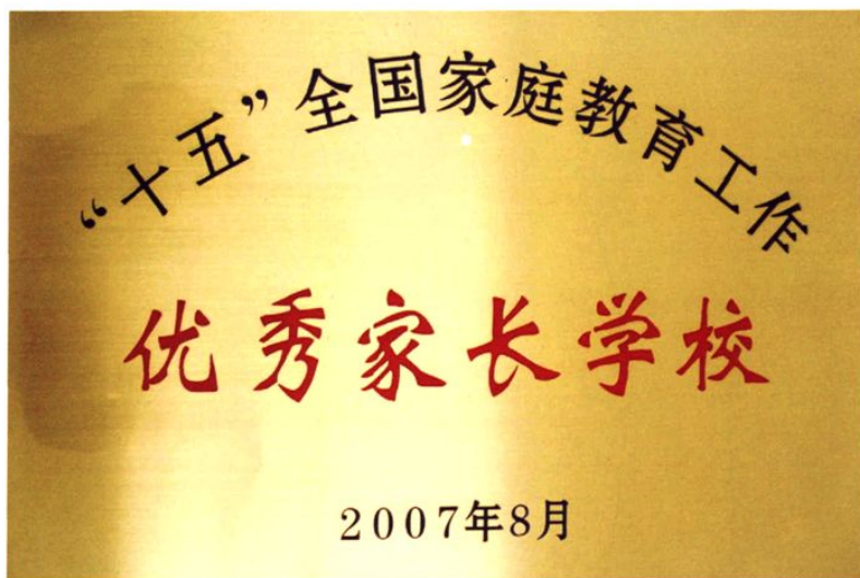
2007年8月红旗小学荣获“十五” 全国家庭教育工作优秀家长学校称号

红旗小学从1986年率先在全市开办家长学校以来，坚持“以学校教育为主体，以社区教育为依托，以家庭教育为基础”的三结合教育模式，取得显著成效。先后被评为“十五”全国家庭教育工作优秀家长学校、全国家长学校先进集体、全国艺术教育特色学校、重庆市家长学校先进学校、重庆市家长学校示范学校、重庆市巾帼文明示范岗等。