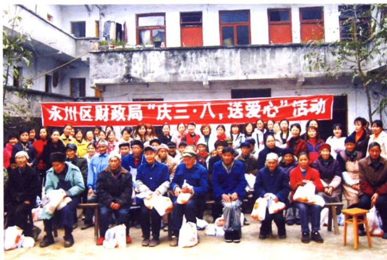
财政局妇委会特殊「三八」节

该局妇委会坚持以“巾帼文明示范岗”创建活动为载体，深入开展了承诺服务、优质服务评比、知识竞赛、业务技能竞赛、爱岗敬业教育及文化体育等各项活动，充分展示了财政局女职工的风采，巩固了“巾帼文明示范岗”创建成果。2008年被全国妇联评为“全国三八红旗集体”。