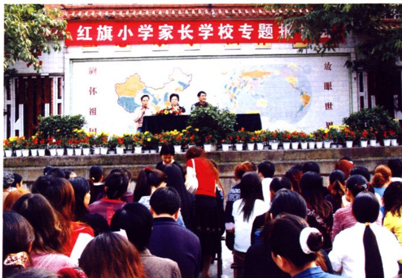
新家庭教育观念进校园