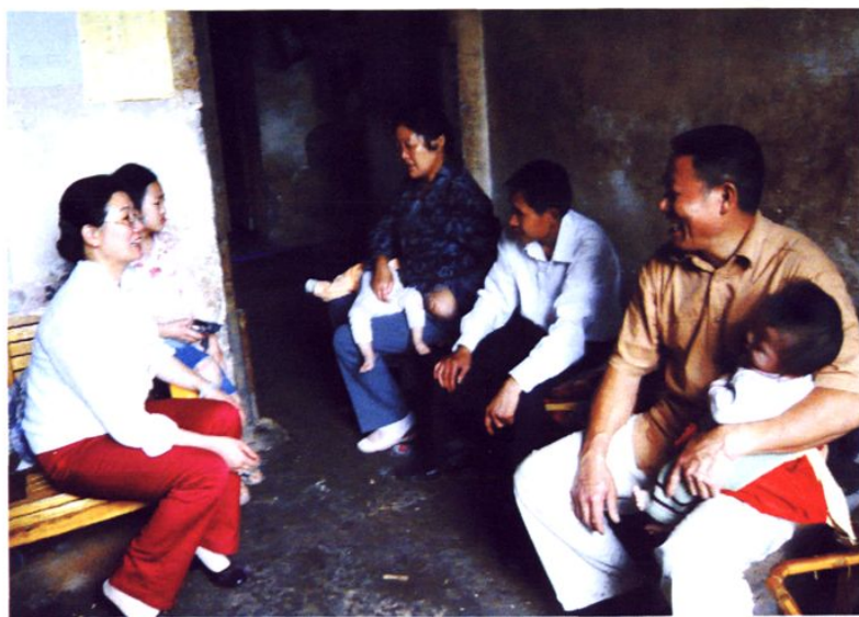
局妇委会主任慰问贫困妇女