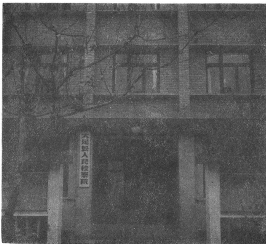
大足县人民检察院地址