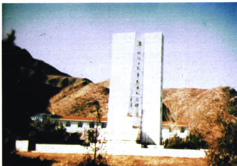
平北抗日战争烈士纪念碑