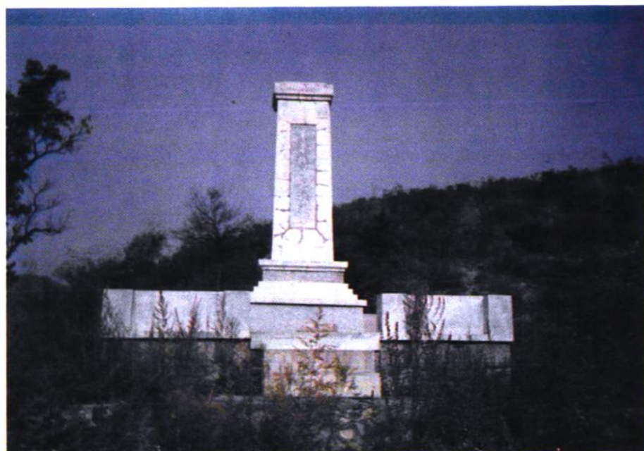
岳坦等百名烈士纪念碑