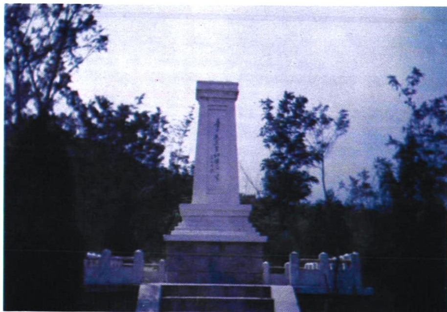
徐志甫、胡英烈士纪念碑