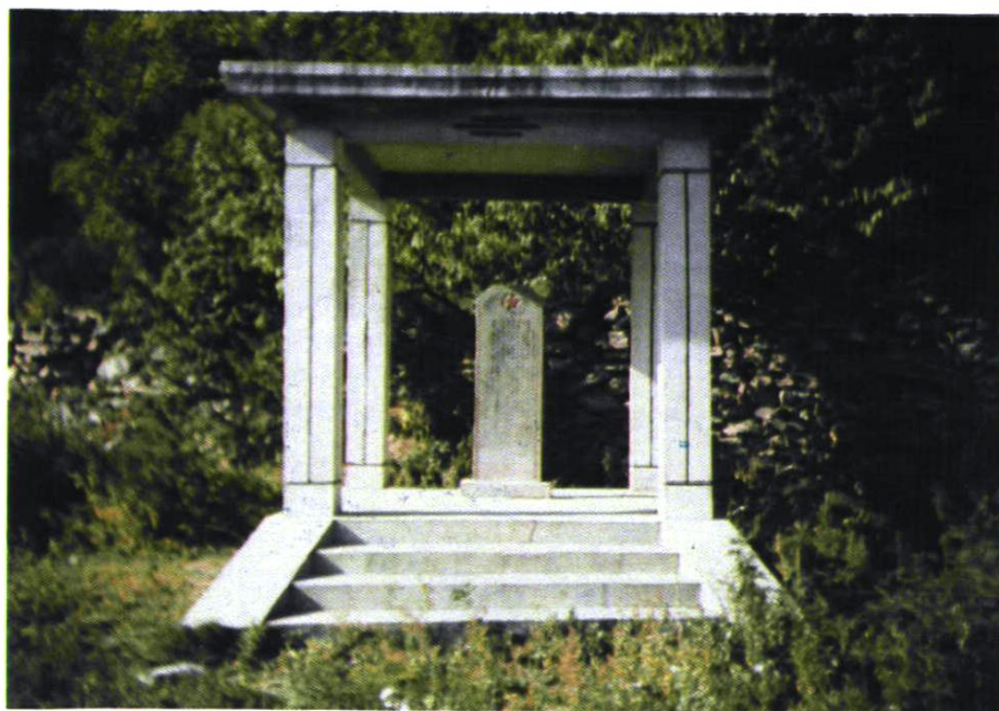
平北军分区司令部纪念碑