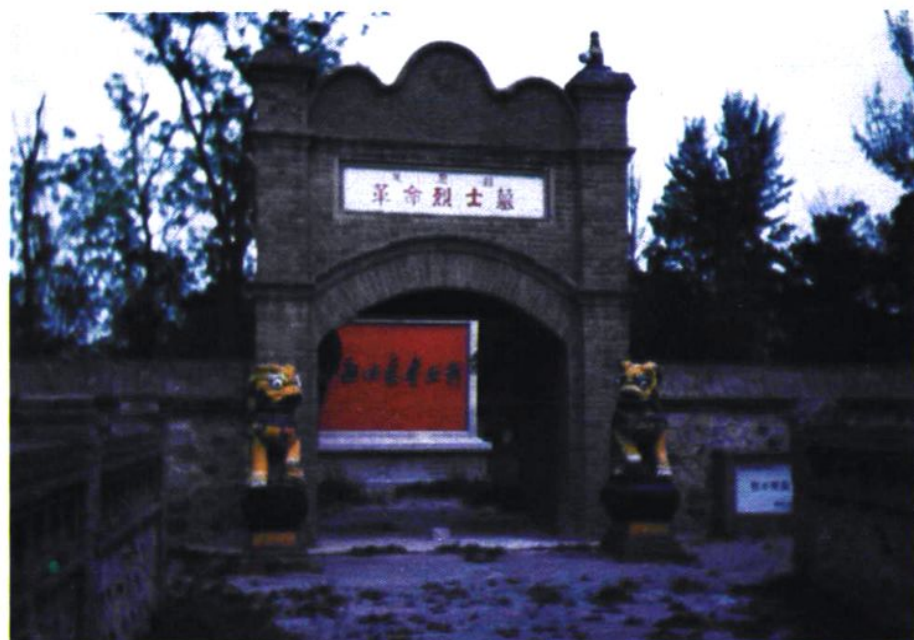
延庆县革命烈士墓