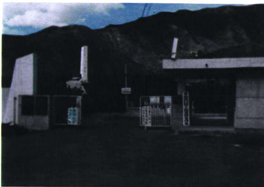
平北抗日战争烈士纪念碑管理处