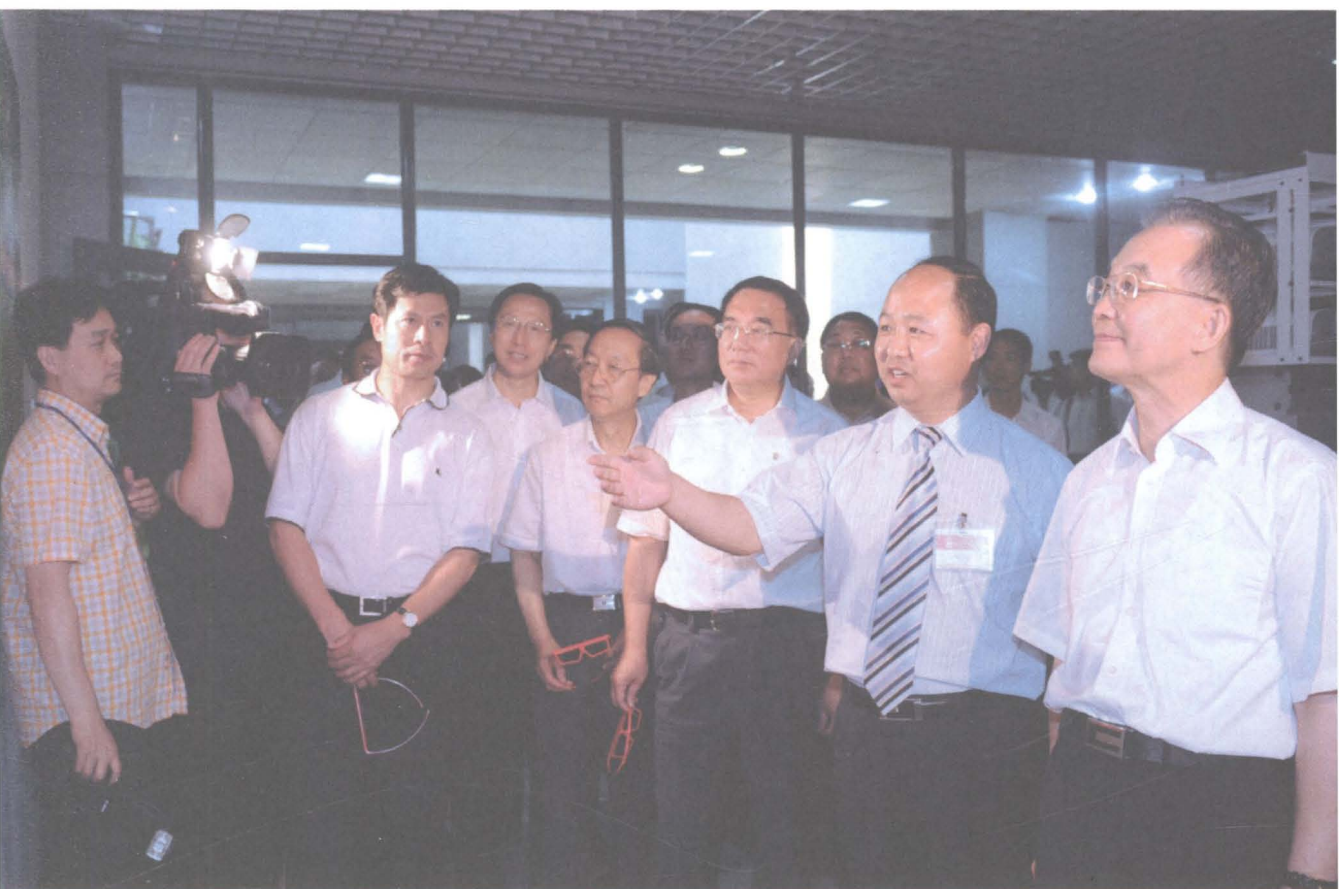
2009年7月26日，中共中央政治局常委、国务院总理温家宝在中共吉林省委书记王珉、吉林省省长韩长赋等省市领导的陪同下，莅临我院视察。董事长、院长郑立国向温家宝总理一行介绍学院发展情况。