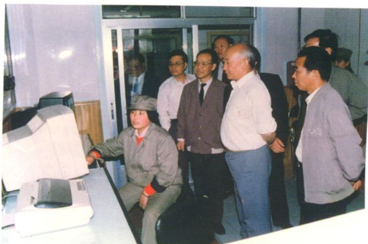
1994年4月7日国家医药管理局局长齐谋甲在氨基酸公司视察