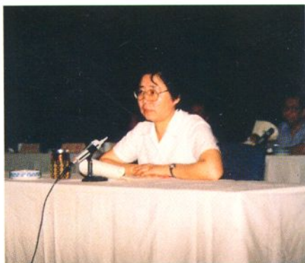
1990年7月12日天津市副市长李慧芬在“治理整顿医药市场动员大会”上作动员报告