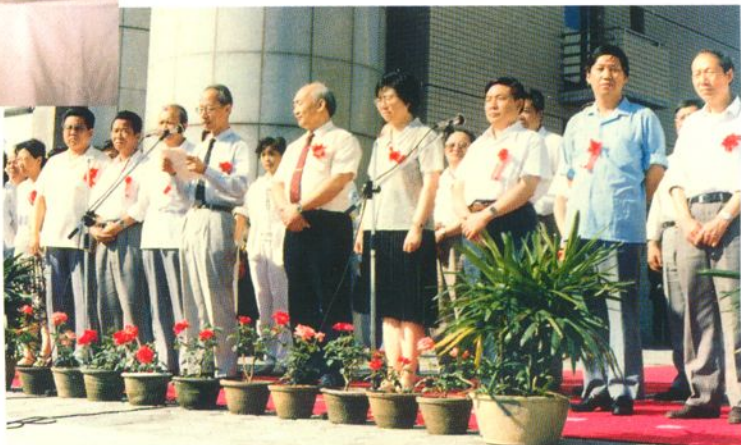
1991年6月12日首届全国制药机械新产品博览会在天津召开。天津市副市长李慧芬、国家医药管理局局长齐谋甲出席了开幕仪式