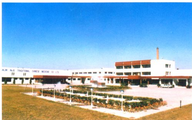
天津市六中药制药有限公司1994年迁址重建，占地12万平方米，建筑面积2100平方米。图为六中药制药有限公司外景