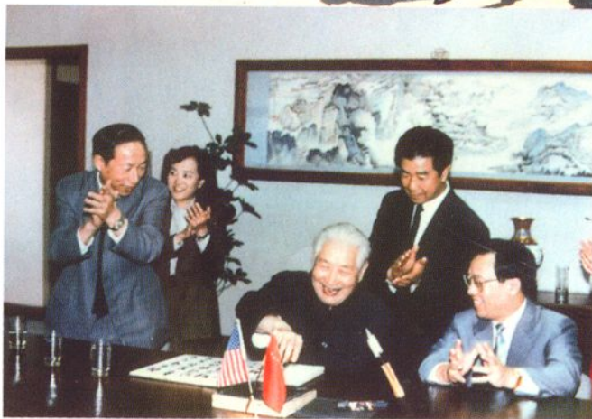
1990年国家医药管理局局长胡昭衡到中美天津史克制药有限公司指导工作