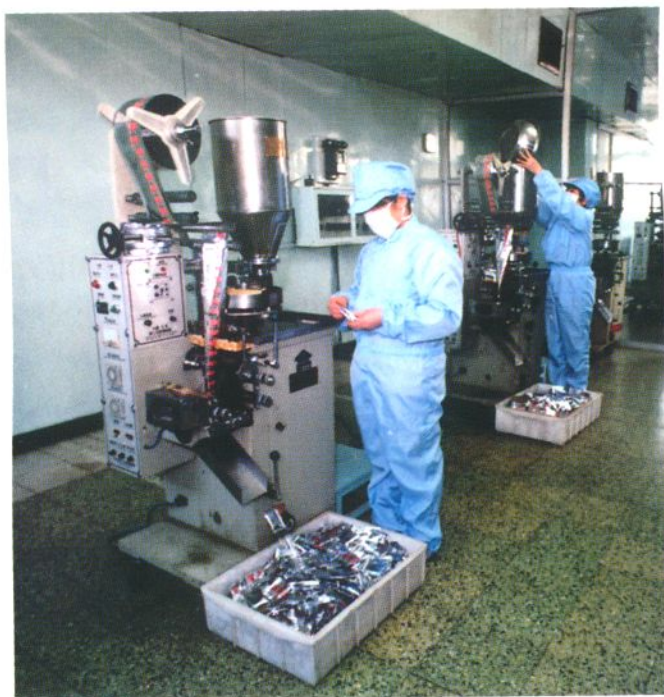
天津市乐仁堂制药厂1988年从天津市轻工包装厂购进丸剂灌装机,使年产量达到477.4万袋