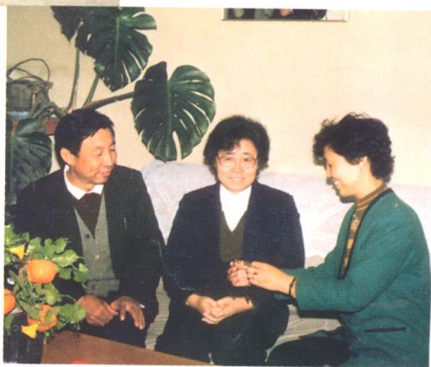
1989年5月天津市副市长李慧芬到天津市眼镜公司视察工作