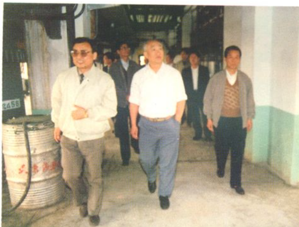
1994年4月7日国家医药管理局局长齐谋甲在天津药业公司视察