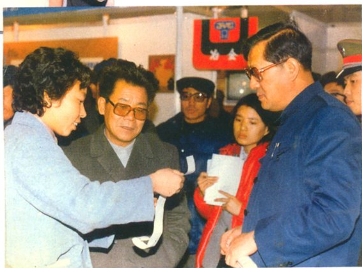
1985年12月19日天津市市委书记倪志福市长李瑞环观看药材公司北菜园仓库应用微机管理的展厅