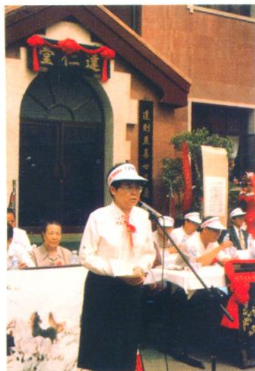
1994年6月6日天津市副市长李慧芬参加达仁堂制药厂建厂80周年厂庆活动