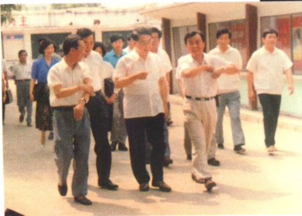
1994年6月27日天津市市委书记高德占到天津药业公司调研