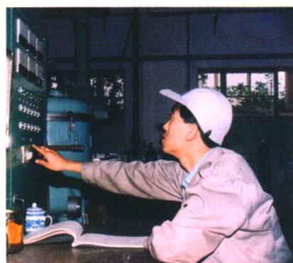
天津骨科器械、器材以品种全、质量优赢得用户，国内市场占有份额超过三分之一，成为医械行业的一大支柱。图为骨科器械二厂真空铸造炉生产人工关节现场