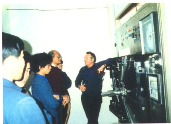
1985年澳大利亚援助天津市医用高分子制品厂一次性使用塑料输血袋项目,处于国内领先水平。图为投产前澳方专家为该厂调试设备