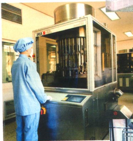
天津市力生制药厂 1984 年从意大利 引进胶囊灌装机，年生产能力达到 2 亿粒