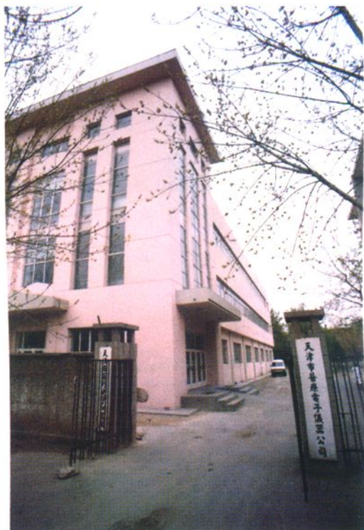
天津市医疗电子仪器有限公司1992年投资452万元对厂房进行改造扩建，新楼建筑面积2400平方米，使生产B超等产品能力大大提高