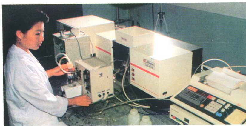
1984年,天津市达仁堂制药厂建成产品检测中心,引进上百万元的先进检测设备,检测水平居全国同行业前列