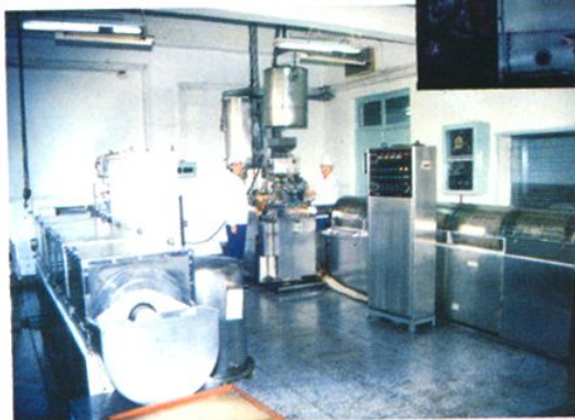
天津市中央制药二厂 1987 年从意 大利引进 MARK — IV 软胶丸机 组一套