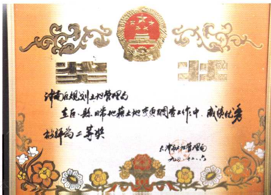
天津市土地管理局授予奖状