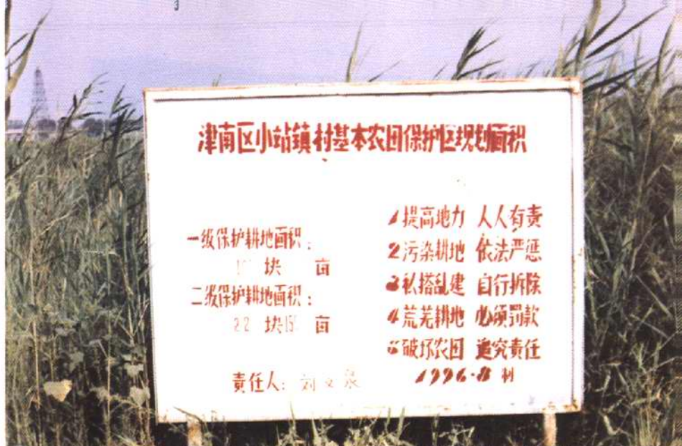
基本农田保护区标志牌