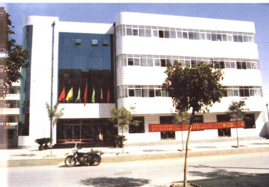
津南区土地规划管理局办公楼