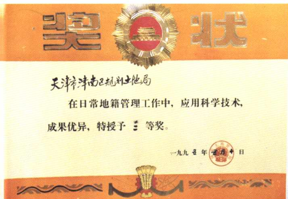
国家土地局授予奖状