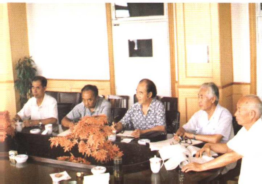
市、区有关部门领导对津南区土地管理志进行研究讨论