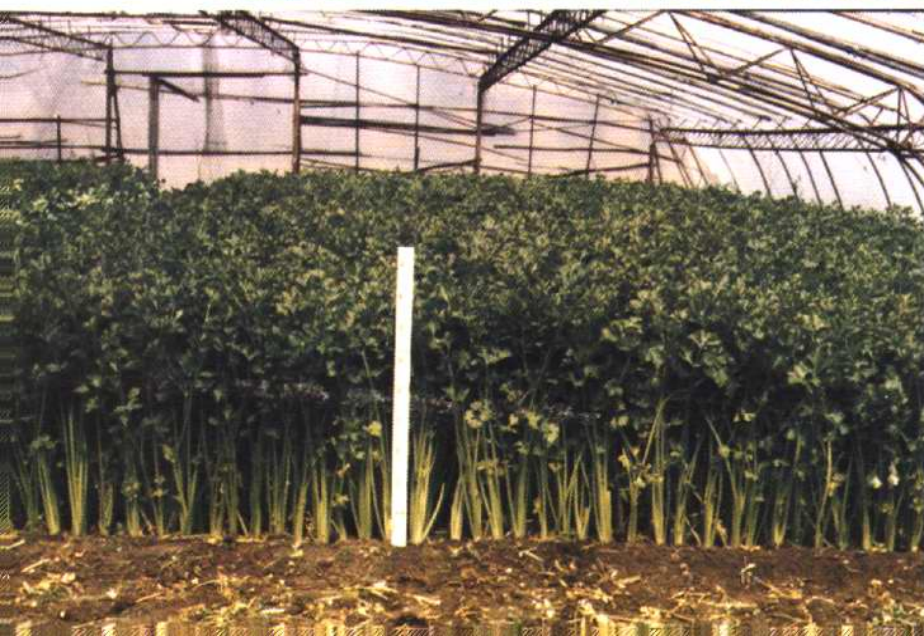
大棚蔬菜茂盛生长