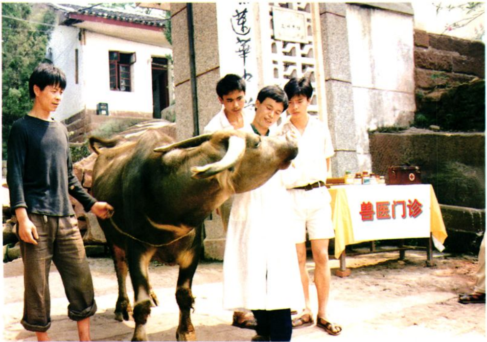
莲华中学学生为农民治牛病