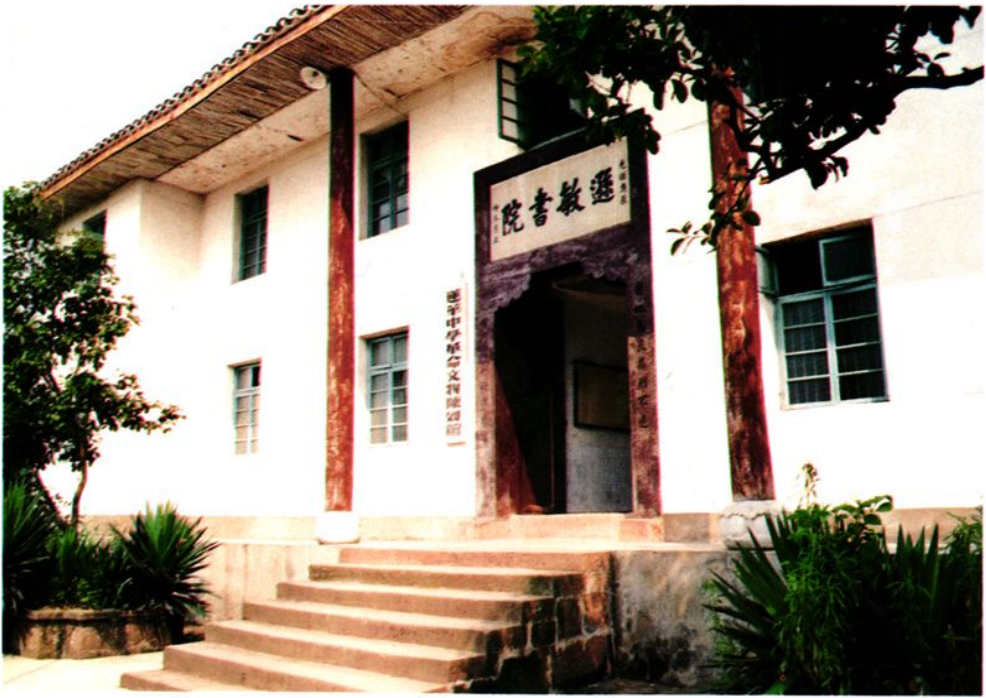
蓮華中學革命文物陳列館