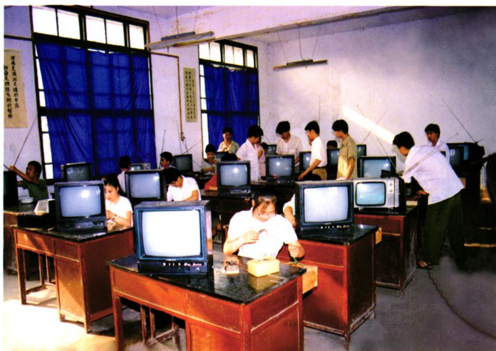
水土职中学生装修电视机