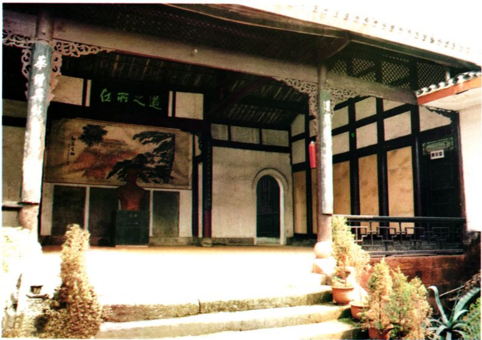
蓮華中學王朴烈士紀念館