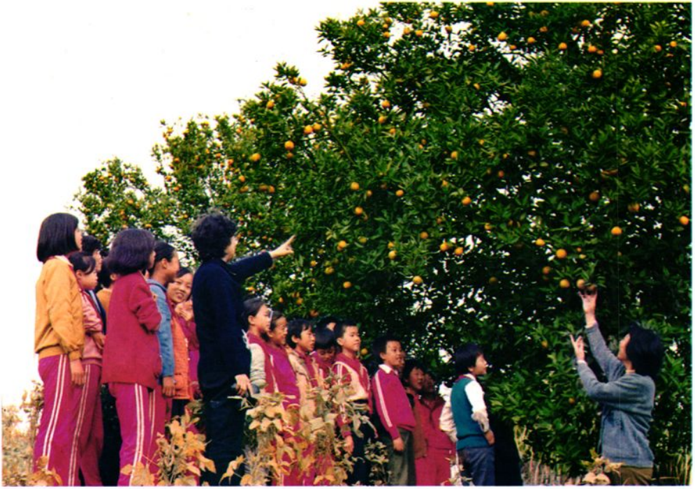
洛碛小学学生参观果园，学习果树栽培技术