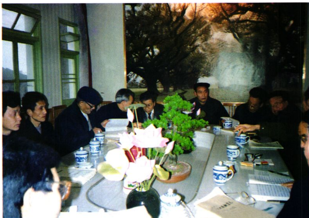
《江北县教育志》评审会