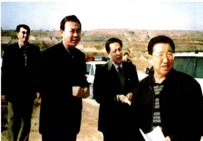
2001年1月，中共陕西省委副书记、陕西省常务副省长贾治邦（右一），榆阳区委书记杨树业（右三）、区长刘俊明（右二）等到青云乡调研财政惠农重点项目建设情况