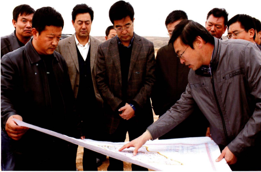
2014年，中共榆阳区委书记苗丰（中）调研经济社会发展与财源建设工作