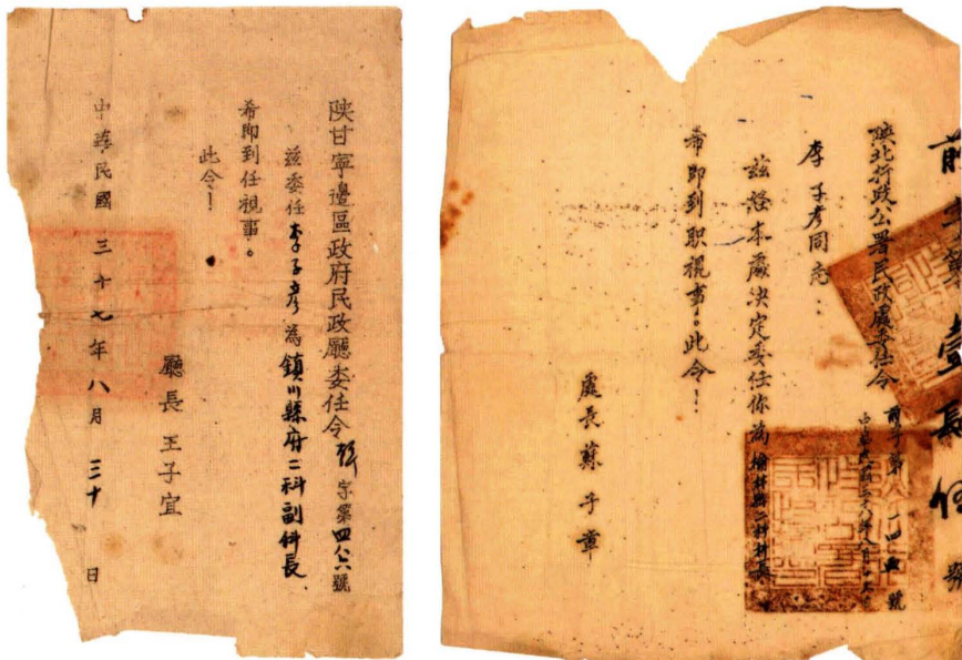
(左图) 1948年8月，陕甘宁边区政府民政厅委任镇川县府财政科科长令 (右图) 1949年8月，陕北行政公署民政处委任榆林县财政科科长令