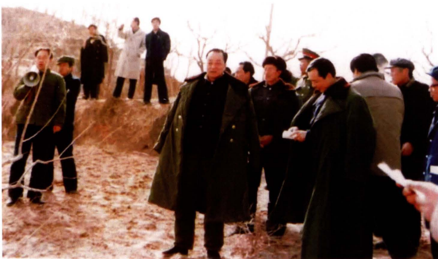
1995年1月，中共榆林市委书记李锦升（中）深入南部山区调研市乡两级群体财源建设情况