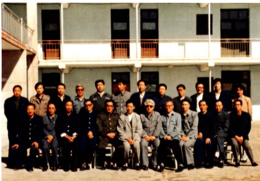
1993年，榆林地、县财政局局长参观中华会计函授学校榆林市函授站，在市财政局北楼前合影