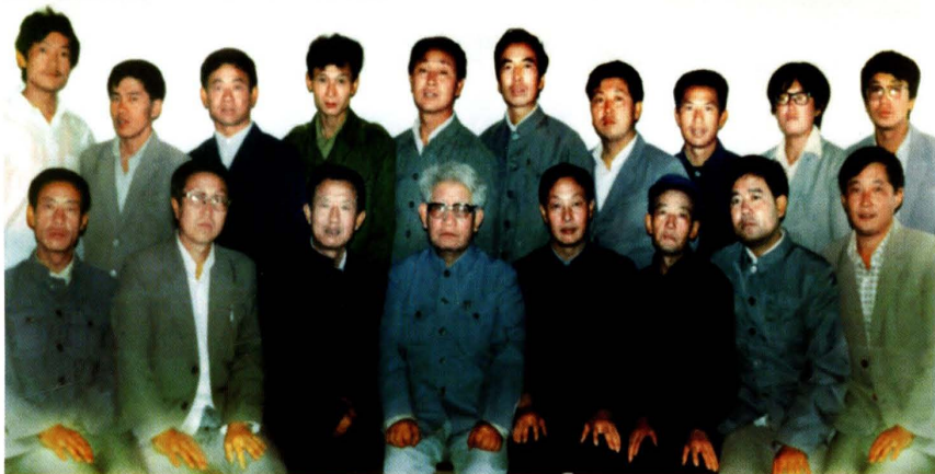
1991年9月，中共榆林市財政局支部委員會成立大會全體黨員合影