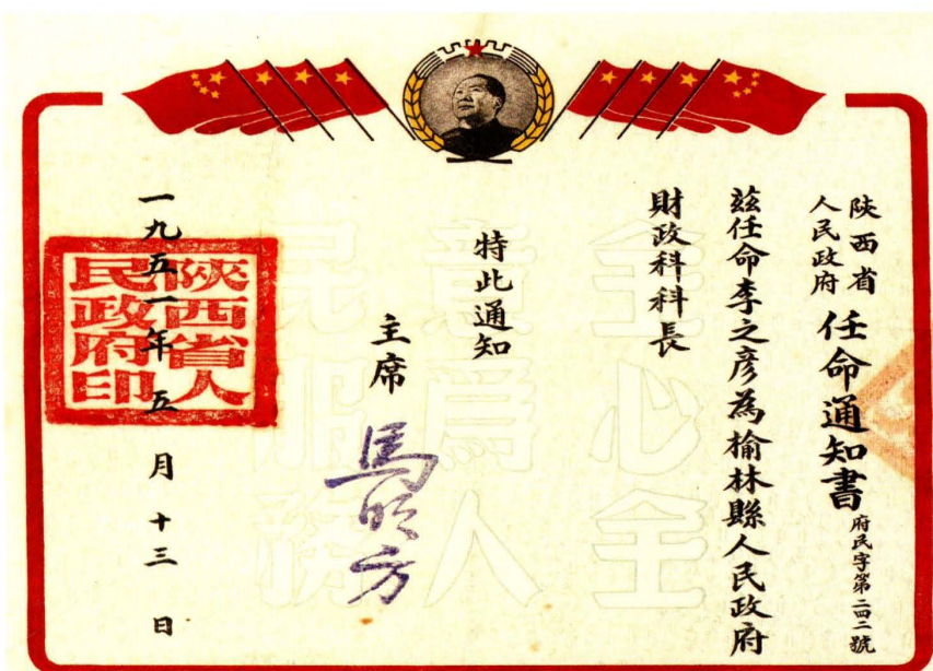
1951年5月，陕西省人民政府任命榆林县人民政府财政科科长通知书