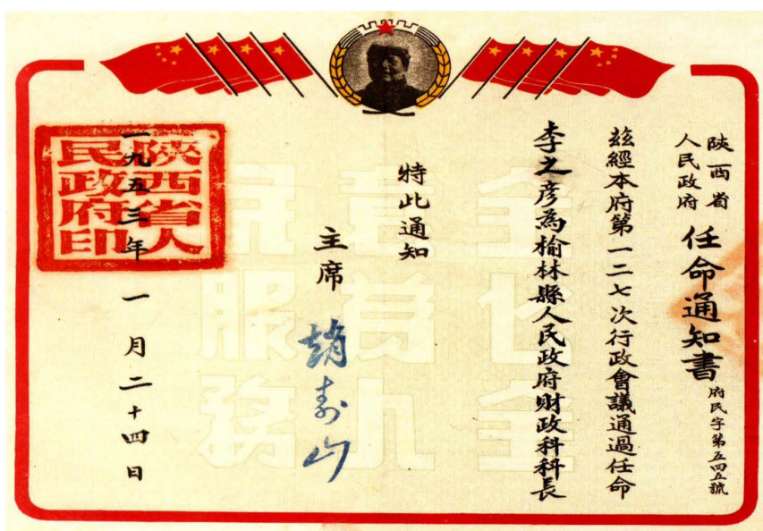
1953年1月，陕西省人民政府任命榆林县人民政府财政科科长通知书