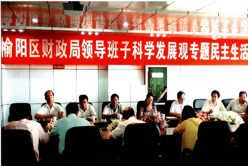
2003年9月，榆阳区财政局召开领导班子科学发展观专题民主生活会