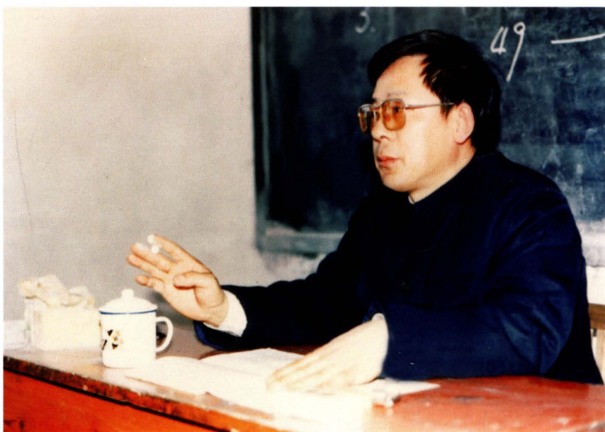
1994年10月，榆林市市长杨颖德在市财政局检查指导分税制工作实施情况