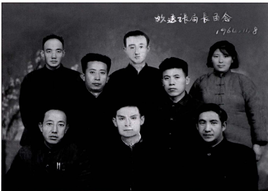
1964年11月，榆林县财政局工作人员合影