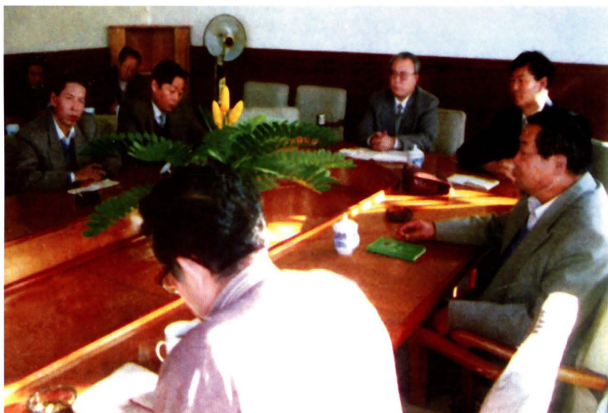
1996年，榆林市委书记刘汉兴（中）、市长贾亮晓（右二）等党政领导研究出台《关于进一步加强群体财源建设的决定》，提出南部山区发展大扁杏10万亩，北部草滩区发展舍饲养羊100万只