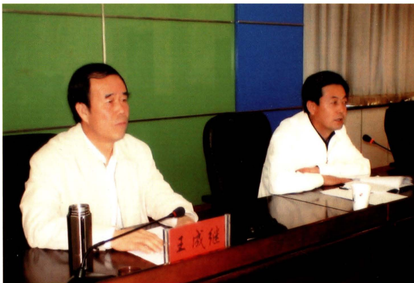
2010年，中共榆阳区委书记王成继（左）出席指导财政系统工作会议