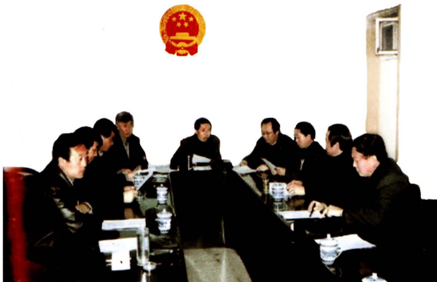
2003年，榆阳区人民政府研究出台《榆阳区财政专项资金管理办法》