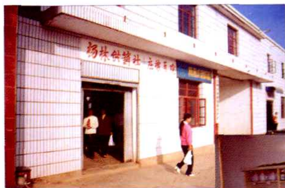
基层供销社庄稼医院之一