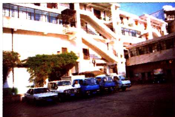
县商贸公司运输车辆