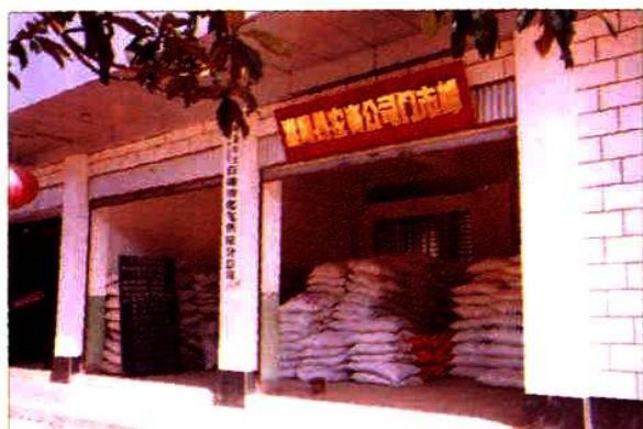
县商贸公司农资门市部