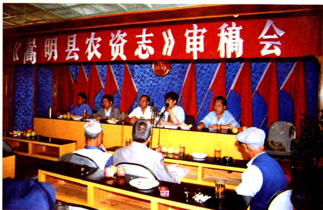
《嵩明县农资志》审稿会议会场一角