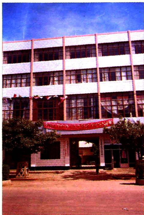
嵩明县供销社商贸公司(前身为 农资公司)经营办公大楼一角