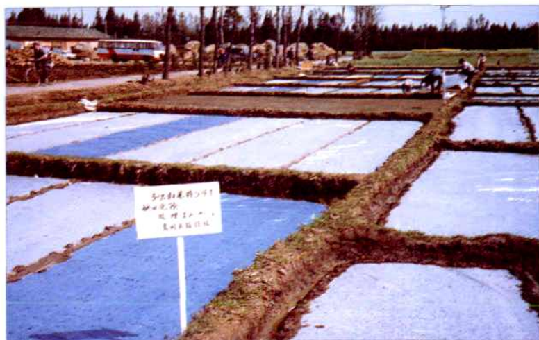
薄膜育秧及化学除草示范现场