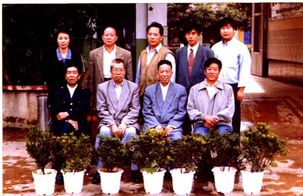
《嵩明县农资志》编纂领导小组及编写人员合影