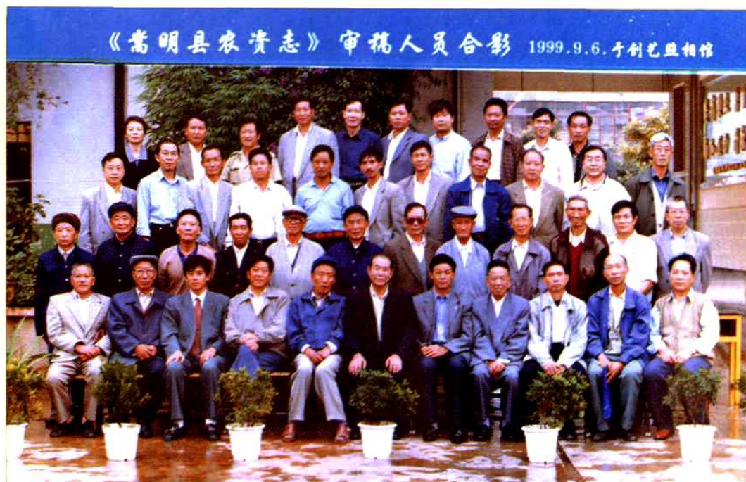
《嵩明县农资志》审稿会议出席人员合影