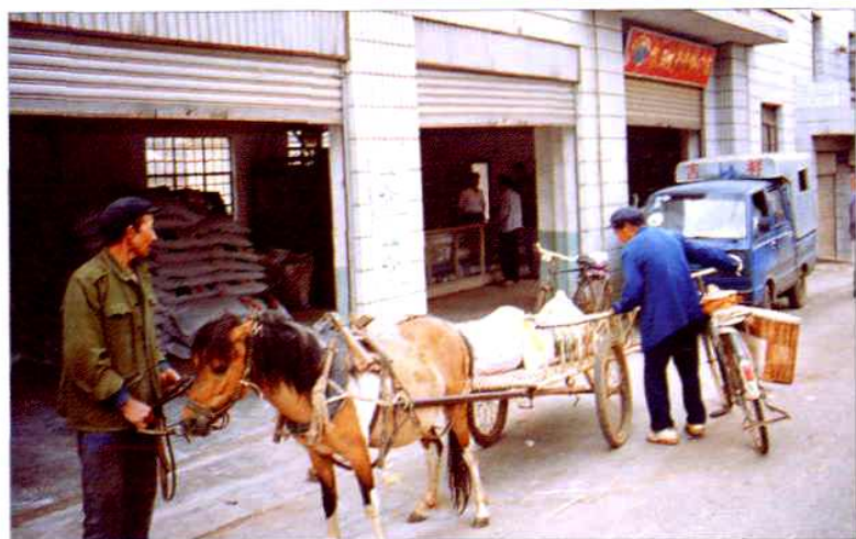
农膜、化肥配供现场