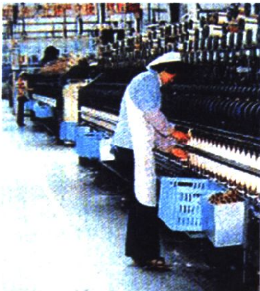
■ 工农联营企业之一的大治河毛纺厂生产车间

1985年，上海郊区农村经济内部的一、二、三业的结构比重为20.9：60.2：18.9。