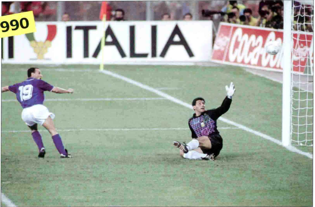
斯基拉奇 (Salvatore Schillaci) 在1990年世界杯半决赛率先破门，让阿根廷门将戈耶切亚望球兴叹。