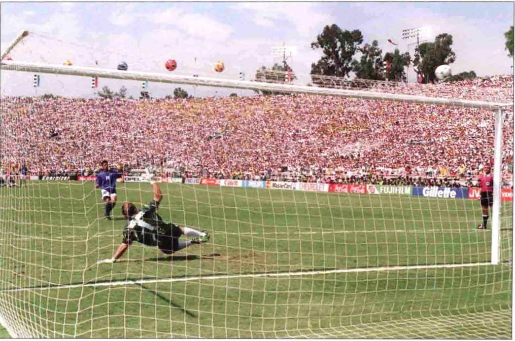
巴乔在关键的点球决战时刻将球踢飞，拱手将冠军送给桑巴军团，让意大利队第4次夺取世界杯的美梦灰飞烟灭。