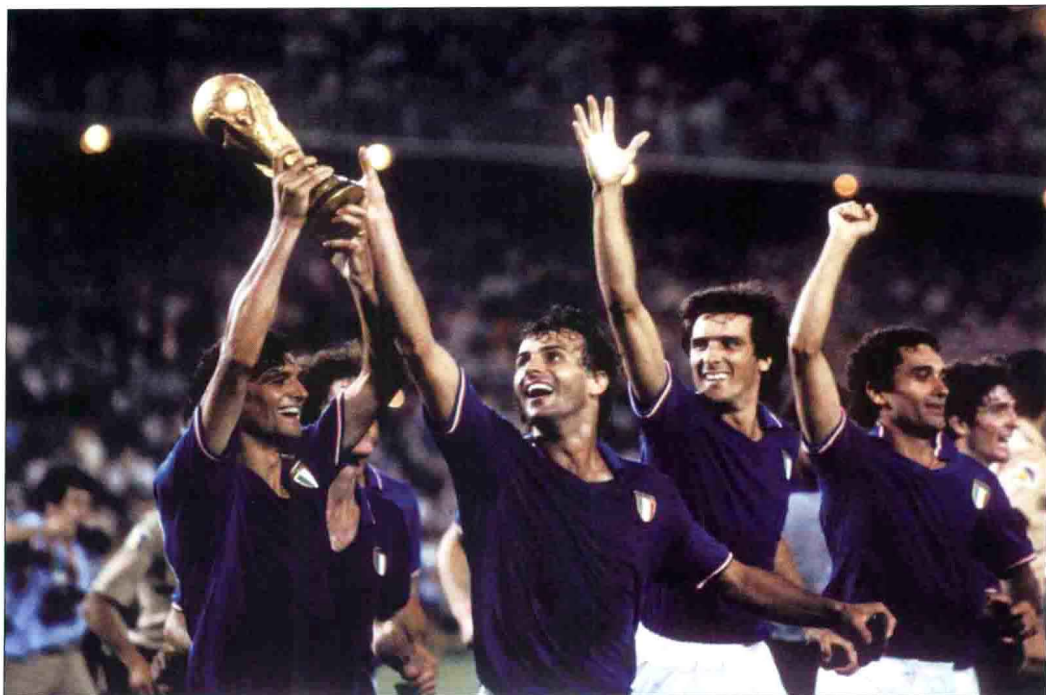
阿尔托贝利、卡布里尼、西雷阿和詹蒂莱庆祝意大利队夺得第12届世界杯冠军，这是“蓝衣军团”第3次摘得此项赛事桂冠。