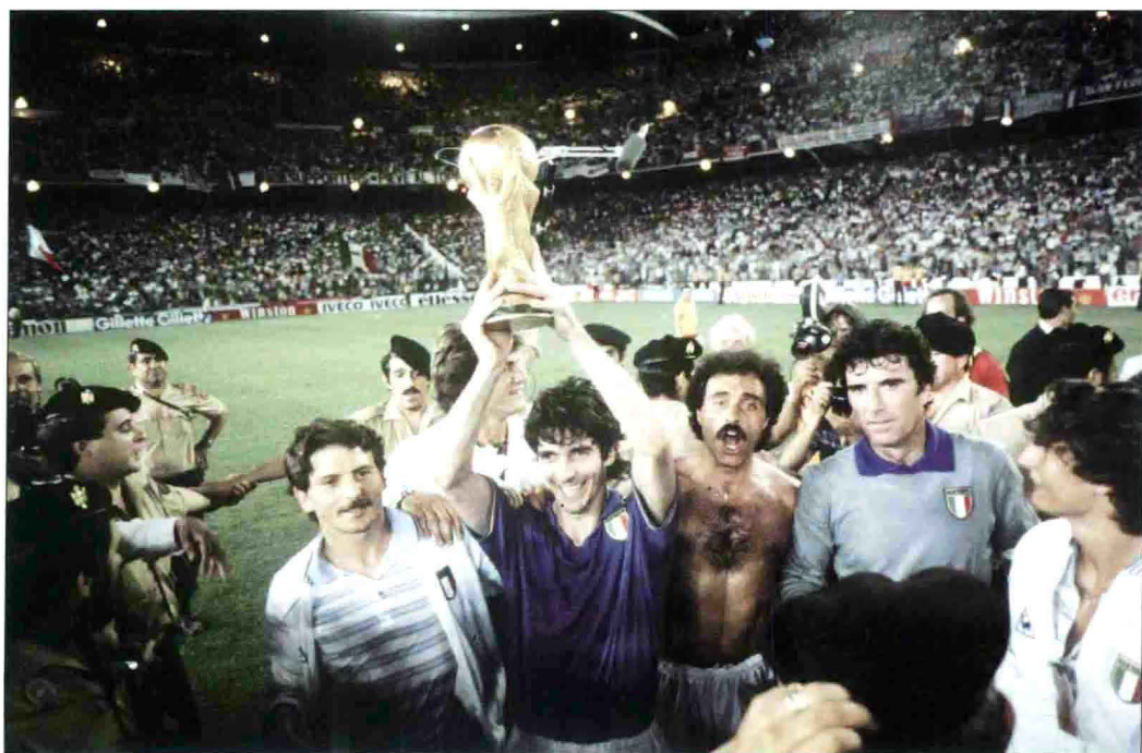
意大利“金童”保罗·罗西成为本届世界杯的最大赢家，他一举将3座奖杯揽入怀中（世界杯、金球奖和金靴奖）。