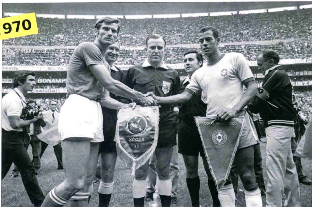
1970年世界杯决赛，意大利队长法切蒂与巴西队长卡洛斯·阿尔贝托均有机会永久保留雷米特杯。