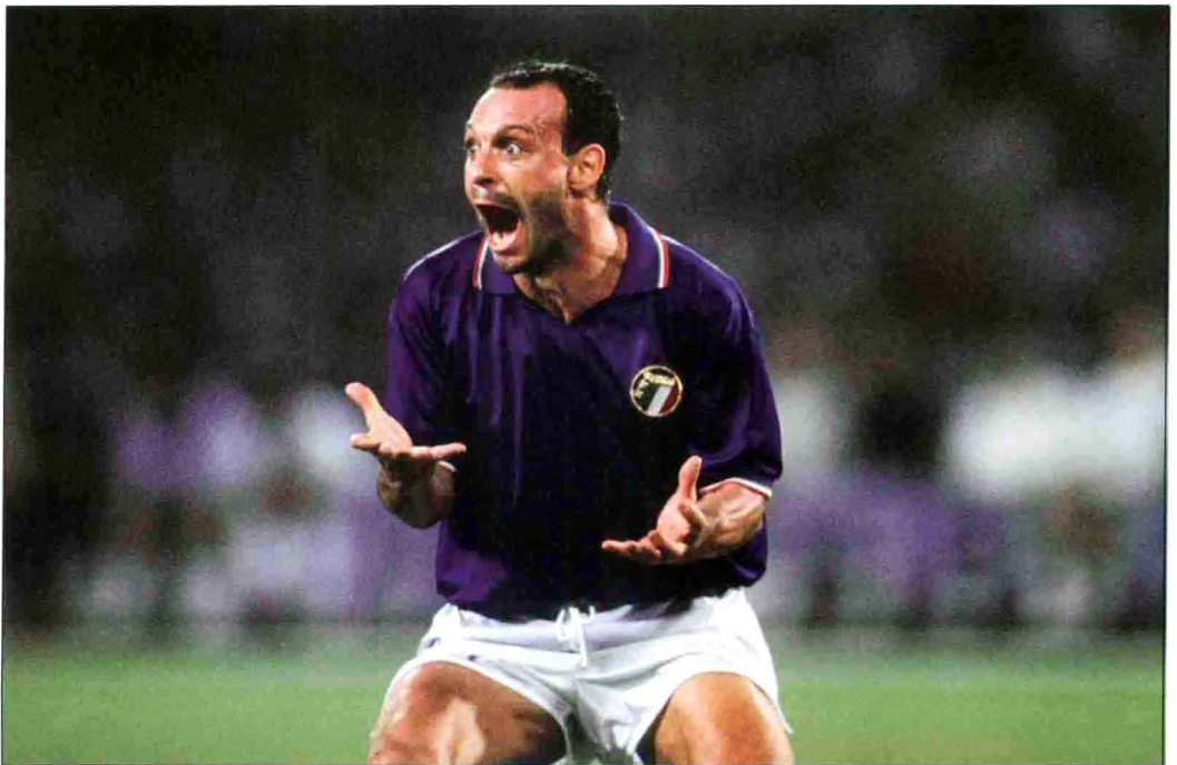
迅速升起的新星斯基拉奇虽然未能帮助东道主意大利队夺取世界杯，却意外地将两项个人奖项（金球奖、金靴奖）收入囊中。