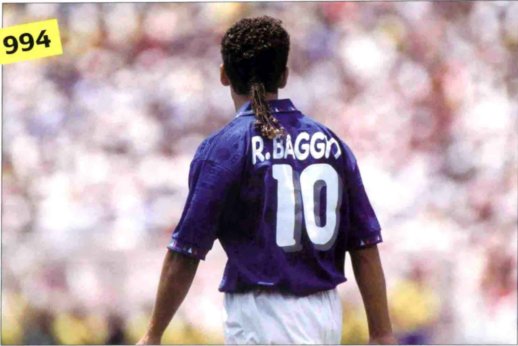
在1994年美国世界杯中，“神奇的马尾辫”罗伯特·巴乔凭借着个人的出色表现带领疲惫不堪的意大利队艰难地闯进决赛。