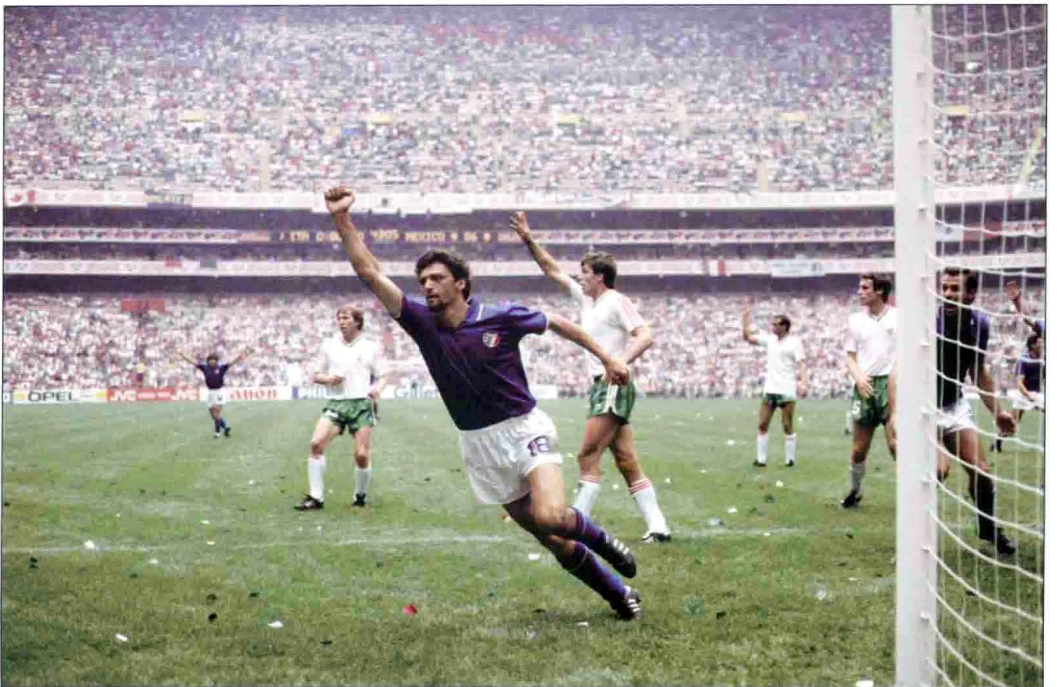
意大利前锋阿尔托贝利在揭幕战中上半场尾声声先拔头筹，可惜意大利队晚节不保，在比赛结束前5分钟被保加利亚队追平比分。