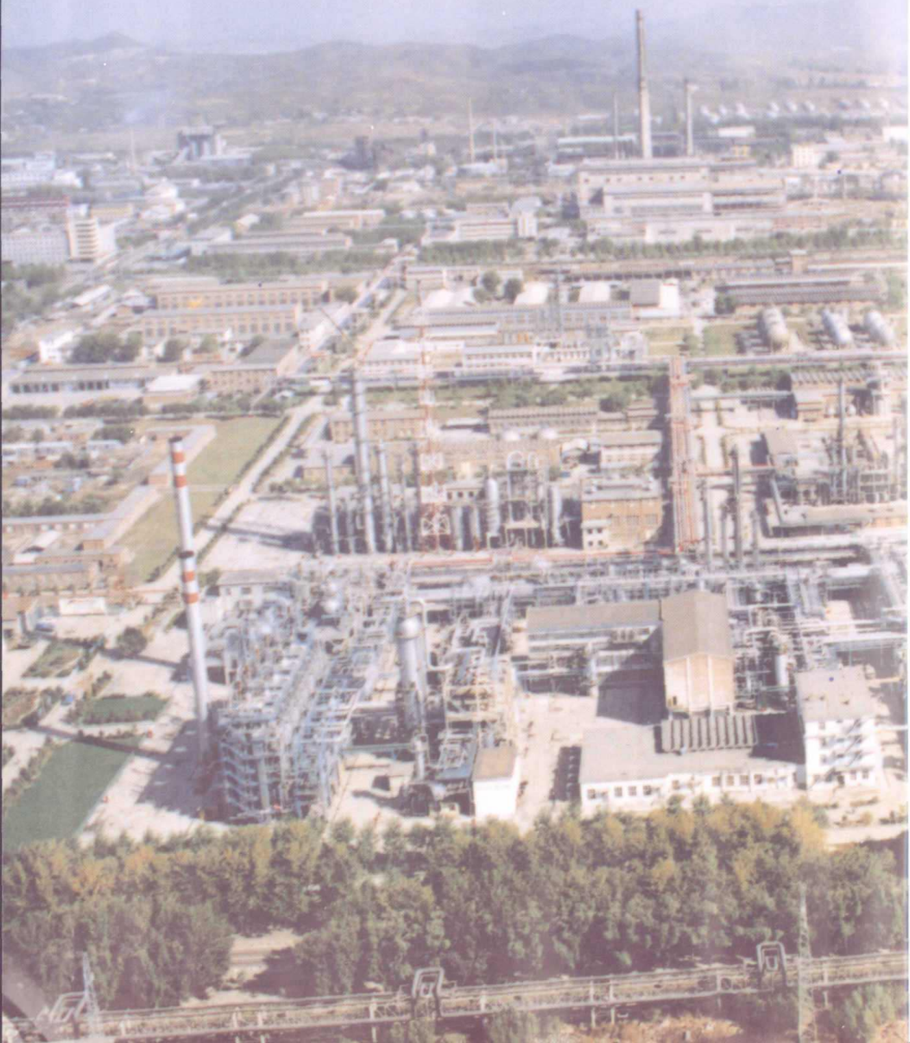
吉林化学工业公司厂区鸟瞰图一角