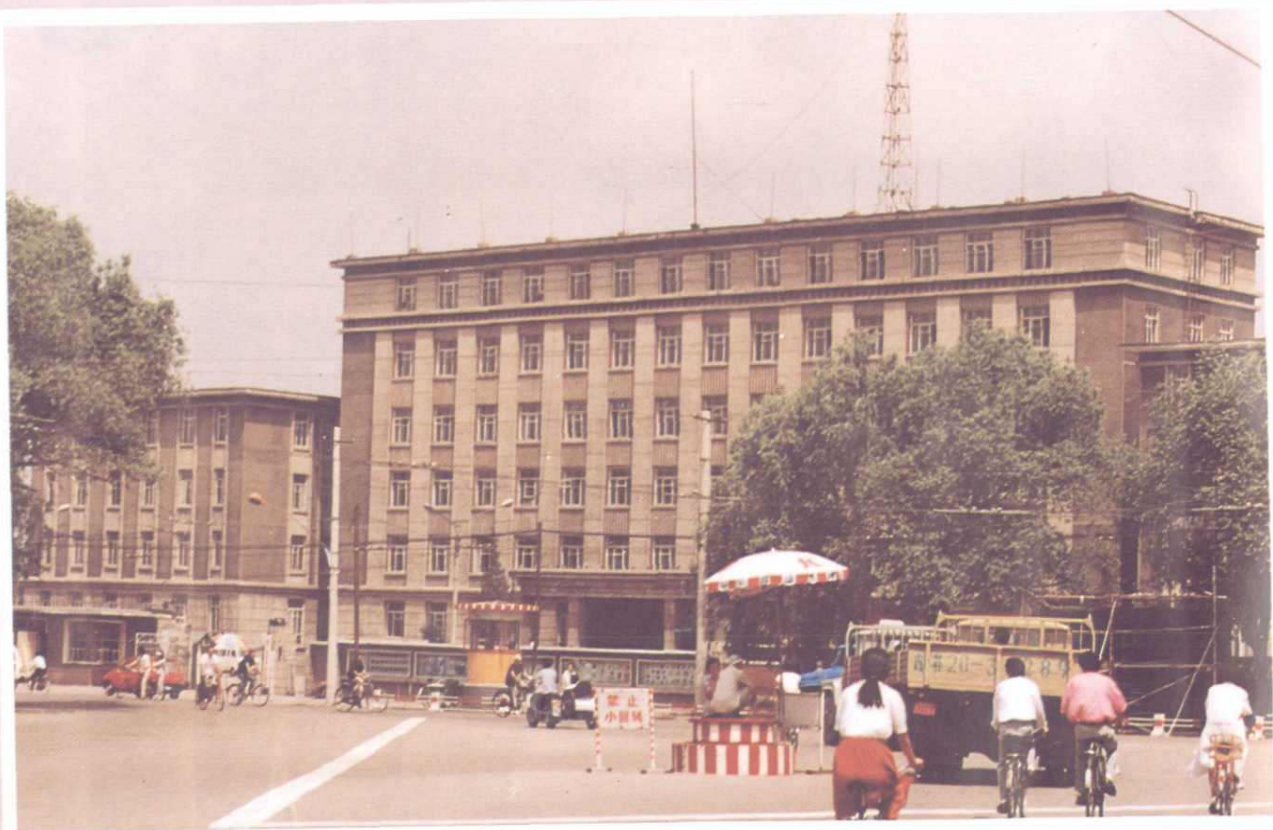
吉林化学工业公司办公楼