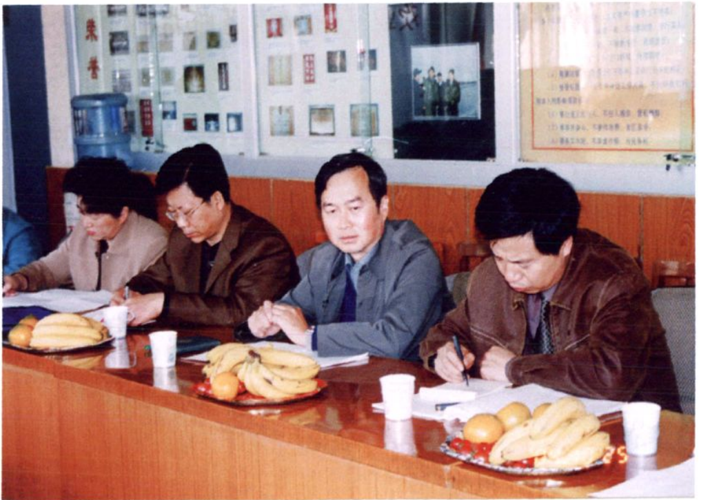
自治区审计厅党组书记、厅长章建忠(右二)在银川市审计局检查指导工作