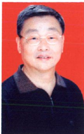
银川市审计局原党组书记、局长 仇华培