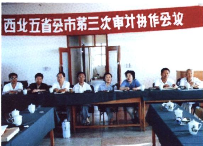
1988年1月，银川市市长金晓昀（右三）在西北五省会城市审计协作会议上讲话