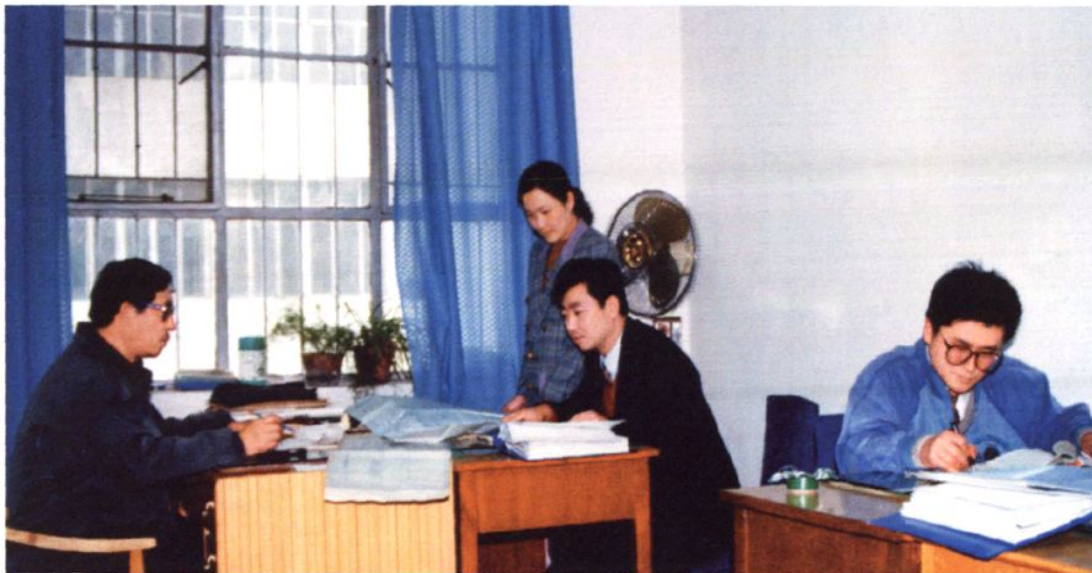
1994年10月,审计人员在工程决算