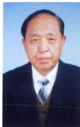
银川市审计局原党组书记、局长 沈 忠