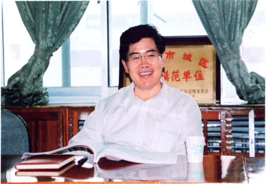
宁夏回族自治区党委常委、银川市市委书记崔波在银川市审计局听取工作汇报