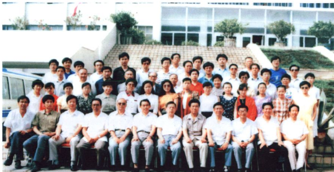
1991年8月,国家审计署审计长吕培俭(前排右六)在区、市有关领导的陪同下到银川市审计局视察工作并与全体干部合影