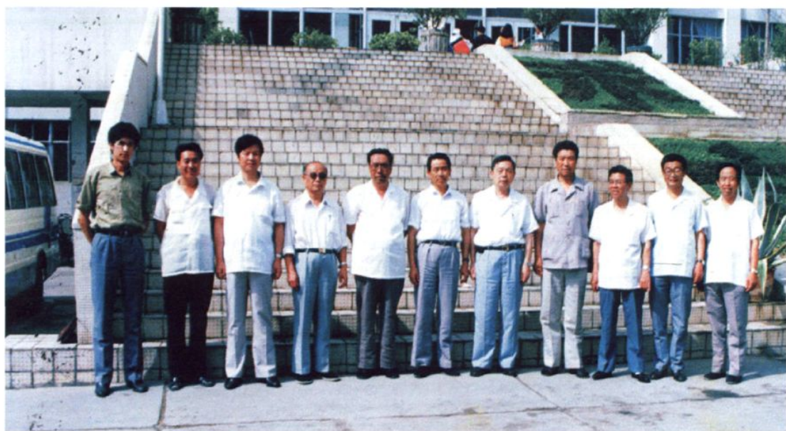
1991年8月,国家审计署审计长吕培俭(右五)在区、市有关领导的陪同下到银川市审计局视察工作并与局领导合影留念