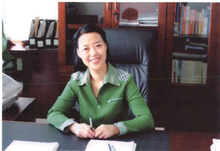
银川市审计局党组书记、局长 李自辉