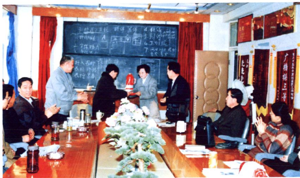
1997年12月,银川市审计局领导给特邀审计员颁发聘书