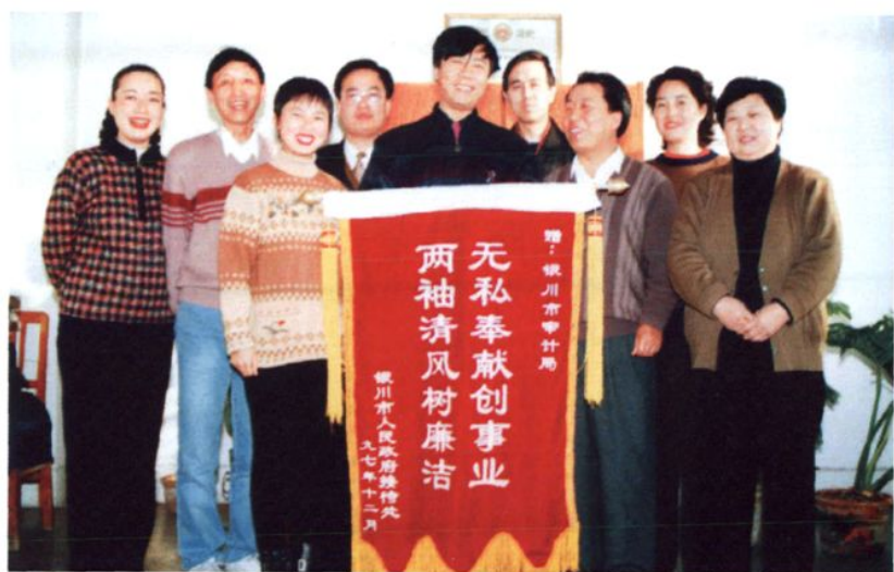
1997年银川市人民政府接待处给银川市审计局行政事业科送锦旗