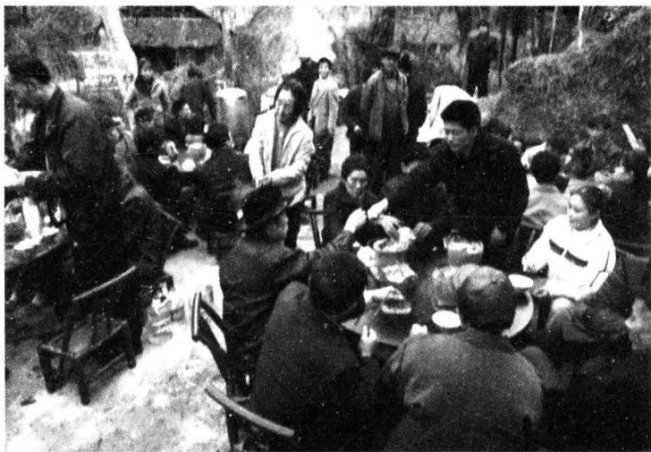
沅陵不同的村落有着不同的语言和不同的生活方式

沅陵境内方言纵横交错，杂乱无绪。人们在交谈时是田头地尾不同语，隔山过溪调不同。主要分汉话和乡话两大类型共五个方言片。