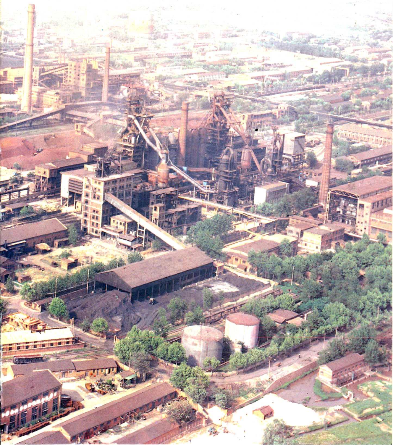
梅山冶金公司厂区全景