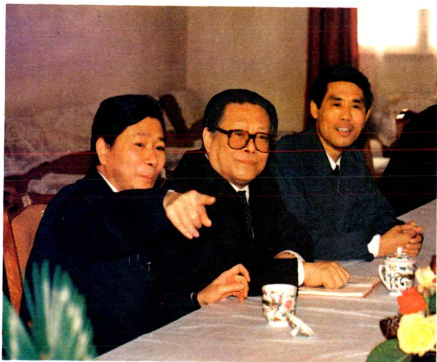
1988年5月16日中共中央政治局委员、中共上海市委书记江泽民视察梅山时与公司党政领导座谈。