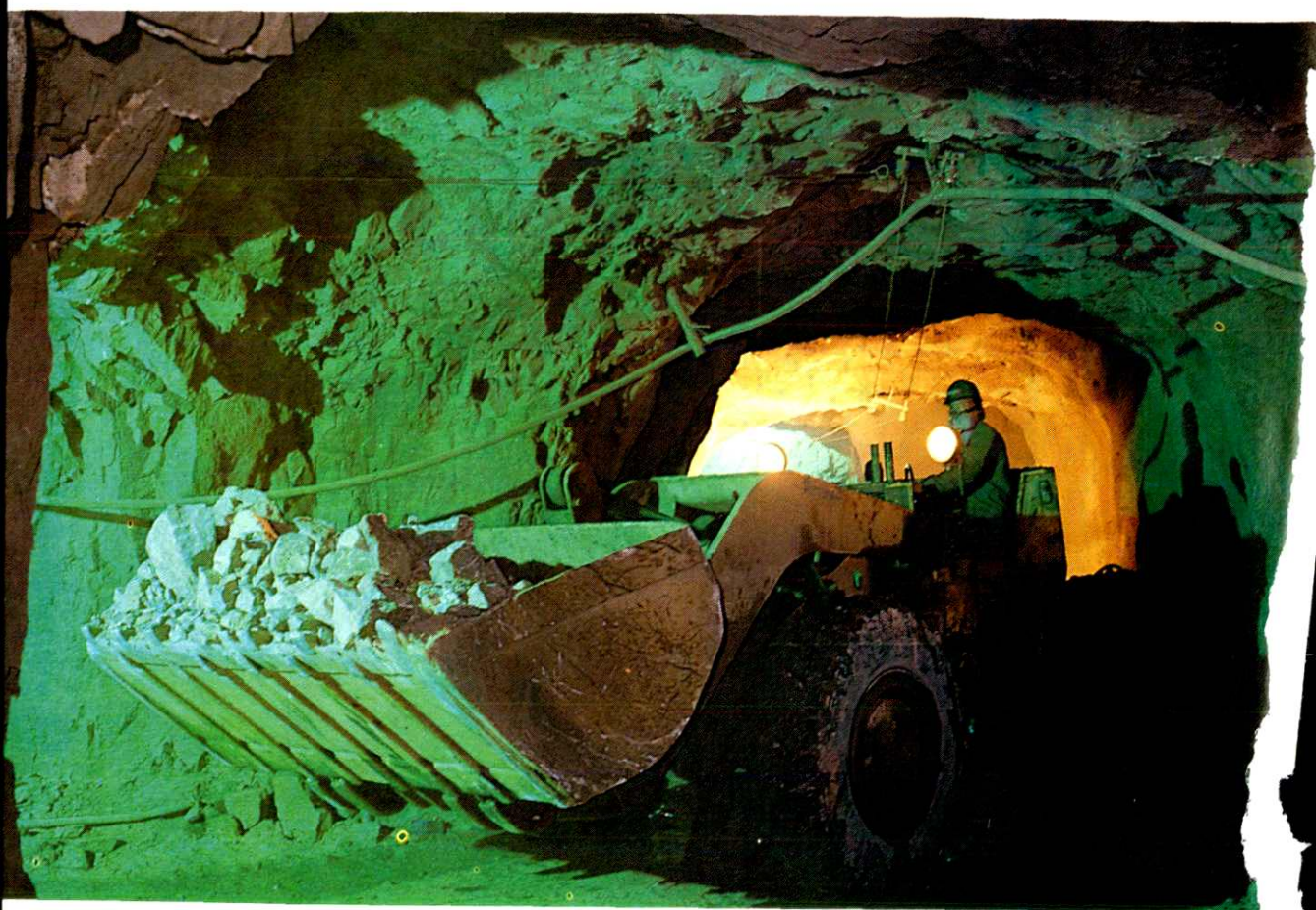
波兰引进的 2\text{ m}^3 装载机