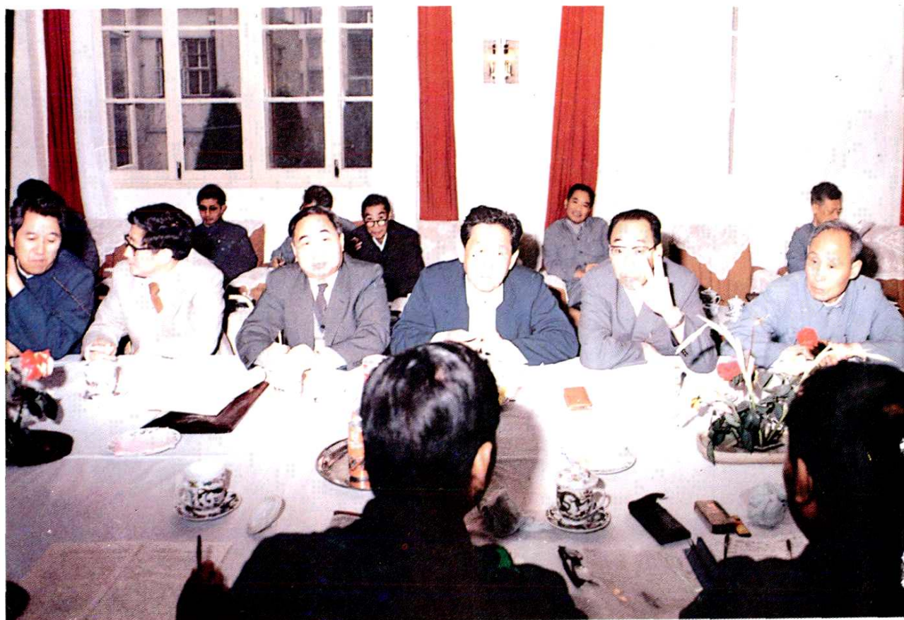
1986年10月18日国务院利用外资加快发展钢铁工业领导小组办公室在梅山召开现场办公会议，确定梅山列入利用外资进行扩建的项目之一

（自右至左国务院上海经济区规划办公室副主任白扬、冶金工业部部长戚元靖、国家计委副主任柳随年、江苏省副省长陈焕友、中共上海市委副书记黄菊、南京市市长张耀华）