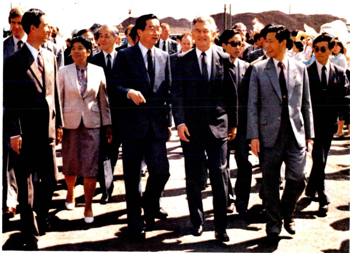
1986年5月23日中共中央政治局委员、书记处书记胡启立，江苏省省长顾秀莲陪同澳大利亚总理罗伯特·霍克访问梅山。