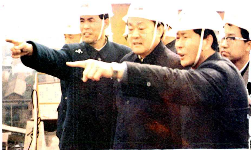
1987年4月4日上海市委书记芮杏文视察梅山时公司经理张思明、党委书记刘新昌陪同登高俯视厂区全景

（自右至左国务院上海经济区规划办公室副主任白扬、冶金工业部部长戚元靖、国家计委副主任柳随年、江苏省副省长陈焕友、中共上海市委副书记黄菊、南京市市长张耀华）