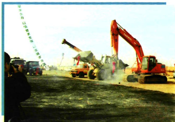
宁夏分公司机房楼施工现场