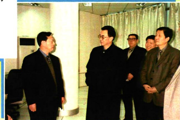
2000年2月18日,自治区主席马启智(左二)副主席马骏廷(右一)视察宁夏分公司。