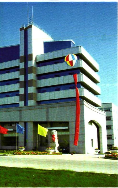
宁夏分公司办公大楼