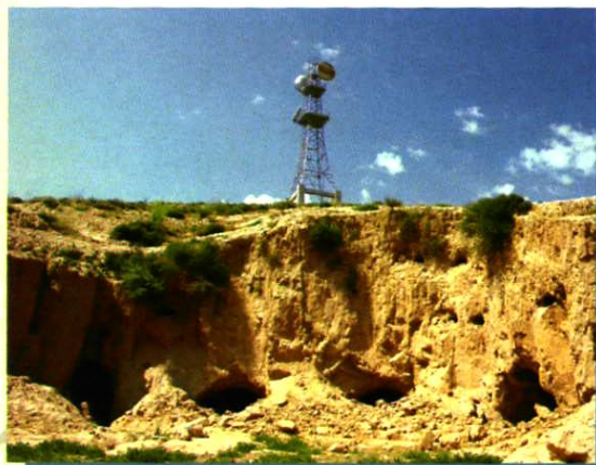
公司 GSM 网络一期牛首山基站