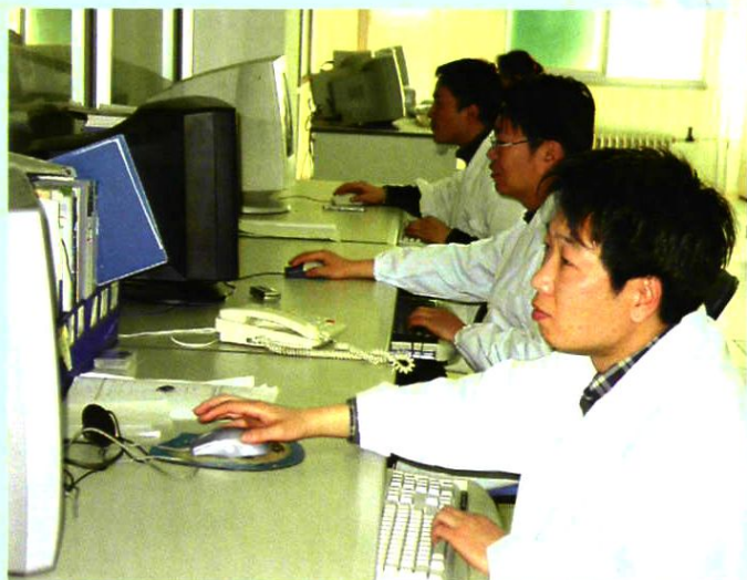
2003年2月18日,维护人员在进行日常工作。