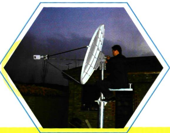
2005年11月3日,技术人员在调试接收天线。