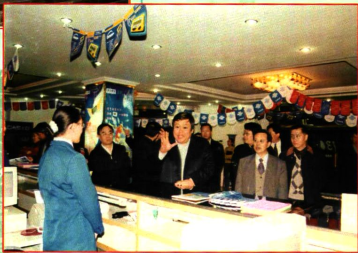
2000年11月18日,信息产业部副部长张春江(前排右三)视察宁夏分公司。