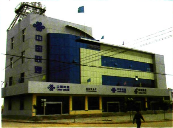
固原分公司办公楼