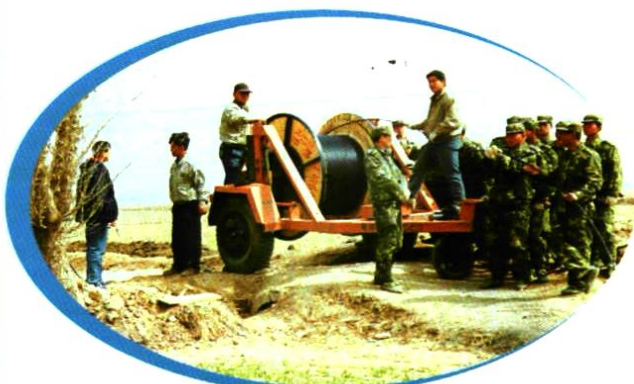
光缆干线施工现场