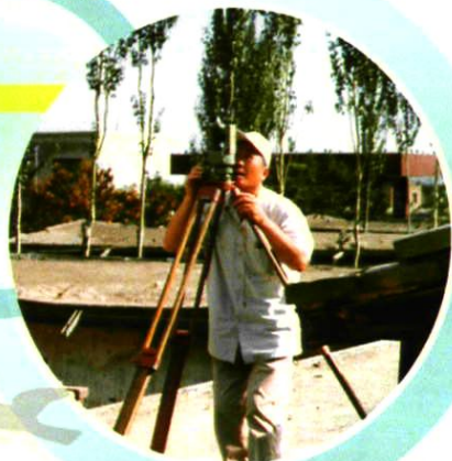
技术人员在测量基站位置