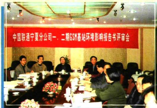
2001 年 3 月 25 日, GSM 基站环境影响评审会。