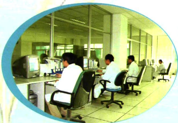
宽敞明亮的值班室