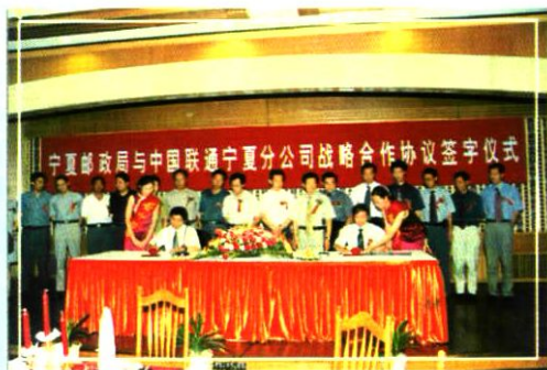
2001年7月18日,公司与宁夏邮政签署战略合作协议。