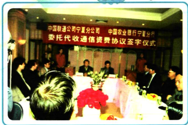
2001年7月30日,公司与中国农业银行宁夏分行签署代收收费协议。