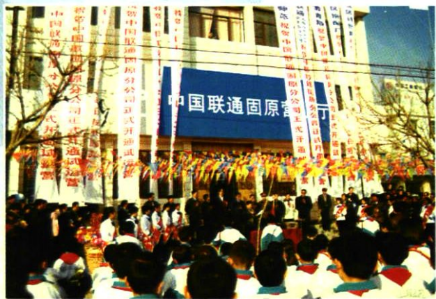
固原分公司营业厅开业