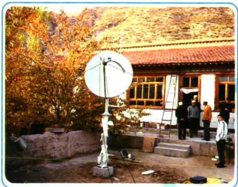
2005 年 10 月 25 日,村村通工程安装在村民家里的接收天线。