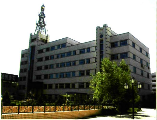
宁夏分公司机房大楼