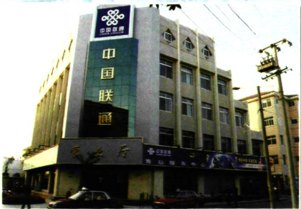
银川分公司办公楼