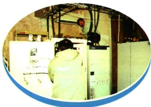
技术人员在维护基站设备