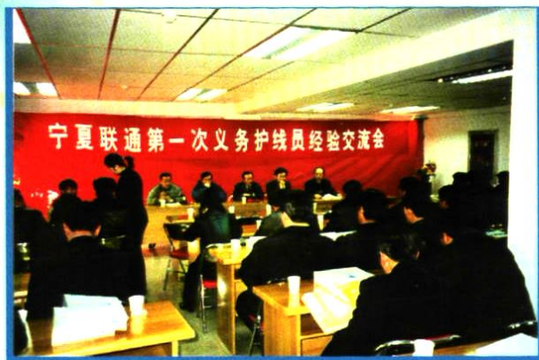
1994年1月28日,宁夏联通第一次义务护线员经验交流会。