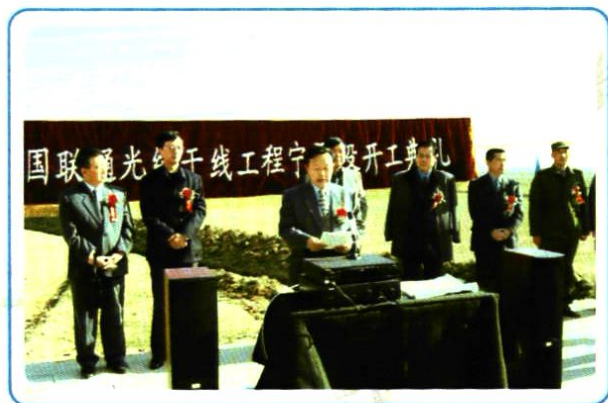
2000年4月3日,连接北京-兰州的光纤干线宁夏段正式开工。