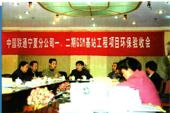
2001年3月26日,GSM网环保验收会议。