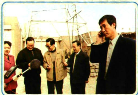
2001 年 3 月 26 日,基站辐射测试。