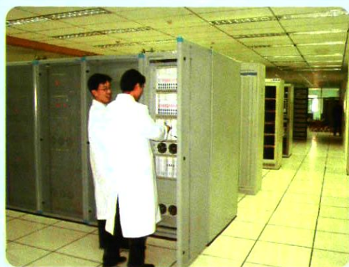
2003年2月20日,维护人员在检查设备运行情况。