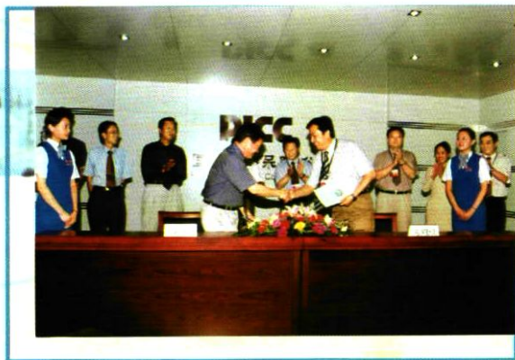
2003年6月18日,公司与中国人民保险公司宁夏分公司签署业务全面合作协议。