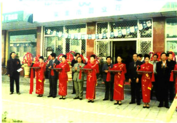
1999年10月26日,吴忠分公司营业厅开业