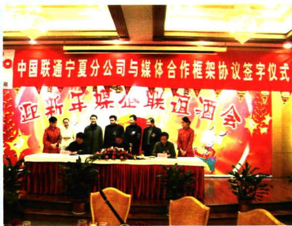
2006年12月22日,媒体合作框架协议签字仪式。