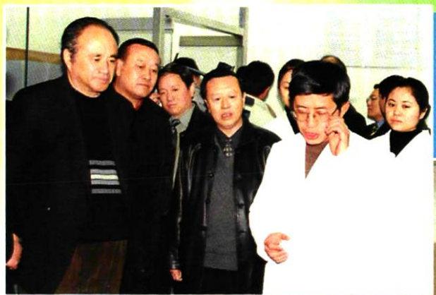
2001年1月18日,自治区党委书记毛如柏(左一)视察宁夏分公司。