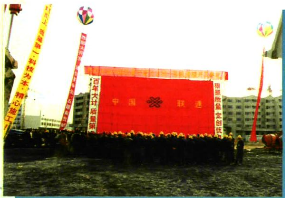
宁夏分公司一号机房楼开工典礼