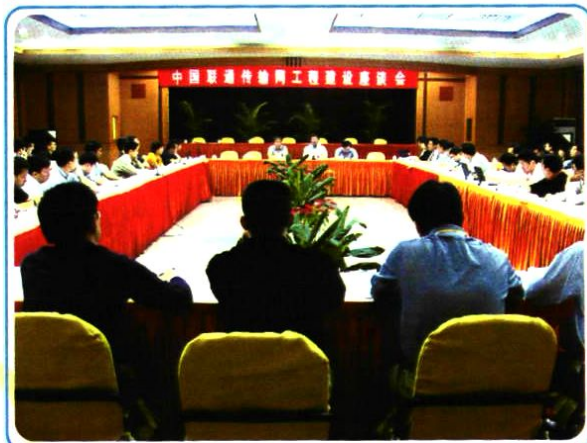
2005年8月23日,中国联通传输网工程建设座谈会在宁夏召开。