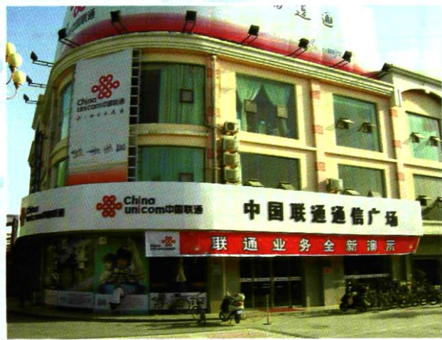
中卫分公司营业厅