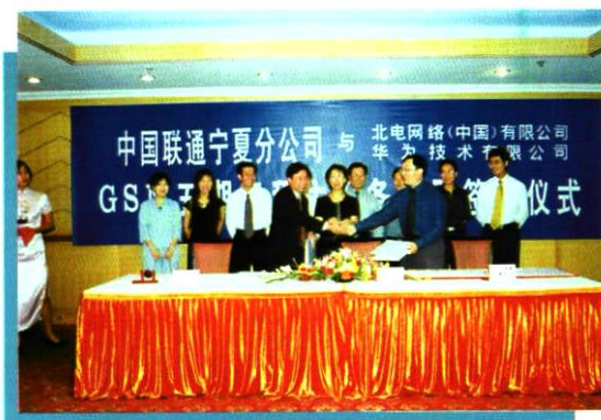
2002年8月26日,公司与北电网络(中国)有限公司 华为技术有限公司签订 GSM 五期设备合同。