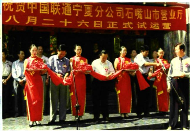
1999年8月26日,石嘴山分公司营业厅开业