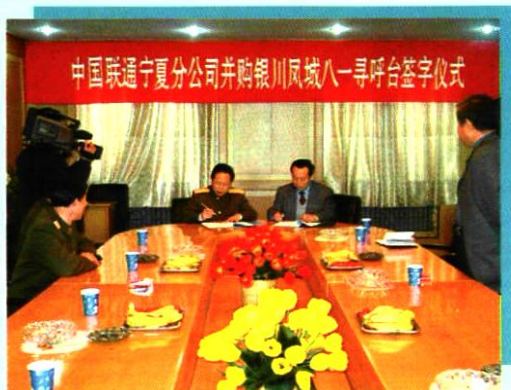
2003年3月7日,公司并购银川凤城八一寻呼台。