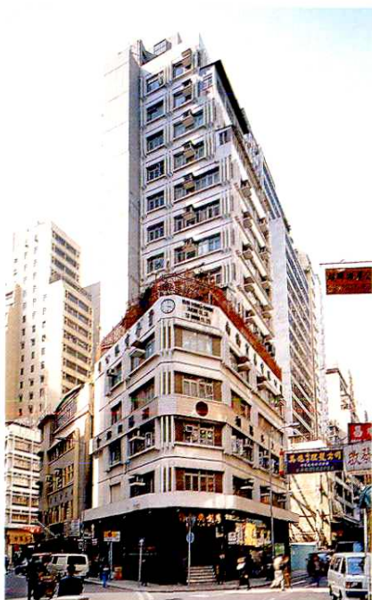
上環豐樂大廈 1979年公司寫字樓