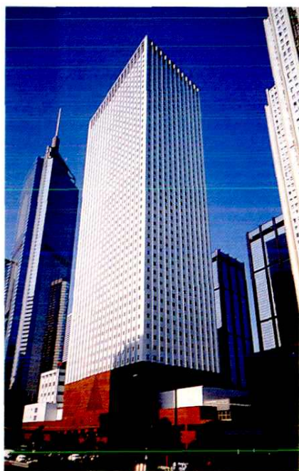
灣仔華潤大廈1983年9月 —1986年8月公司寫字樓