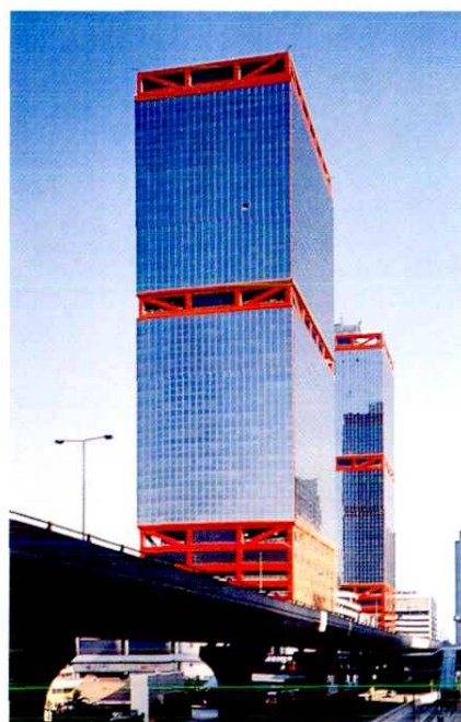
上環信德中心1986年9月 —1991年9月公司寫字樓