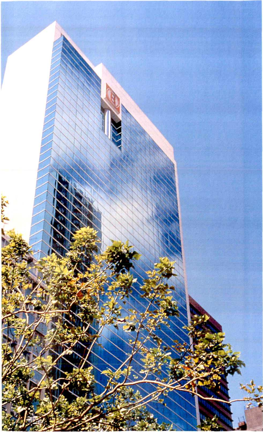
灣仔中國海外大廈1991年10月以後公司寫字樓