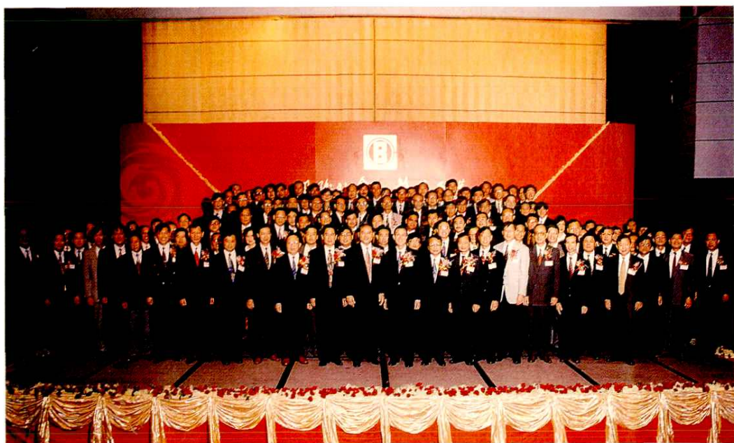
中國海外集團成立十五週年酒會