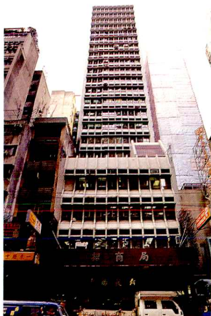
上環招商局大廈1979年— 1983年8月公司寫字樓