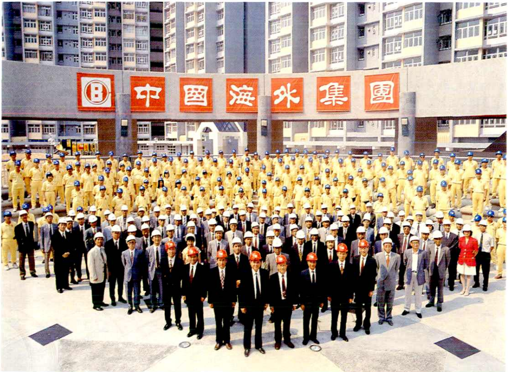
中國海外集團成立十五週年員工合照