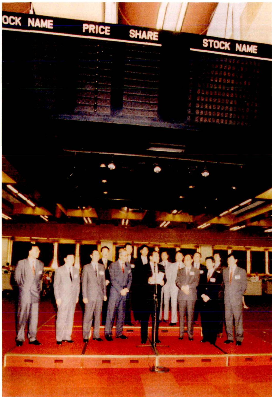
1992年8月20日中國海外發展有限公司在香港聯合交易所掛牌上市