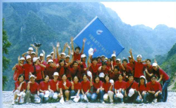
2004年8月院团委组织学生到革命老区百色参加“水利之光”夏令营活动