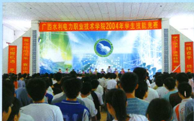
加强学生生产技能培训，适应工作需要，学院重视学生的全面发展。图为2004年学生技能比赛