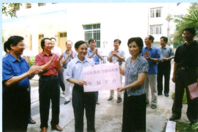
自治区人民政府副主席袁凤兰(前右一)在教师节前夕 到校慰问教师(2001年9月)