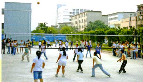
班际排球比赛正在进行(2005年11月)