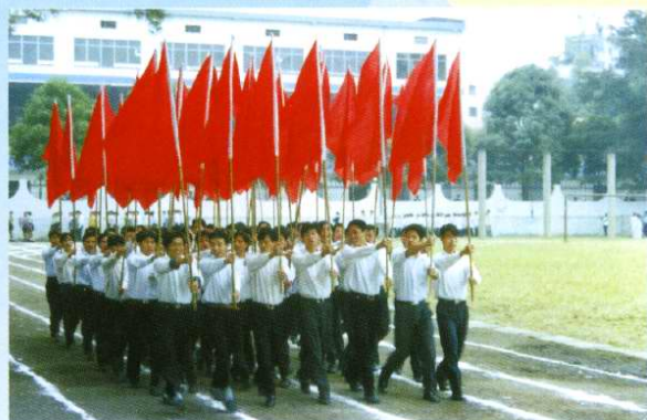
广西水电学校第31届田径运动会红旗队步入会场(2001年11月)