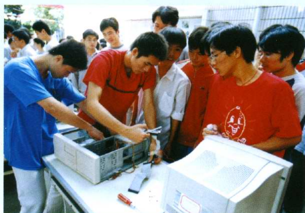
计算机与信息工程系举办学生计算机拆装大赛(2000年9月)