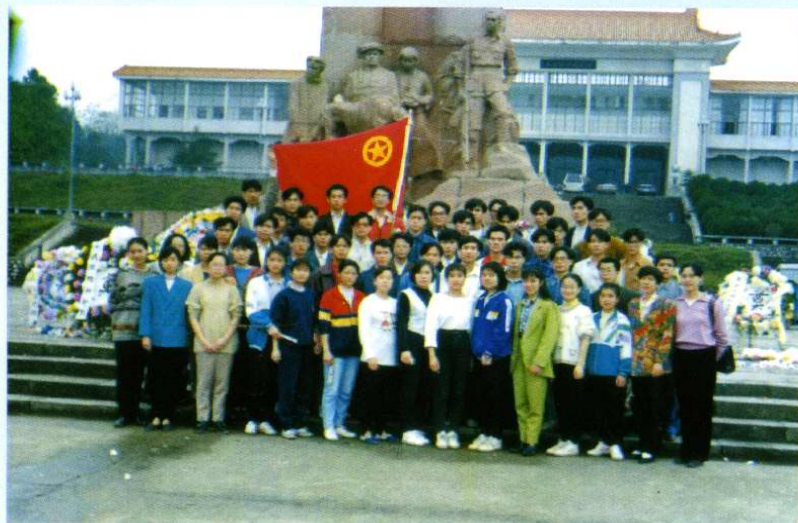
院团委组织团干、 学生会干部到烈士陵园 进行革命传统教育 (1995年10月)