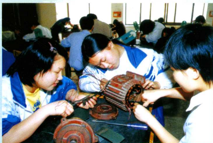
电力系学生在做电动机安装实训(1998年12月)