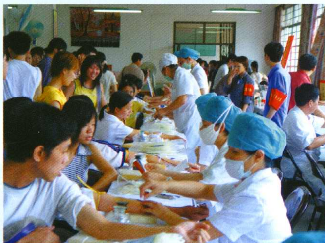
院团委、学工处组织学生参加义务献血(1999年10月)