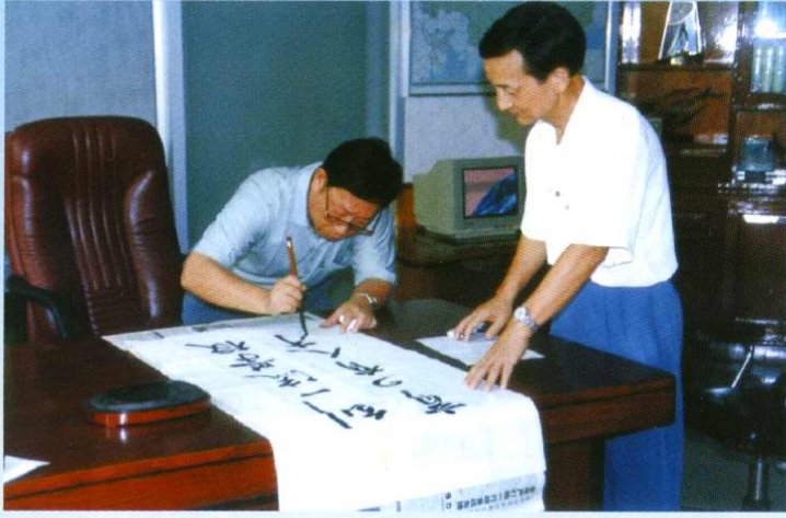
自治区水电厅厅长吴锡瑾到校视察并为学院题词(1996年6月)