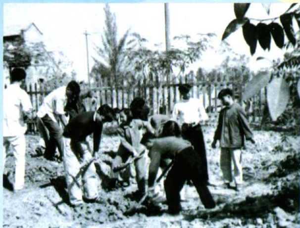
学生在水利工地劳动(1959年11月)