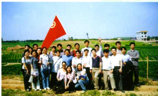
院党委组织年轻党员和团员进行革命传统教育(1996年4月7日)