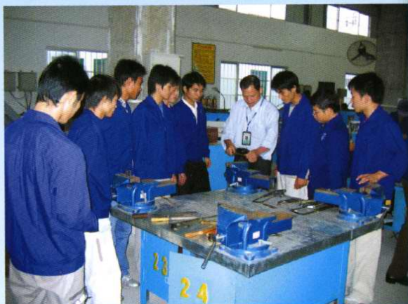
机电工程系教师给学生讲解钳工操作方法 (2005年10月)