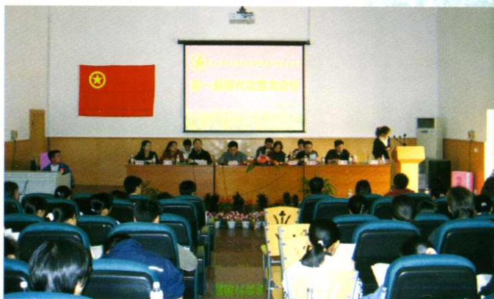
2005年6月召开的团代会现场