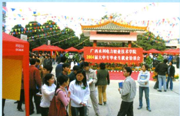
为拓宽就业渠道，学院每年为毕业生举办或组织就业招聘会、洽谈会。图为在学校内举办的洽谈会(2004年11月)