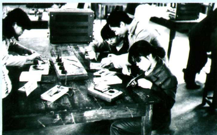
电力专业学生用仪表在做电流电压的测试(1961年6月)