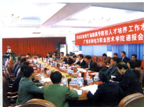
由自治区教育厅组织的高职高专院校人才培养工作水平评估专家在学院通报会上听取学院领导作情况汇报(2005年11月)