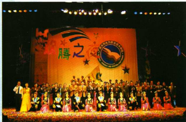
“迎评估、欢腾之夜”专场文艺晚会演出结束后，评估专家与演员留影(2005年10月)