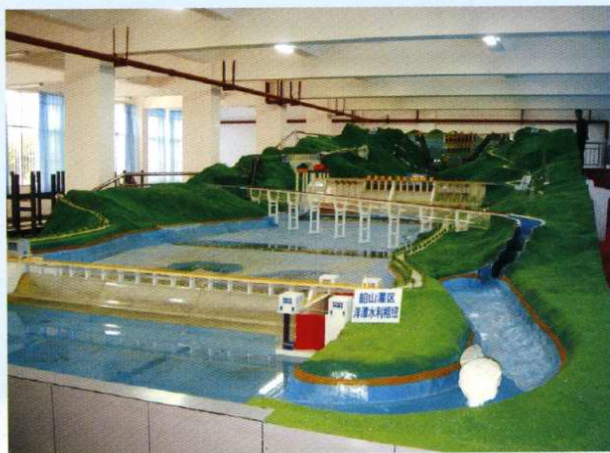
水利灌区枢纽工程模型