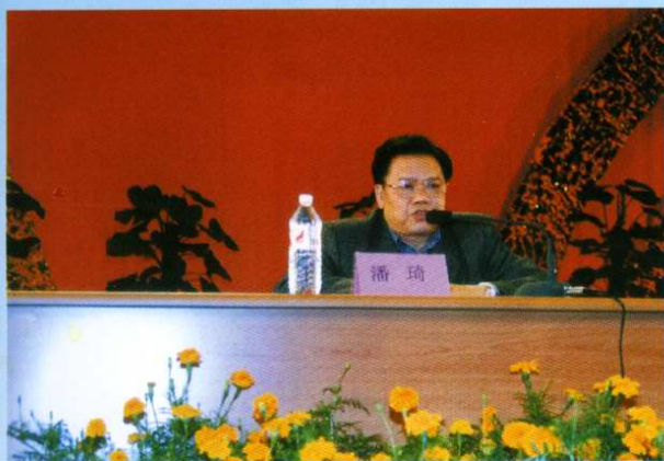
自治区党委副书记潘琦到校作学习十六大报告 (2001年11月)