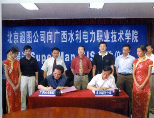
北京超图公司向学院赠送计算机设备, 双方代表在签字(2005年9月)