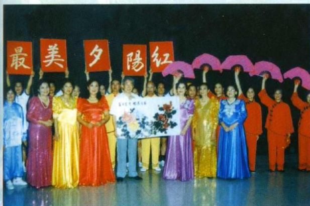
院人事处组织离退休教职工表演队参加南宁市兴宁区国庆文艺晚会演出后合影(2004年9月)