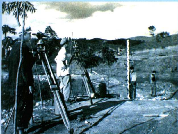
学生在施工工地进行测量实习(1958年10月)