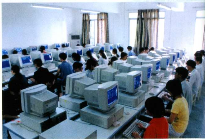
中专2000级学生在计算机实验室进行C语言程序设计 (2001年5月)