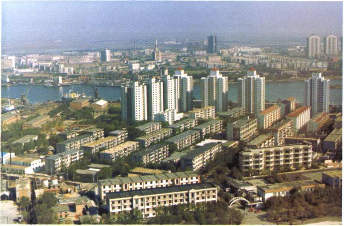
经过半个世纪的建设，塘沽海河两岸的城市面貌发生了翻天覆地的变化。这是滨海新村（上）和城区中心的新华路立交桥（下）。