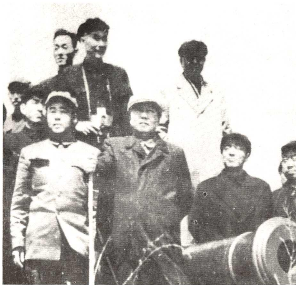
一九五四年四月二十三日毛泽东主席亲临塘沽视察大沽炮台遗址。