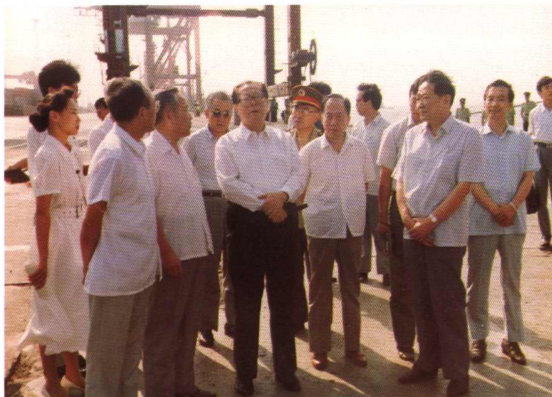
1991年7月27日，江泽民主席视察天津港，对港口的开发建设作重要指示。