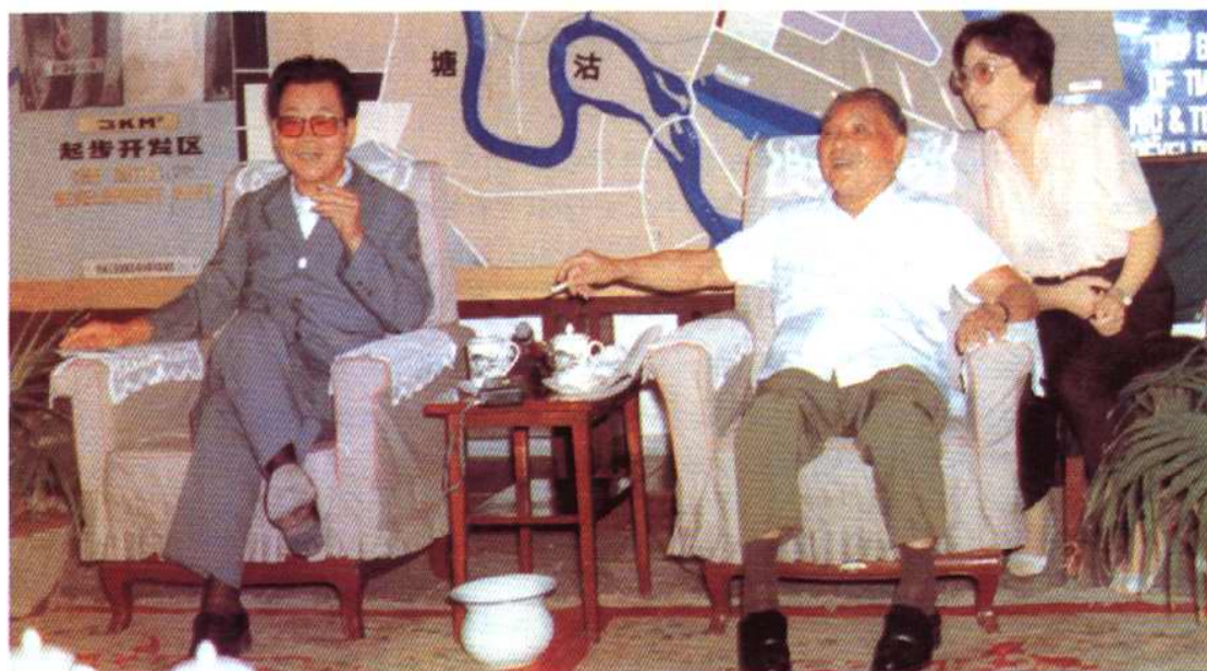
1986年8月，邓小平同志在李瑞环市长陪同下视察天津经济技术开发区，指出天津港口和市区之间的荒地，“是个很大的优势”，“潜力很大，可以胆子大点，发展快点”。