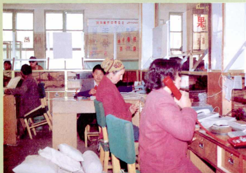
温宿县邮电局营业室