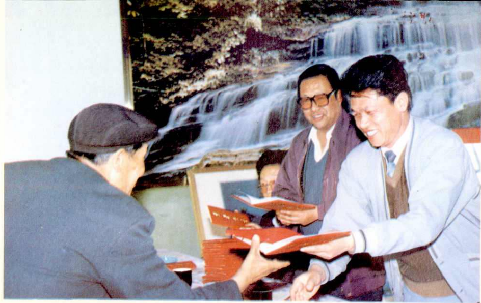
县邮电局一九九三年工作总结表彰会议