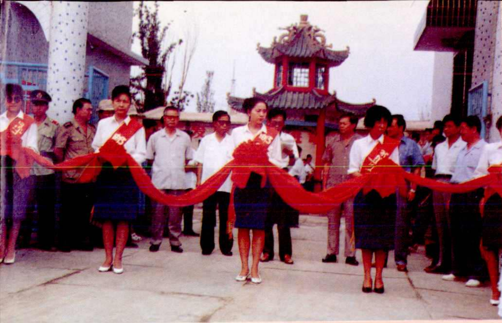
温宿县程控电话暨光缆联网竣工典礼