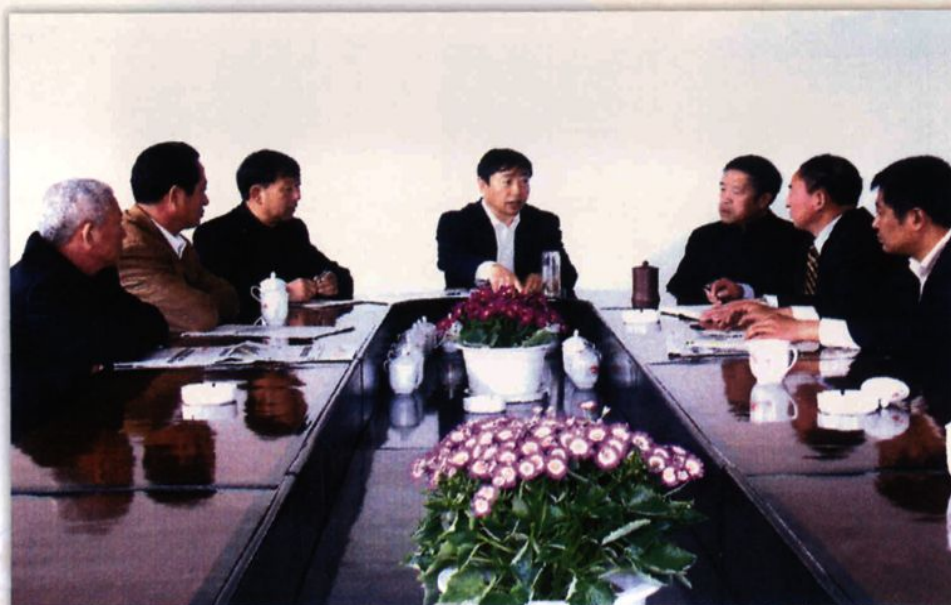
领导建设五里头新农村的一班人