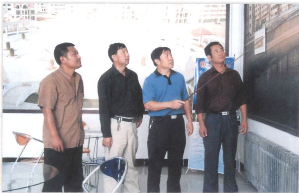
“两委”在反复修改完善五里头村改造规划