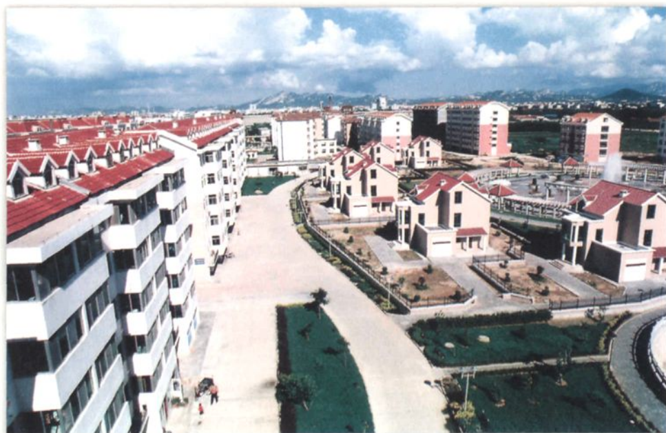
东 华 苑 社 区