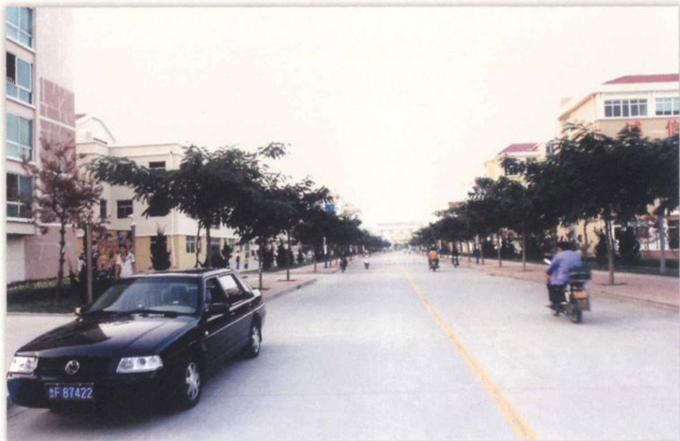
东 华 路