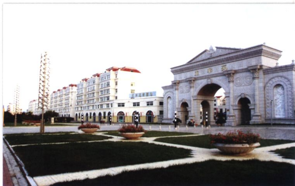
东华苑北大门欧式牌楼