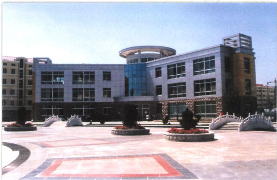
会所：一楼医疗室 二楼乒乓球室 三楼娱乐、健身室、监控室