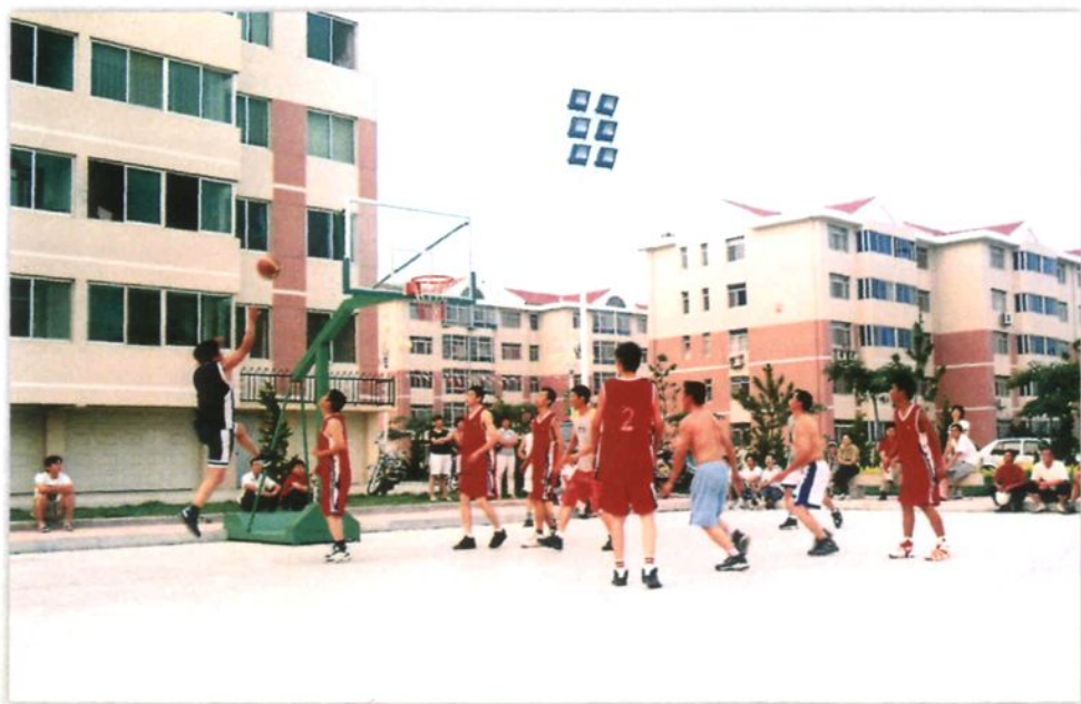
居民、员工尽情活动