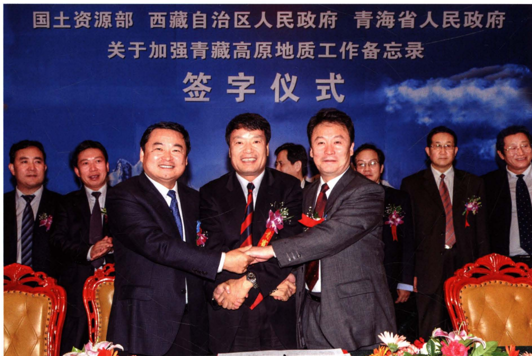
2008年9月24日,国土资源部、西藏自治区人民政府、青海省人民政府在拉萨举行《关于加强青藏高原地质工作备忘录》签字仪式。徐绍史、郝鹏、徐福顺代表三方签字。