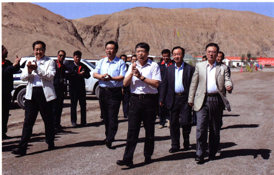
2012年8月23日,国土资源部党组书记、部长、国家土地总督察徐绍史,部党组成员、国土资源部副部长、中国地质调查局党组书记、局长、青藏专项领导小组组长汪民,青海省委常委、常务副省长、省政府党组副书记、青藏专项领导小组副组长徐福顺视察都兰县诺木洪乡五龙沟矿区调研地质找矿工作。