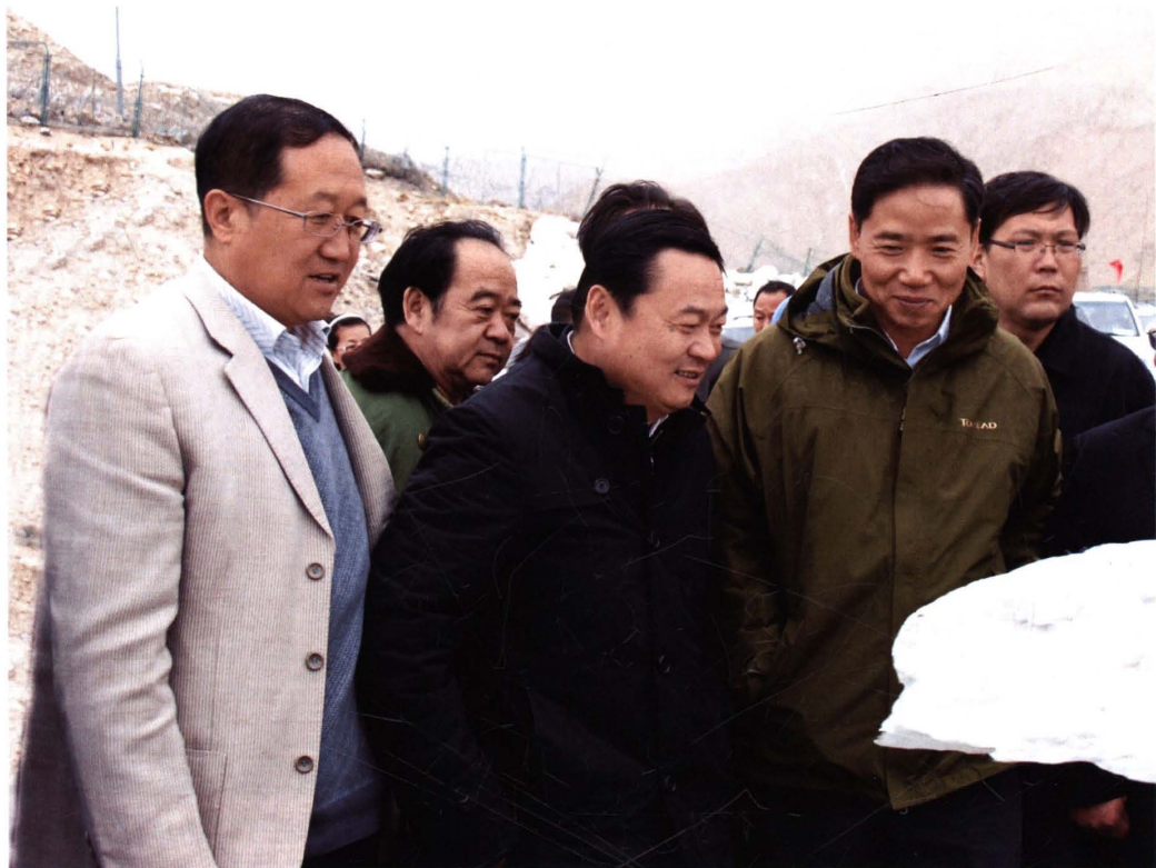
2013年5月28日,省委副书记、省长郝鹏在格尔木三岔河玉石矿调研。