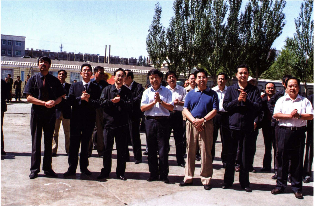
2007年7月31日,国土资源部党组书记、国家土地总督察徐绍史在省、厅领导陪同下在格尔木亲切慰问柴达木综合地质大队干部职工,发表了热情洋溢的讲话,并和该队职工高唱《勘探队员之歌》。