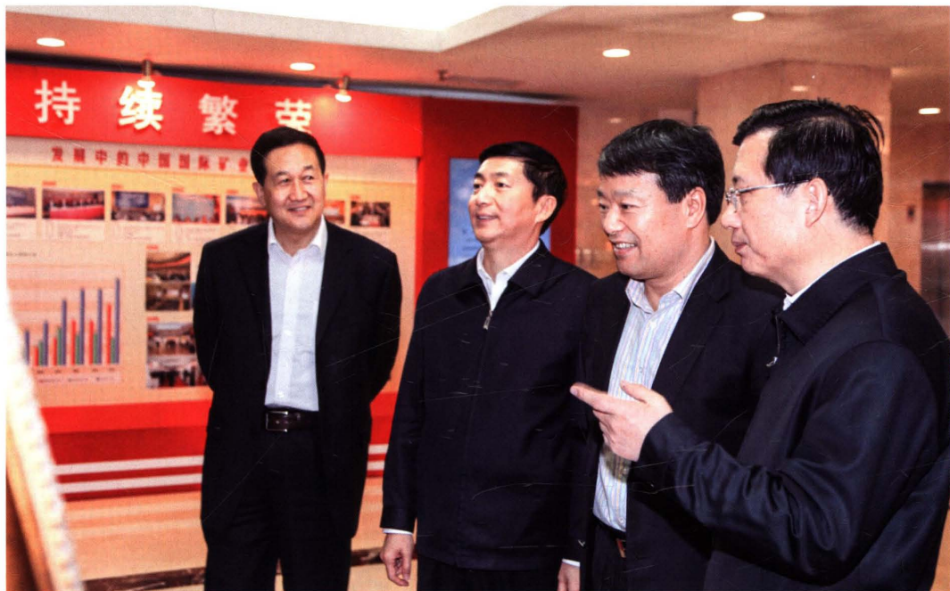
2011年3月4日下午,青海省委书记强卫、省长骆惠宁会见了国土资源部党组书记、部长、国家土地总督察徐绍史。双方就加强青海地质勘查、玉树地震灾区地质灾害隐患治理,加大三江源区矿山环境治理支持力度,争取将湟水河流域土地整治重大工程列入全国土地整治规划,继续加大土地利用年度计划指标的支持力度等事项达成共识。省国土资源厅厅长刘山青参加了会见。