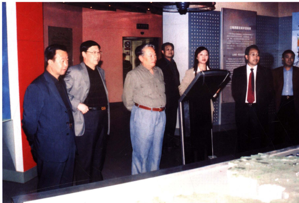
2005年5月13日,全国政协常委、原地矿部部长宋瑞祥,省人民政府副省长苏森参观省国土资源博物馆。马顺清、李志勇、高学忠、张佰川等厅(局)领导陪同。