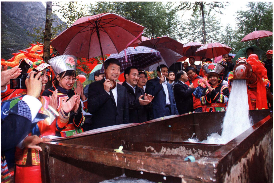
2011年9月21日,副省长马顺清、厅长刘山青陪同国土资源部部长徐绍史在互助县视察打井找水工作。