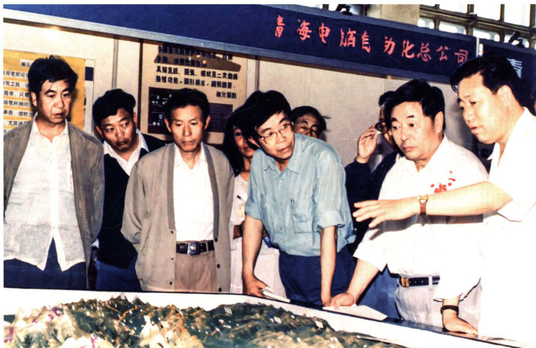
1994年7月20日,青海省委书记尹克升(右二)在“全国专利技术及产品博览交易会”青海省测绘局展台前,听取测绘工作情况介绍。