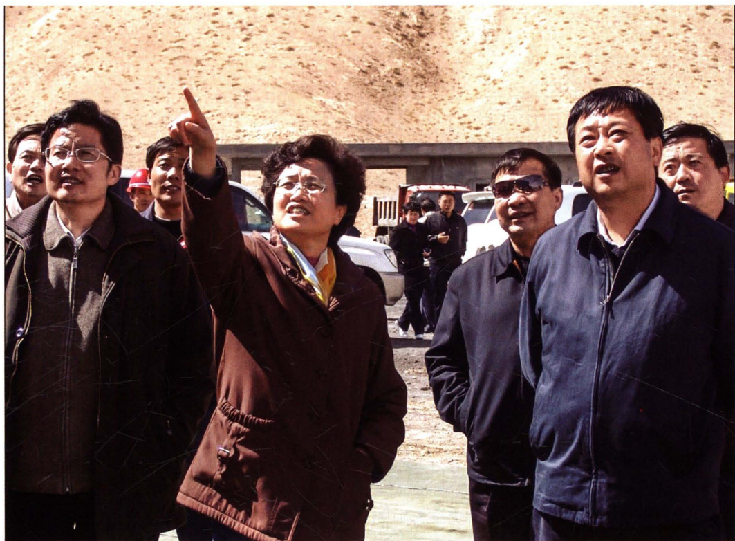
2008年4月18日,省长宋秀岩视察肯德可克矿区。