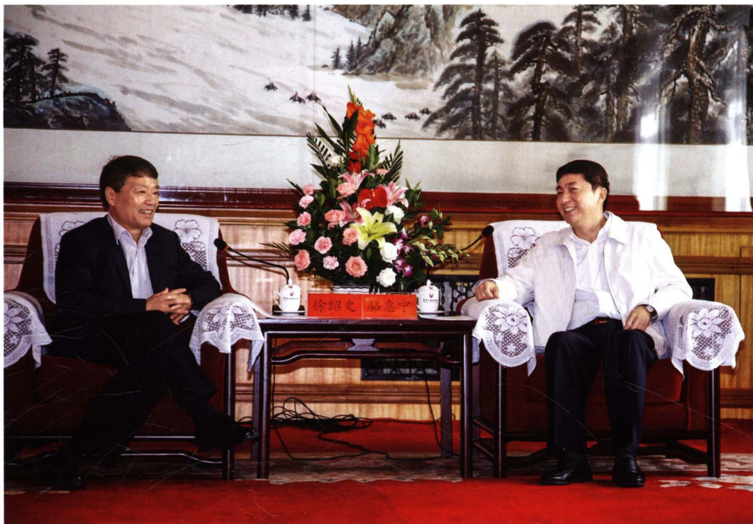
2012年8月23日,省委副书记、省长骆惠宁会见国土资源部部长、党组书记、国家土地总督察徐绍史,双方进行亲切交谈。