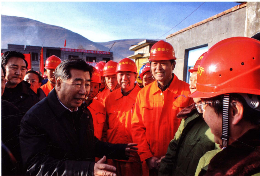
2010年4月24日,中共中央委员、国务院副总理、国务院抗震救灾总指挥部总指挥回良玉在玉树灾区看望省国土资源厅系统抗震救灾一线干部和技术人员。