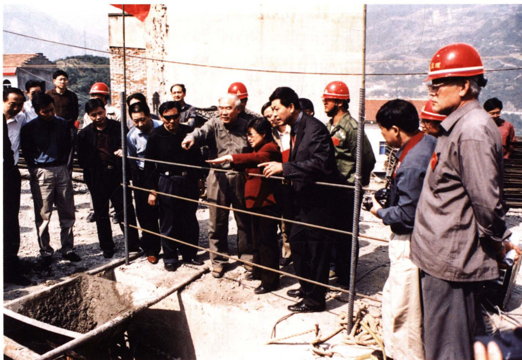
2002年10月8日,原国土资源部副部长寿嘉华视察省环境地勘局湖北三峡工地。