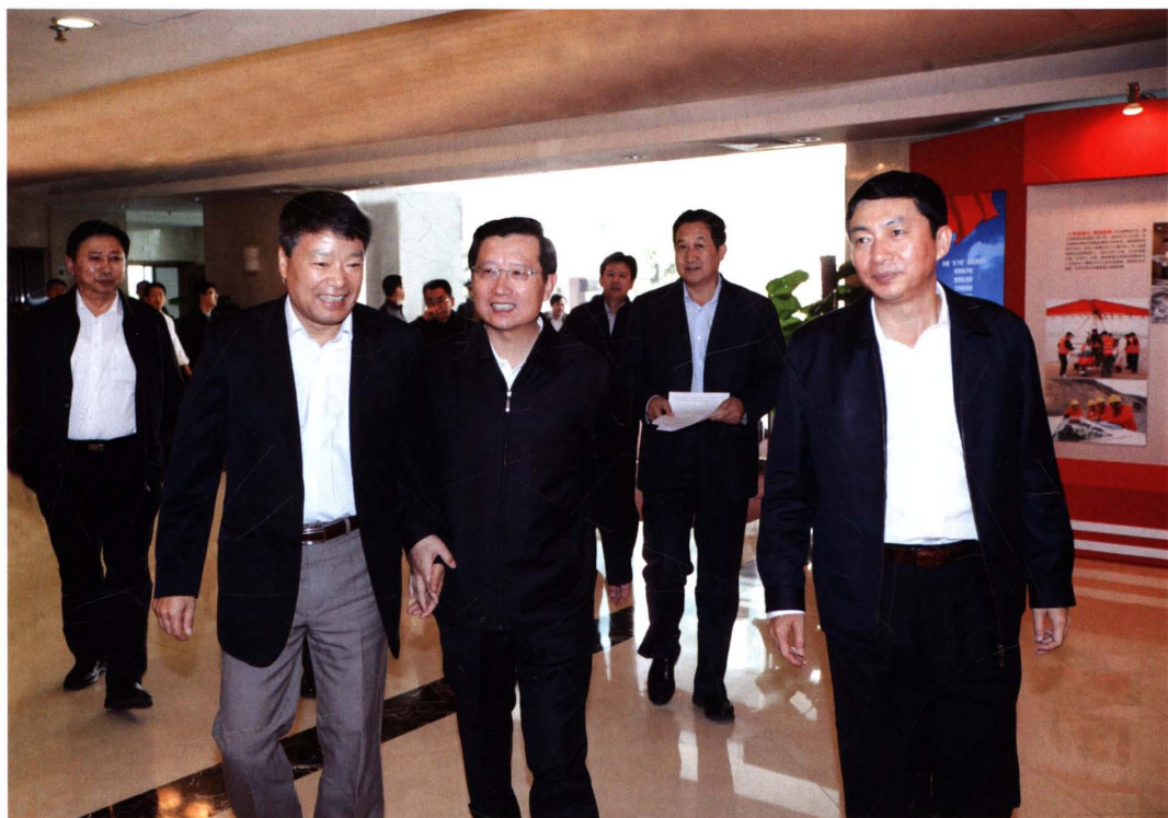
2010年10月13日,强卫、骆惠宁、刘山青等省委省政府和厅领导在北京拜会徐绍史、汪民等国土资源部领导。