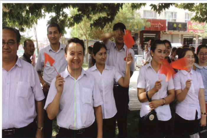
2013年6月20日，县联社组织机关人员欢送换防驻地部队官兵