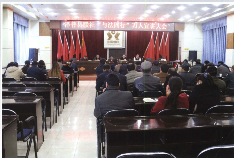
2015年11月28日，县联社召开“与法同行”万人宣讲大会