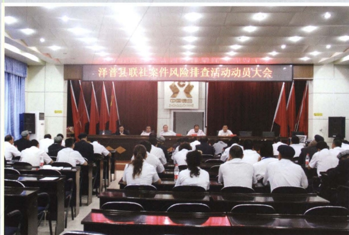
2013年8月22日，县联社召开案件风险排查活动动员大会