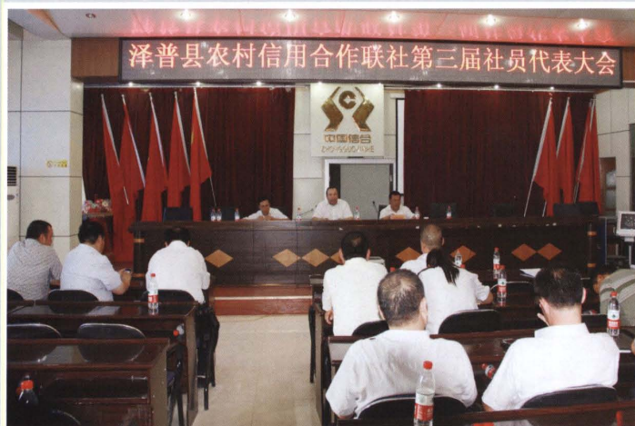
2013年7月18日，县联社召开第三届社员代表大会