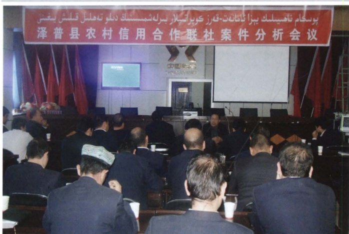
2011年10月16日，县联社召开案件分析会议