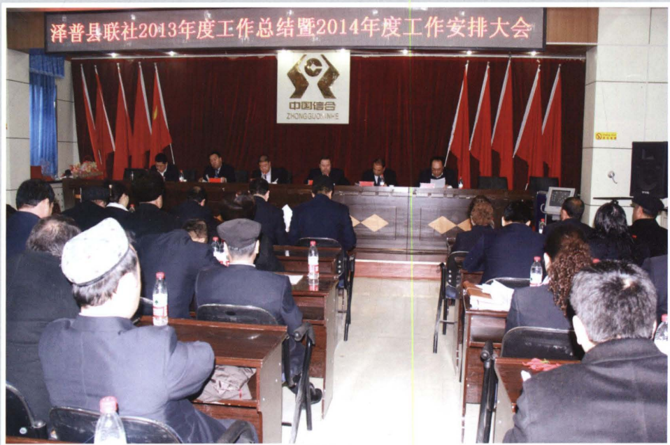
2014年2月12日，县联社召开2013年度工作总结暨2014年度工作安排大会