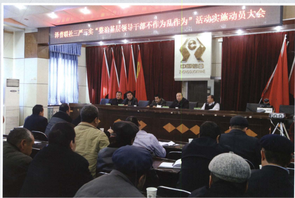
2015年11月28日，县联社召开“三严三实”整治基层领导干部不作为乱作为活动实施动员大会