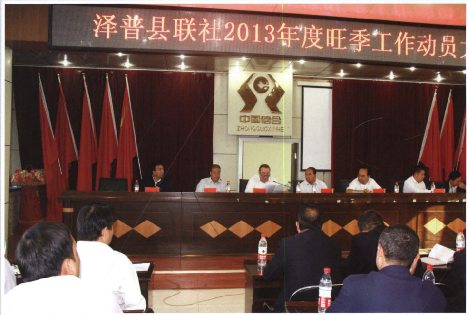
2013年9月22日，县联社召开旺季工作动员大会