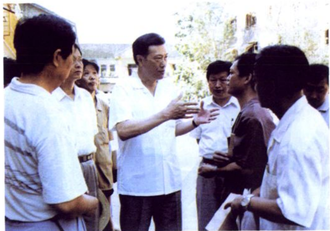
1995年7月20日，省长陈世能在铜仁地区人民医院视察洪灾。