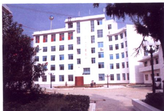
印江县人民医院门诊综合大楼