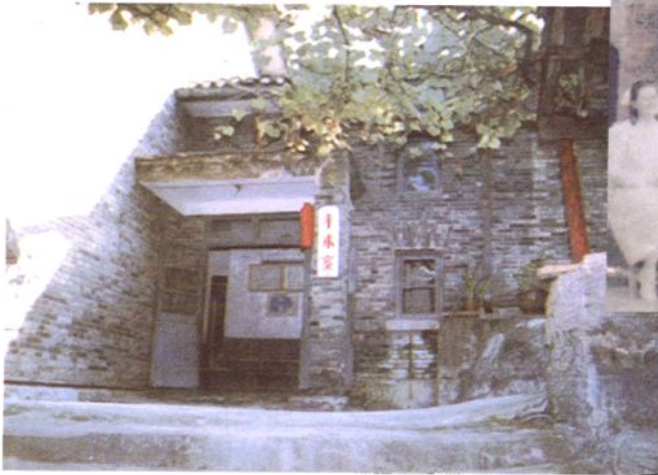
1965年，修建的铜仁地区医院手术室。