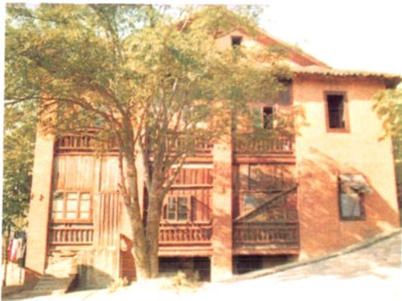
原铜仁福音医院红楼