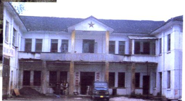
1953年，修建的铜仁地区医院门诊大楼。