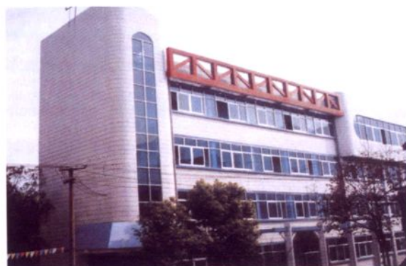
思南县人民医院医技大楼