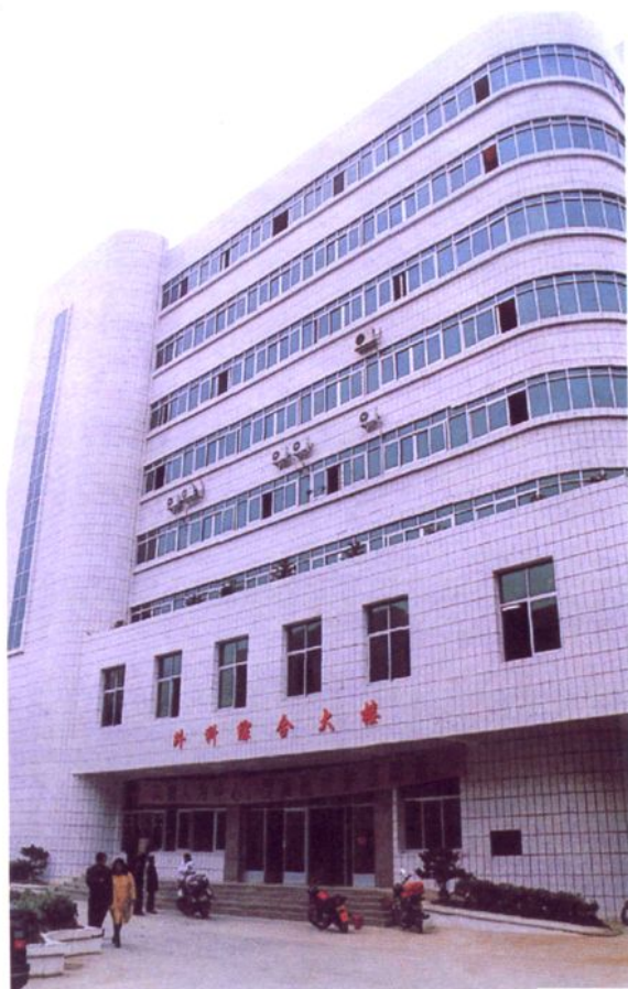
铜仁地区人民医院外科综合大楼