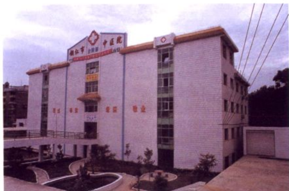
铜仁市中医院住院部