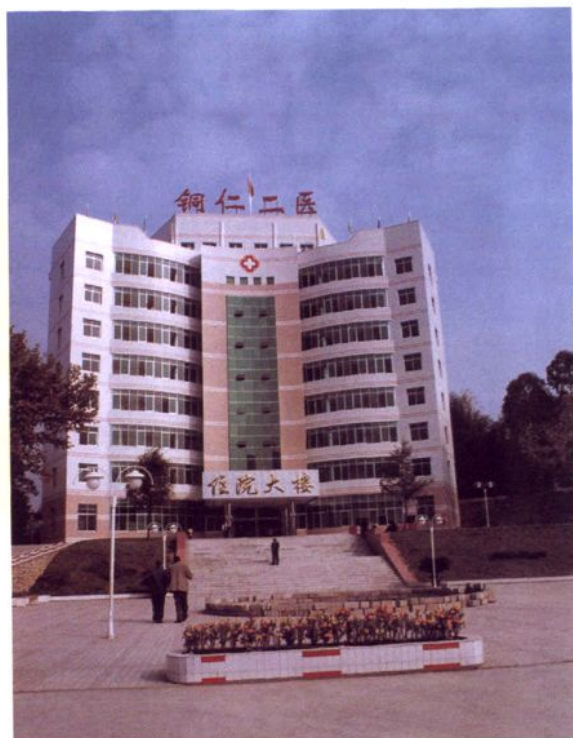
铜仁地区武陵山心血管医院（二医）住院大楼