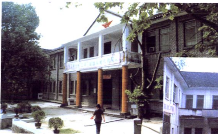
1955年，修建的铜仁地区医院内科病房楼。