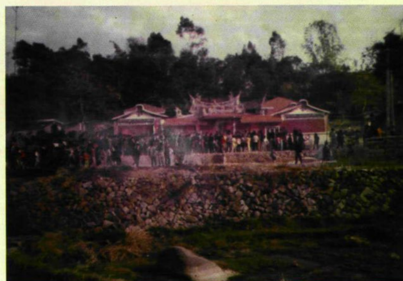
按原風格修建竣工后的雙鯉堂