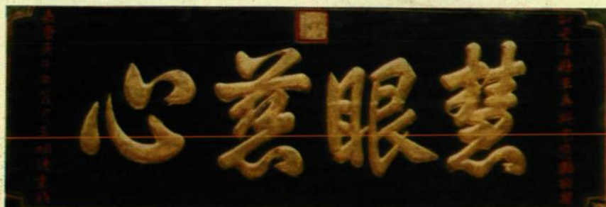
王祖德重鐫嘉慶庚午年霞月