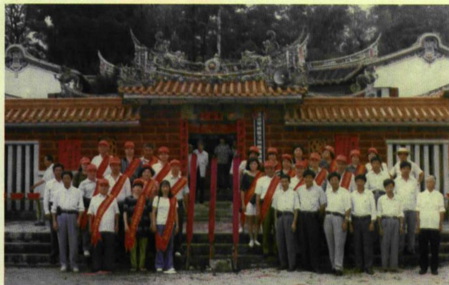
進香團與五里埔三村負責人合影