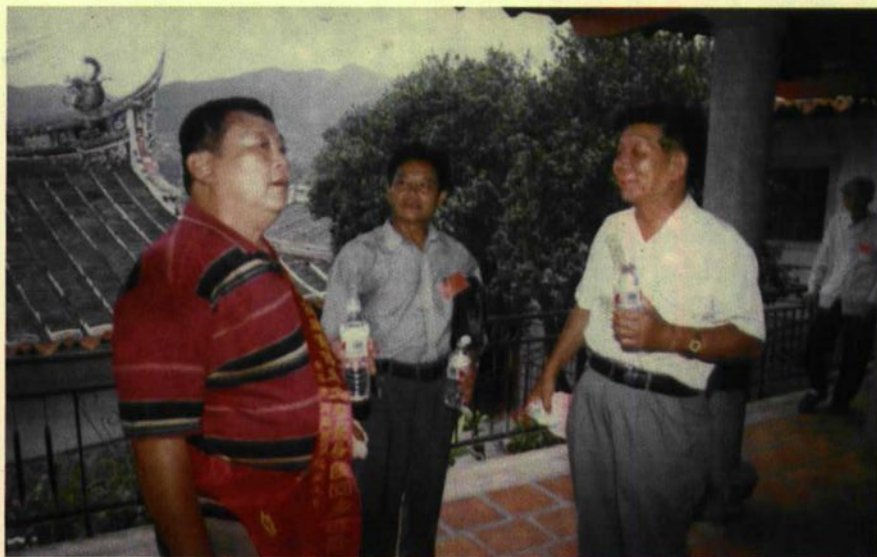
我們又在一起了，攝于雙鯉堂后殿祠堂