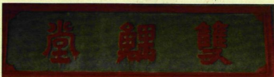
知安溪縣事吳與宋應麟敬題