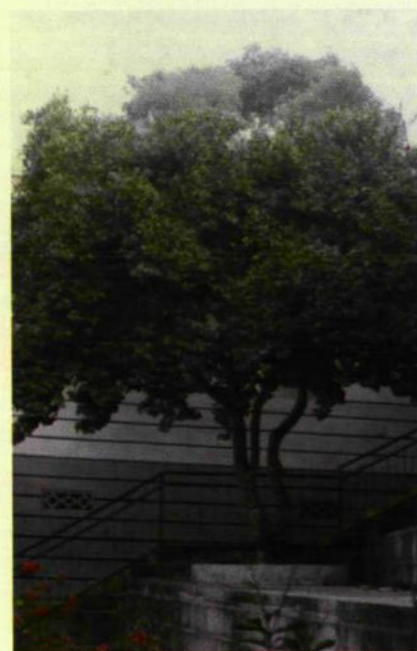
堂中后院，百年含笑花煥發出青春的氣息