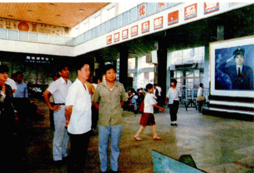
铁道部副部长孙永福(前中)来宝鸡站候车厅检查工作。