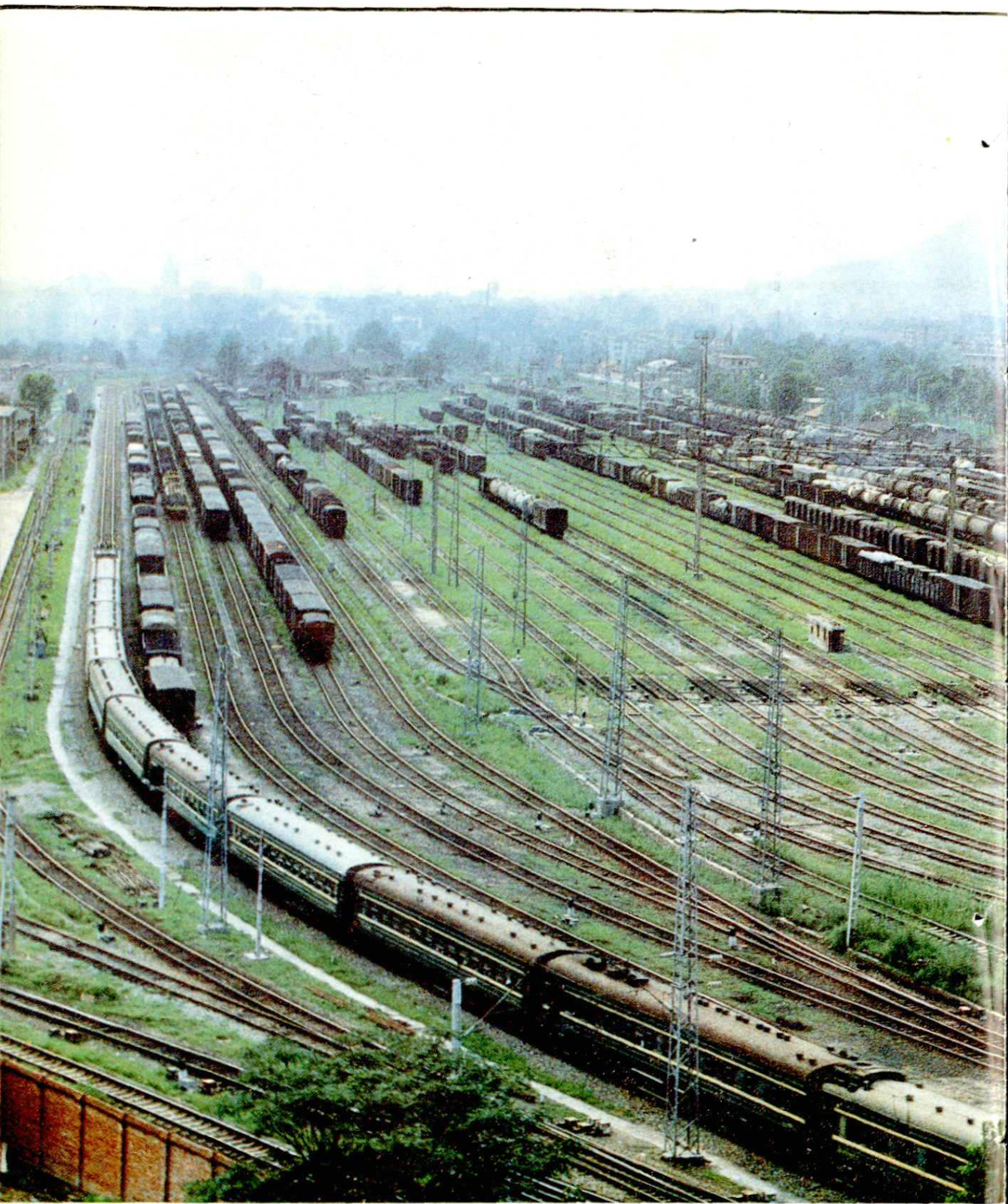
①繁忙的宝鸡东站编组场。