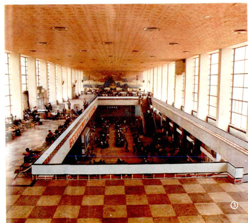
①1985 年底新建的 宝鸡车站。