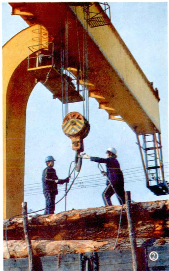
③宝鸡桥梁厂1987年被评为“全国环境优美工厂”。