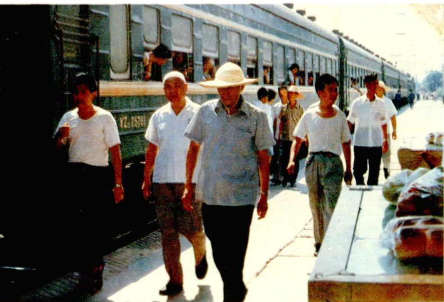
铁道部副部长石希玉(左三)在宝鸡车站检查工作。