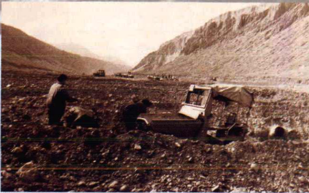
▲奎屯河整治工程 (1995年摄)