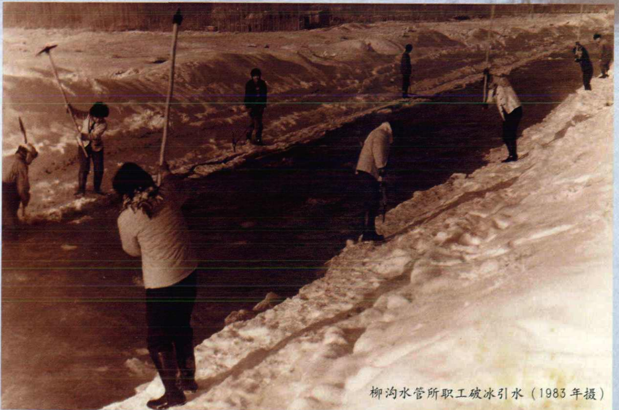
柳沟水管所职工破冰引水 (1983年摄)