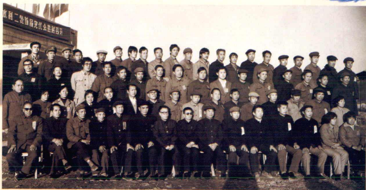
▲中国共产党水利二处第一次代表大会全体代表（1988年11月摄）