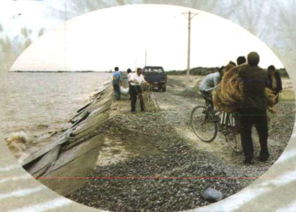
▲车排子水管所职工抢运抗洪物资 (1995年摄)