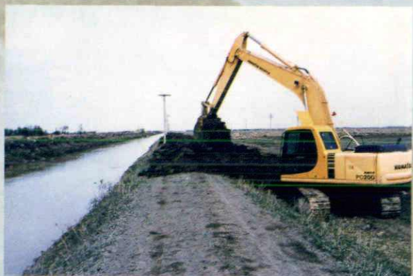
▲机械化加固渠堤 (1996年摄)