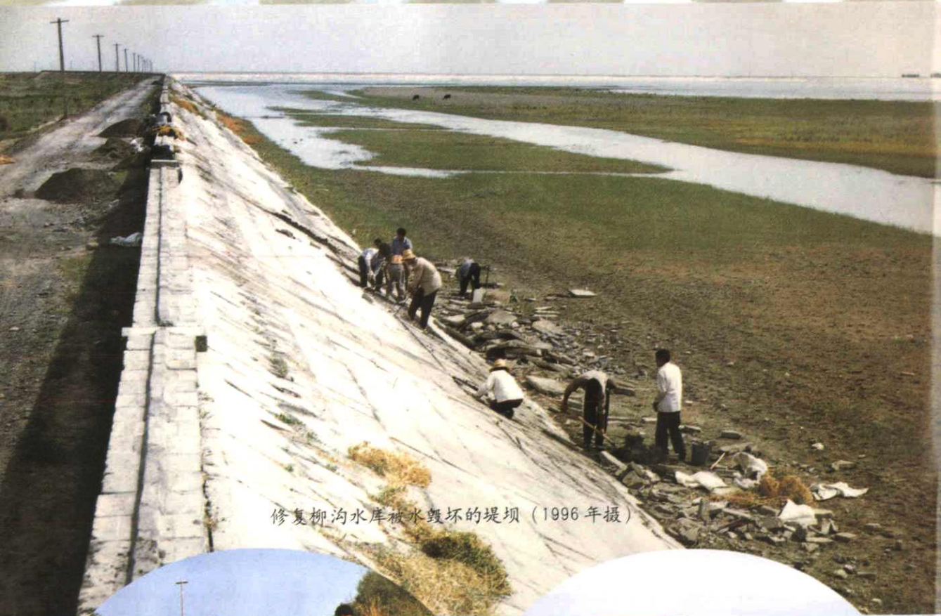
修复柳沟水库被水毁坏的堤坝 (1996年摄)