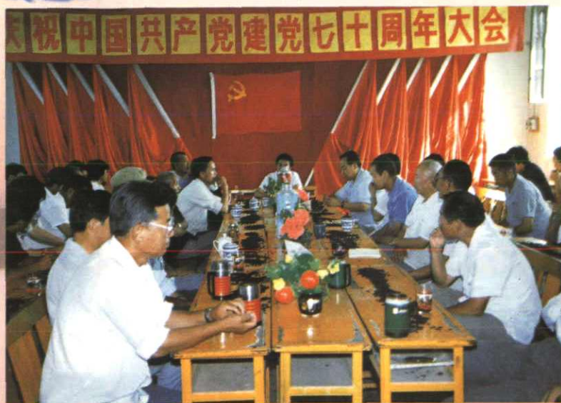
◀水利二处举办庆祝建党70周年座谈会（1991年摄）