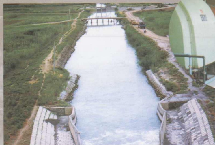
▲柳沟老西干渠 (1996年摄)