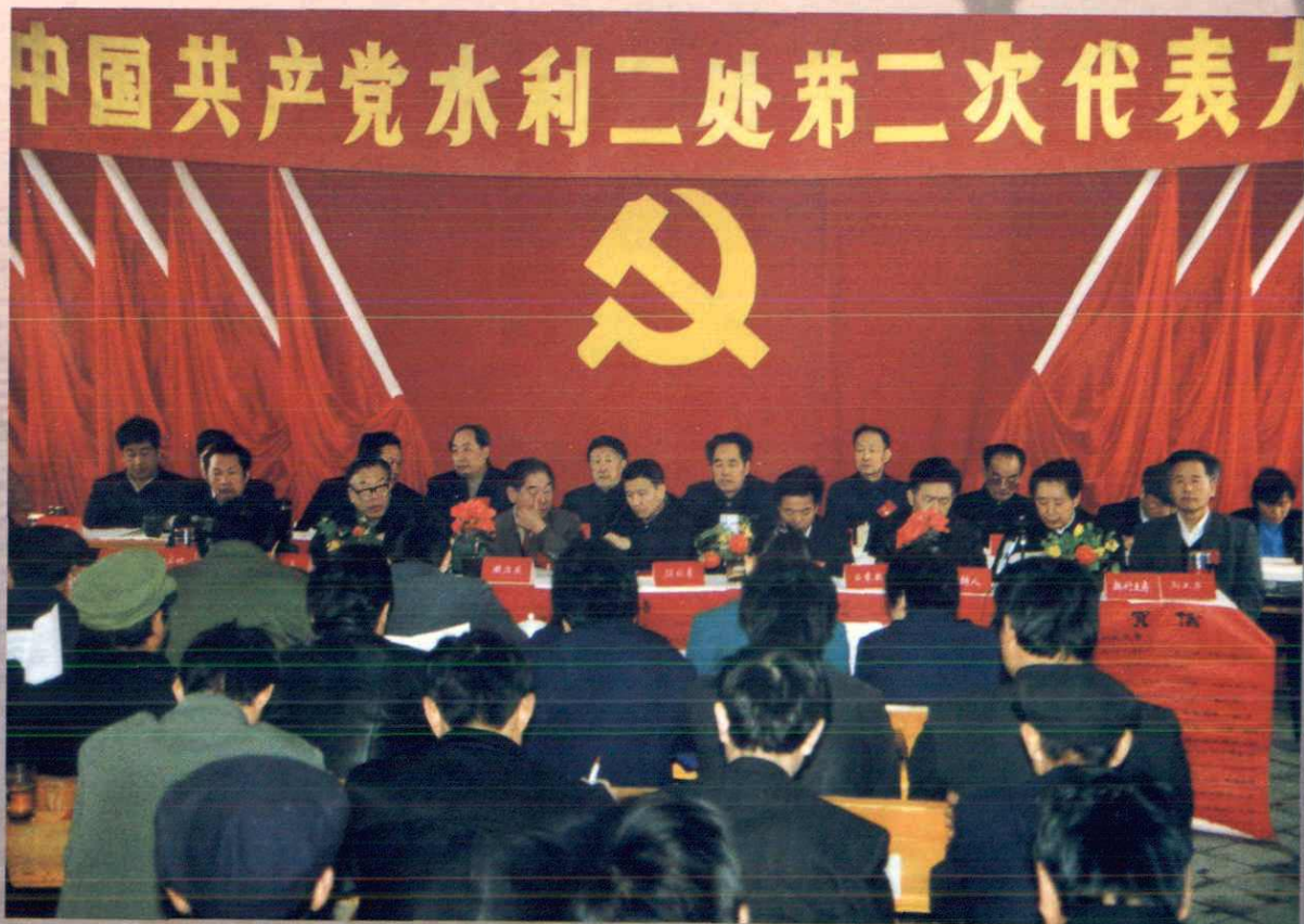
▲中国共产党水利二处第二次代表大会（1992年3月摄）