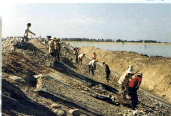
▲重建奎屯水库防浪护坡 (1997年摄)