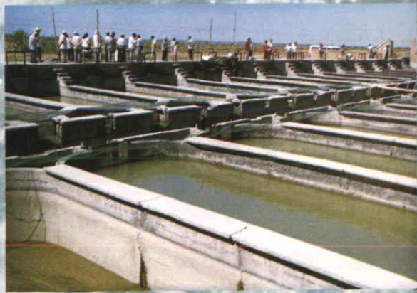
▲车排子流水养鱼基地 (1997年摄)