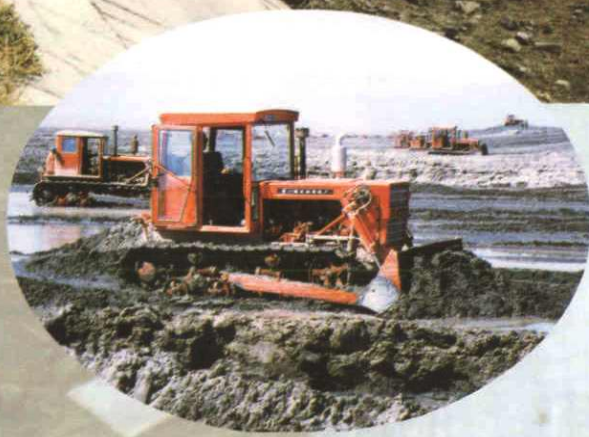
▲在引洪渠清淤 (1997年摄)