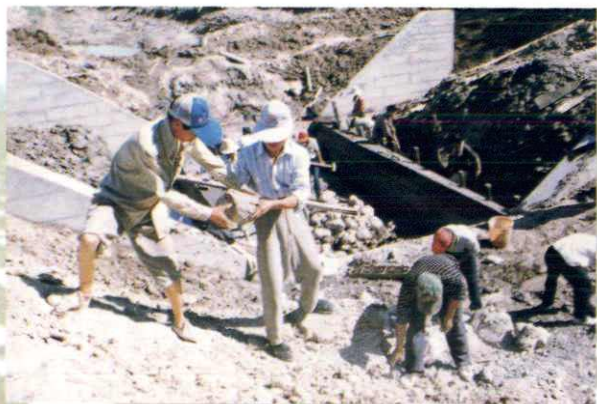
▲水利工程施工现场 (1996年摄)