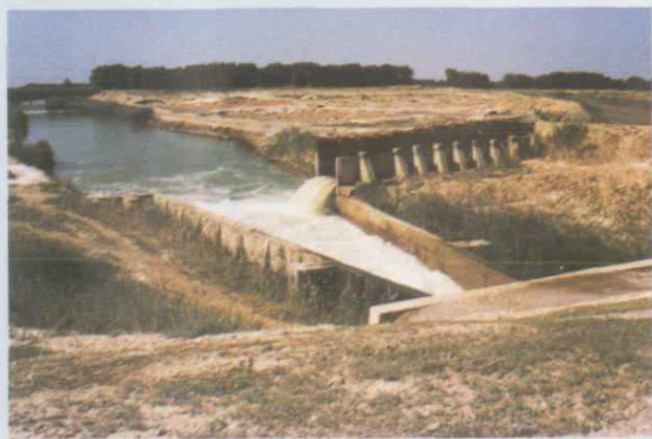
▲黄沟—奎屯水库调节渠泄水口 (1997年摄)