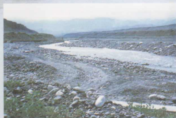
▲四棵树河引水渠上游 (1997年摄)