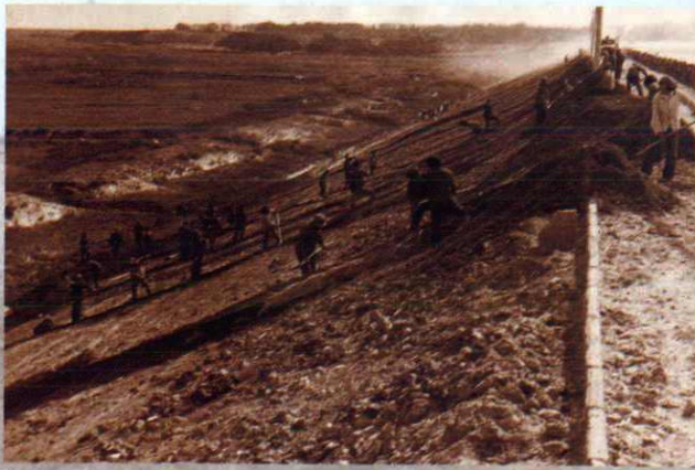
▲加固柳沟水库防浪护坡外坡 (1984年摄)