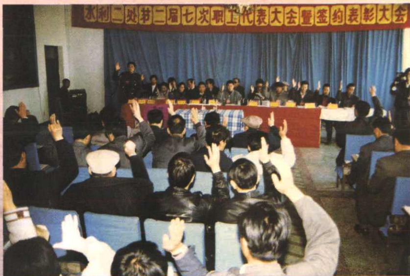
▶审议通过《生产责任制实施方案》（1996年摄）