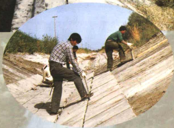
▲铺设防渗渠道 (1994年摄)