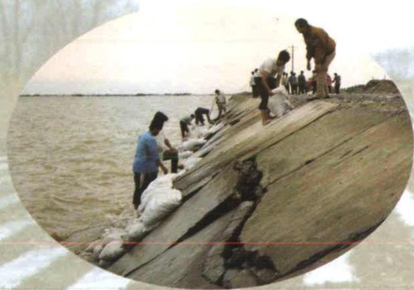
▲在奎屯水库抢险 (1995年摄)