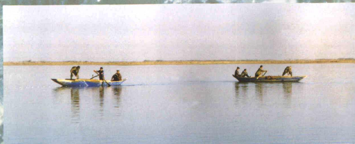
▲在柳沟水库捕鱼 (1996年摄)