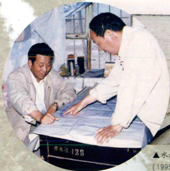
▼农七师师长华士(左1)在车排子水库扩建工地研究施工方案 (1997年摄)