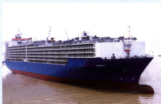
牲畜改装船“娜达”轮出厂。