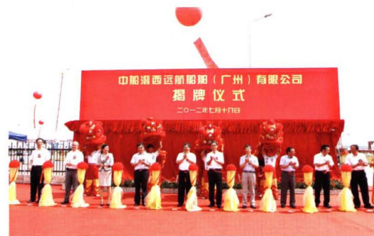
2013年7月,中船澄西远航船舶(广州)有限公司揭牌。