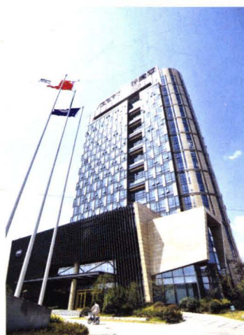
研发中心大楼。 中船澄西新地标——高耸挺拔的