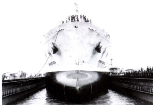
1977年3月,澄西修理的第一艘船“神州”号。