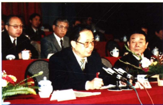
1994年，江苏省副省长张怀西出席我厂“衡山”坞投产庆典。