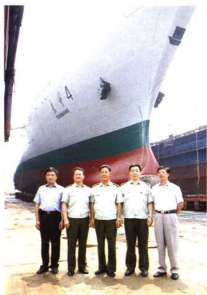
二〇〇五年,总装备部科技委副主任胡世祥中将来厂视察(左三为胡世祥)。