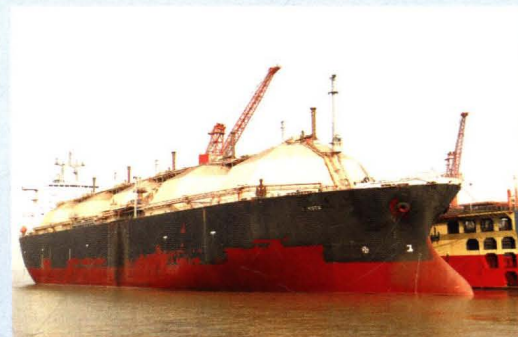
LNG 船“卡特”轮进新荣公司修理。