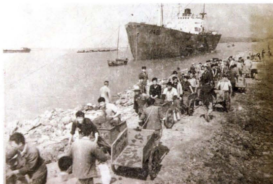
1973年12月,吹沙填土,围堰造地,拉开了激情燃烧的创业岁月。