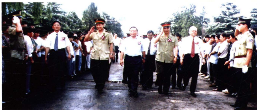
1999年，中国人民解放军总装备部副部长李元正中将和国家“921”工程副指挥沈荣骏中将来厂视察(左二为李元正，左四为沈荣骏)。