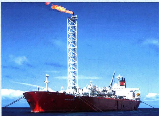
公司承修 的第一艘海工 船“布拉特” 轮。