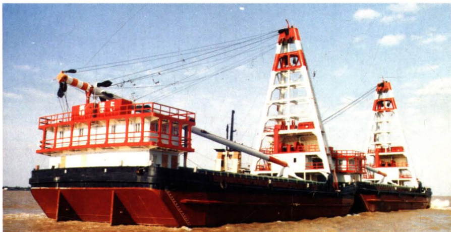
1992年9月,为香港船东建造的152英尺起重驳。