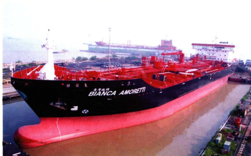
为意大利船东建造的 25000 吨成品油(化学品)船“阿莫瑞蒂”轮。