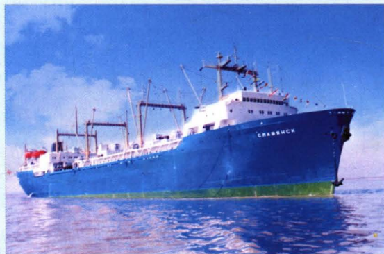
1992年12月11日，前苏联大型鱼加 工母船“斯拉维扬斯克”轮改装完工出厂。 这是我国修船业改装的最大鱼加工母船， 历时三年。