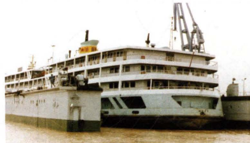
万吨级“钟山”坞(已退役)

总长 208.5 米, 型宽 45 米 最大沉深 12.7 米, 举力 13000 吨