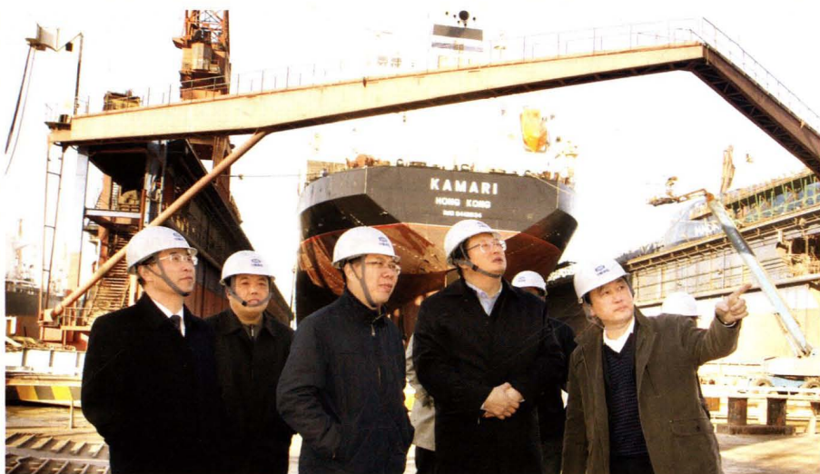
二〇一〇年,中船集团公司党组书记胡问鸣来公司视察(右二为胡问鸣)。