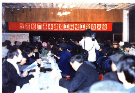
1986年12月,工厂基本建设工程正式通过竣工验收。