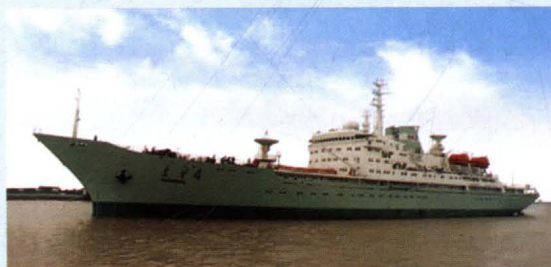
仅用144天完成中修改装的航天测量 船“远望4”号船。