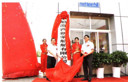
2013年7月,中船澄西新荣船舶有限公司挂牌。