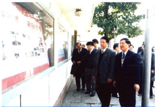
2000年,全国总工会副主席方嘉德来厂检查厂务公开。