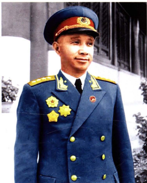
1973年，粟裕大将为工厂勘定厂址。