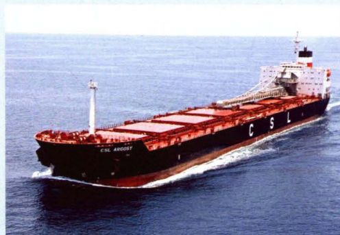
机舱前整体建造换新的 74000 吨 自卸船