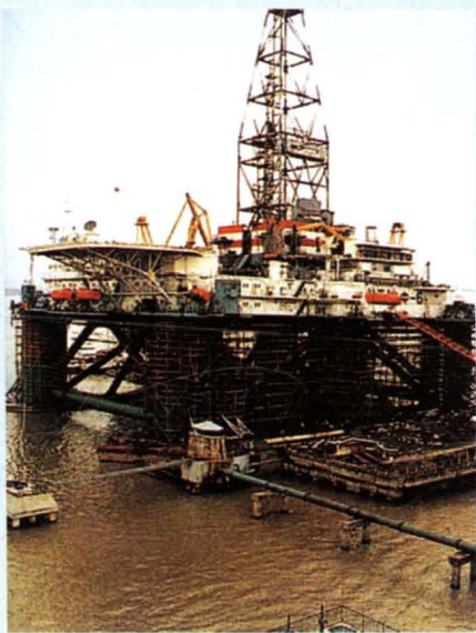
公司承修的第一座海上石油 钻井平台“塞尔夫6号”。