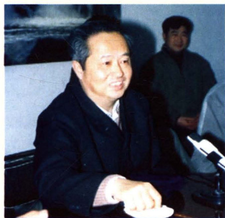
一九九一年,中国船舶工业总公司总经理张寿来厂视察。