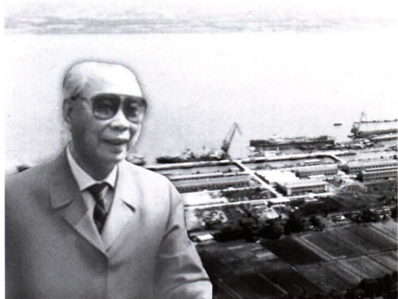
1975年，江苏省委书记彭冲来厂视察。