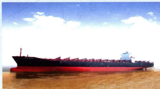
火损船“宾夕法尼亚”成功修复，并改 名为“诺雷细亚”轮。