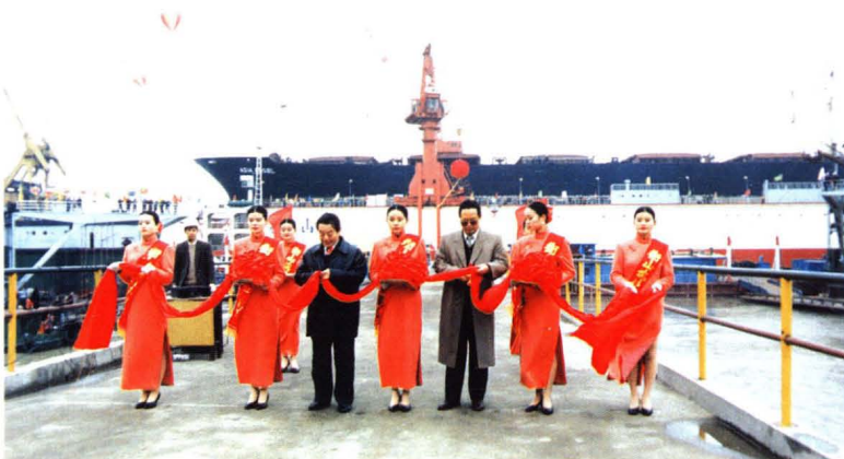
1994年12月18日,10万吨级浮船坞“衡山”号竣工投产。