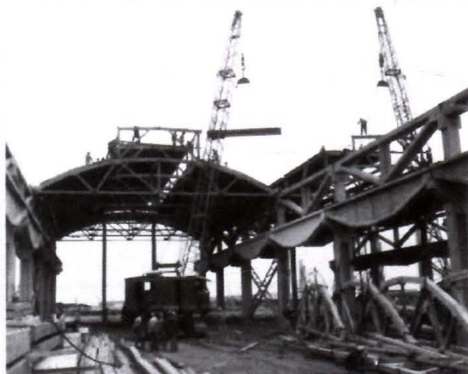
1975年8月,工厂第一个生产车间轮机车间打桩建造。