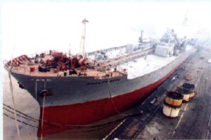
开创国内自卸水泥改装船先 河的“富士山”轮。