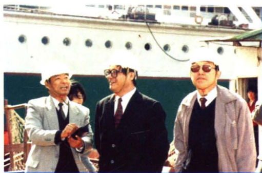
1994年，中华全国总工会副主席滕一龙来厂视察。