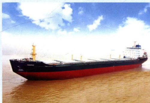
机舱整体再造,上建整体换新的生 命延长船“尤里”轮完工出厂。