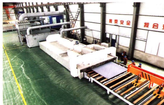
钢板预处理生产线