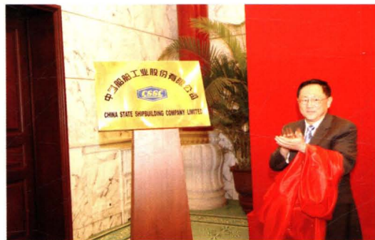
2007年8月,公司成为中国船舶工业股份有限公司的全资子公司。