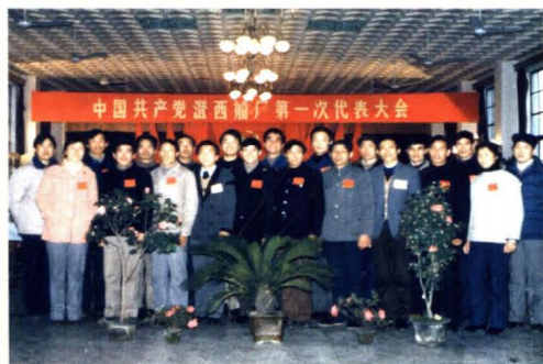
1988年1月工厂召开的第一届党代会。