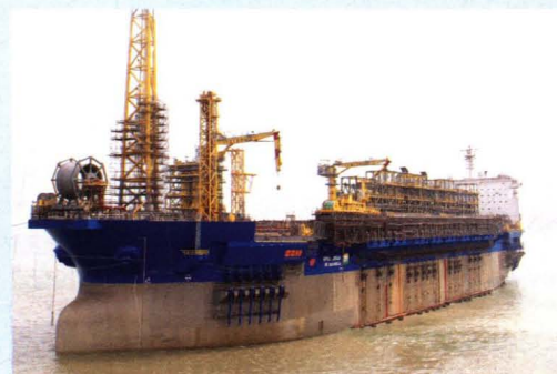
全球同类型浮式生产储卸油装置(FPSO)改装工程量最大、最复杂、最先进的项目——“伊利亚贝拉”号 FPSO 于 2013 年 10 月在澄西广州公司完工。