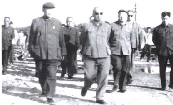
1978年，交通部部长叶飞来厂视察。