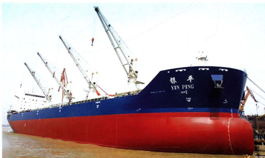
中船集团公司第一艘PSPC完工船“银平”轮。