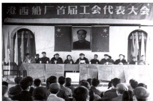
1976年11月,工厂首届工会代表大会。