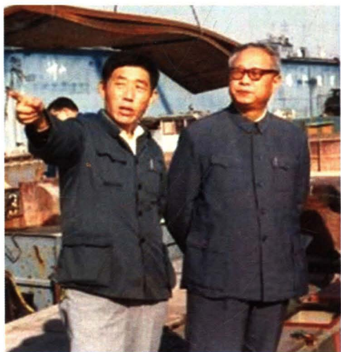
1984年，江苏省副省长汪冰石来厂视察。