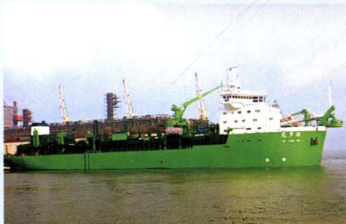
大型挖泥船“尼罗河”轮修复出厂。