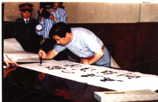
1996年，解放军总后勤部原政委周克玉上将来厂视察并题词。