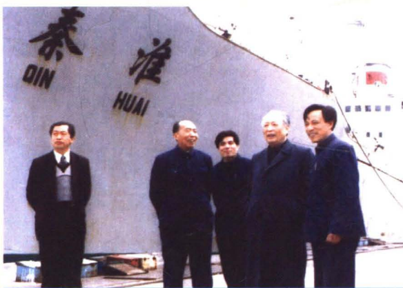
1987年,文化部原部长朱穆之来厂调研。