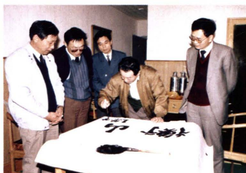
1994年,中国船舶工业总公司总经理王荣生为“衡山”坞题词。