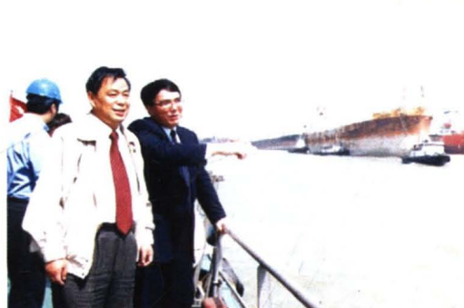
2000年，江苏省副省长王珉来厂视察。