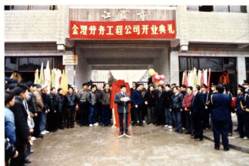
1993年1月8日,工厂成立江阴市金澄劳务工程公司。