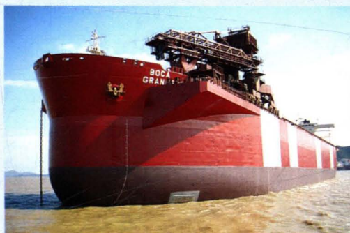
委内瑞拉籍 13.5 万吨 OBO 船“波卡”轮改装成矿砂转运平台。