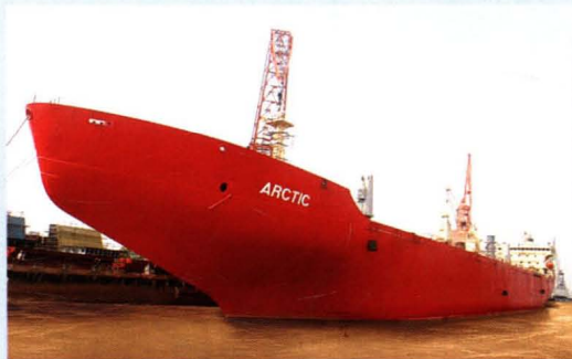
公司改装的破冰船“阿克”轮。