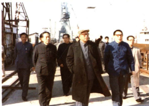
1984年,国家经贸委副主任袁宝华来厂视察。