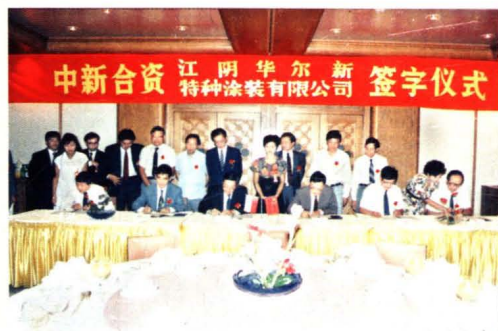
1992年9月17日,由中国和新加坡合资兴办的华尔新特种涂装工程公司在我厂成立。