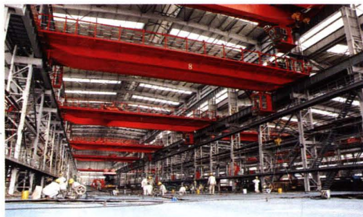
造船分段制造车间