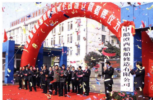
2006年12月,澄西船厂改制为中船澄西船舶修造有限公司。