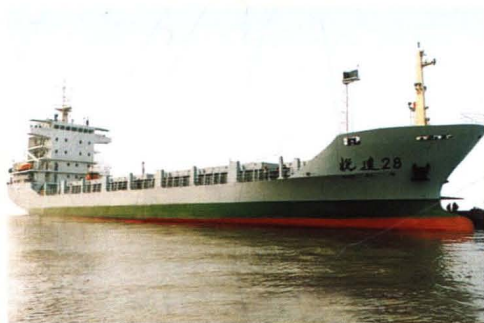
为江苏悦达实业集团建造的 4500 吨多用途集装箱船“悦达 28”轮。