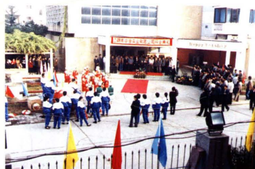
1993年3月8日,江阴市华澄实业总公司正式挂牌成立。