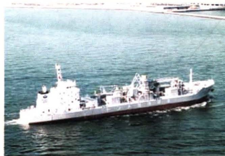
为日本建造的7500吨水泥自卸船组“拓海丸”轮。