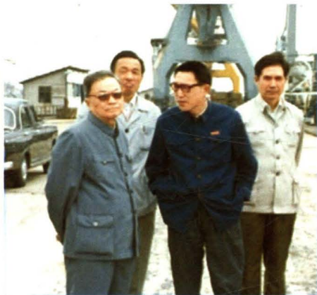
1985年,国务院经济研究中心名誉总干事薛暮桥来厂调研。