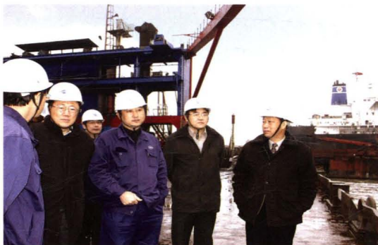
2005年,中船集团公司总经理陈小津来厂视察(左二为陈小津)。