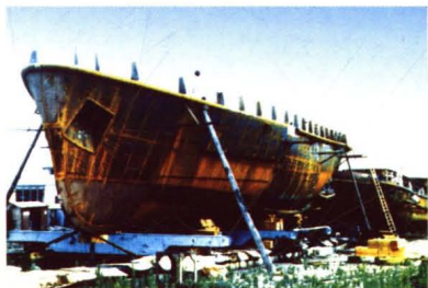
工厂建造的 900 匹港作拖轮。