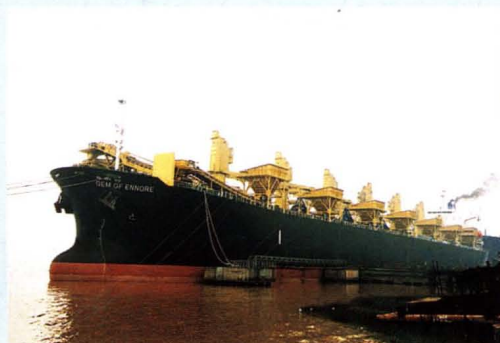
印度籍 72000 吨巴拿马型散货船 “迪拜珍珠”轮改装成自卸运煤船。