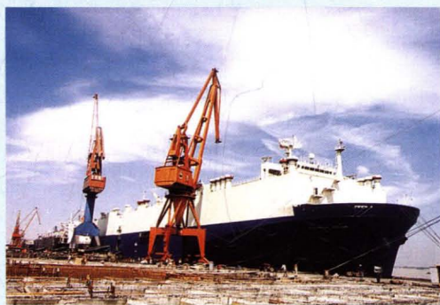
汽车滚装船“托科茵”轮完工待出 厂。