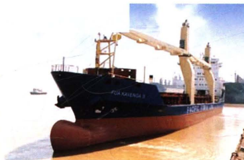
为塞浦路斯船东建造的 8000 吨多用途集装箱船。