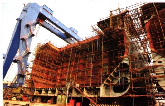
造船分段制造生产线