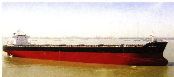
为中外运公司建造的 76000 吨散货船“大盛”轮。