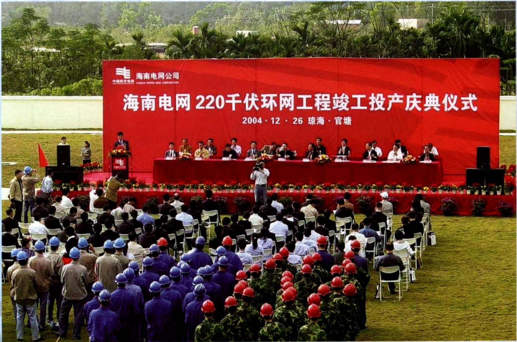
2004年12月26日，220千伏环网工程在琼海官塘变电站举办竣工投产庆典仪式