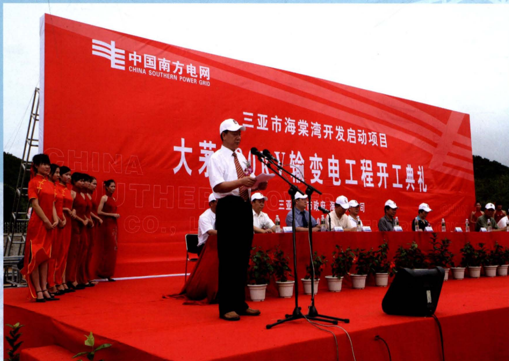
2006年8月15日,三亚大茅220千伏输变电工程开工建设