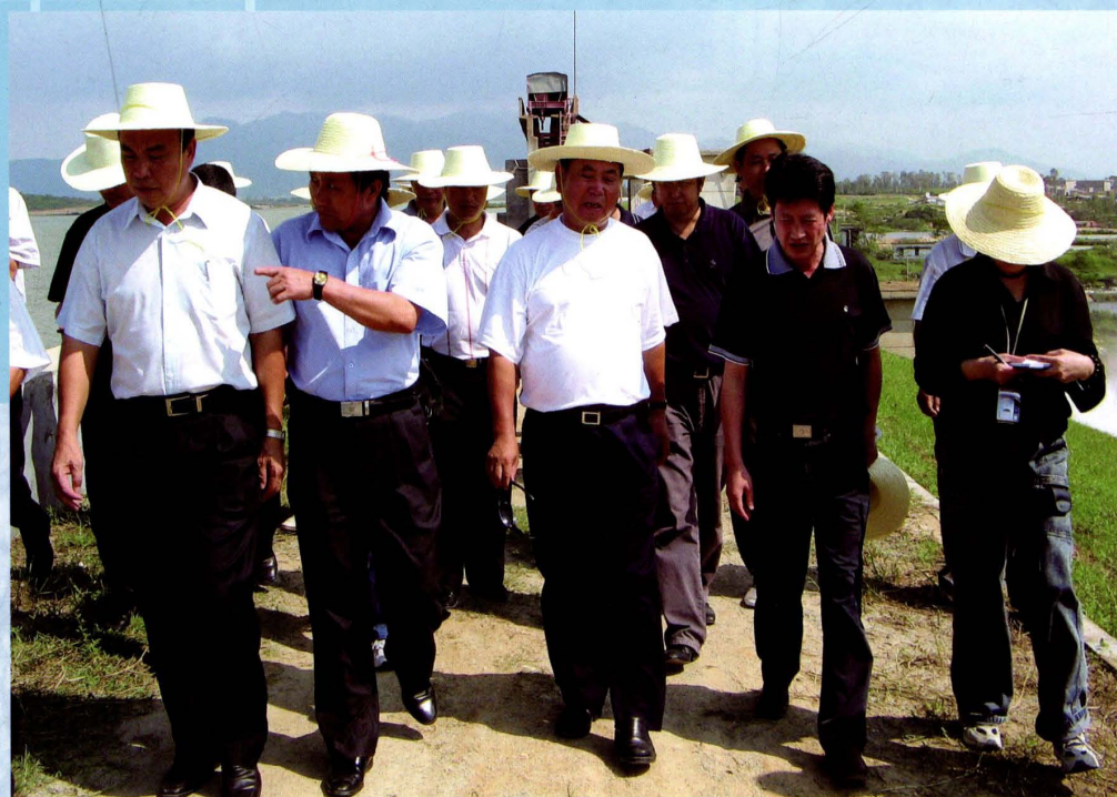
2005年10月1日,抗击“达维”台风期间,海南省委书记卫留成(中)到生产一线视察工作,海南电网公司党组书记尹炼(右二)陪同