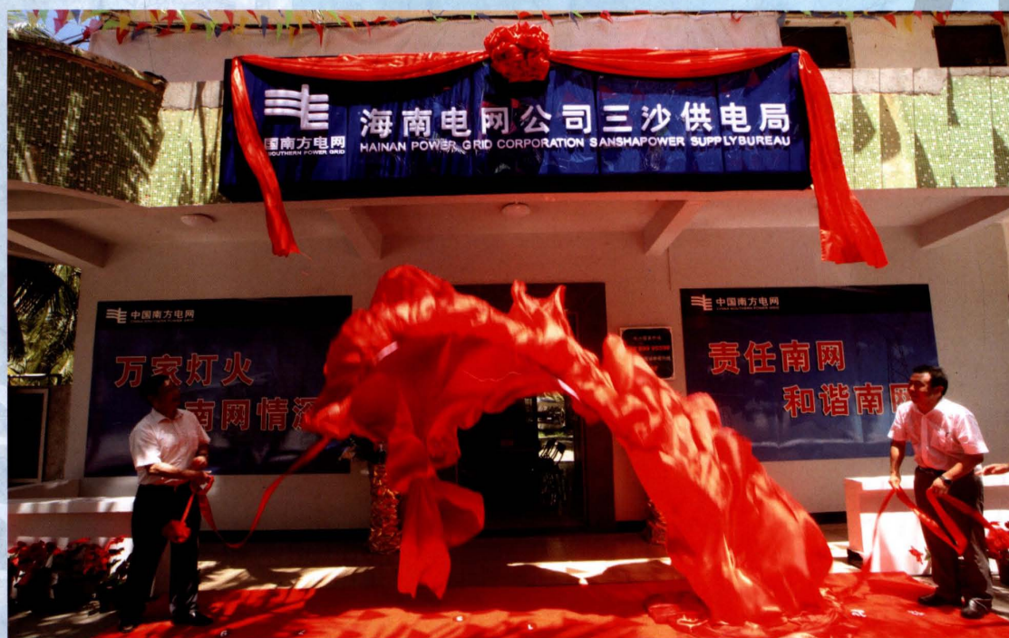
2012年8月28日，海南电网公司三沙供电局成立，海南省副省长李国梁（右）、中国南方电网公司总经理钟俊（左）共同为三沙供电局揭牌