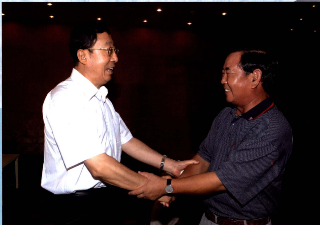
2005年10月4日，“达维”台风过后，海南省委书记卫留成（右）与中国南方电网公司董事长袁懋振（左）亲切会面