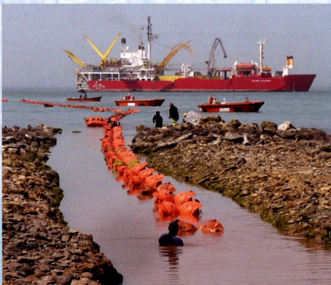
2009年3月3日, 550千伏海南联网工程第二条海底电缆上岸施工现场