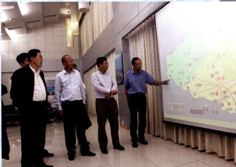
2010年11月15日，国家电监会副主席史玉波（左一）在三亚供电局调度中心了解海南南部电网运行情况，海南电网公司副总经理杨卓（左一）陪同