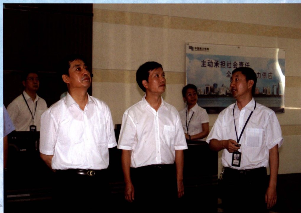
2009年6月30日，国家电力监管委员会副主席王野平（左一）到海南电网公司检查指导工作，海南电网公司党组书记王静辉（左二）陪同