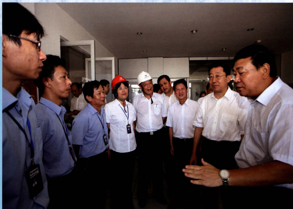
2009年6月30日，中国南方电网公司董事长袁懋振（右二）、总经理赵建国（右一）到海口供电局下洋变电站调研，海南电网公司总经理尹炼（右三）、副总经理庞准（右四）陪同