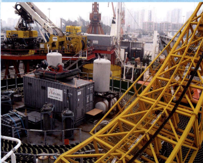
500千伏海南联网工程施工现场

2011年12月24日，海南省最高输电铁塔（高98米）——110千伏玉洲至海甸（新埠）线路工程N60塔组塔完毕，该线路（跨南渡江）工程投产后，极大满足海口市江东片区和海甸岛的开发建设用电需求，有效提高海口城区供电可靠性