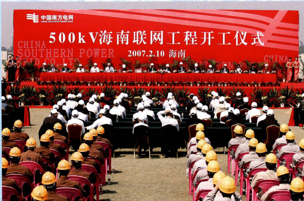
2007年2月10日，500千伏海南联网工程开工仪式在海南举行