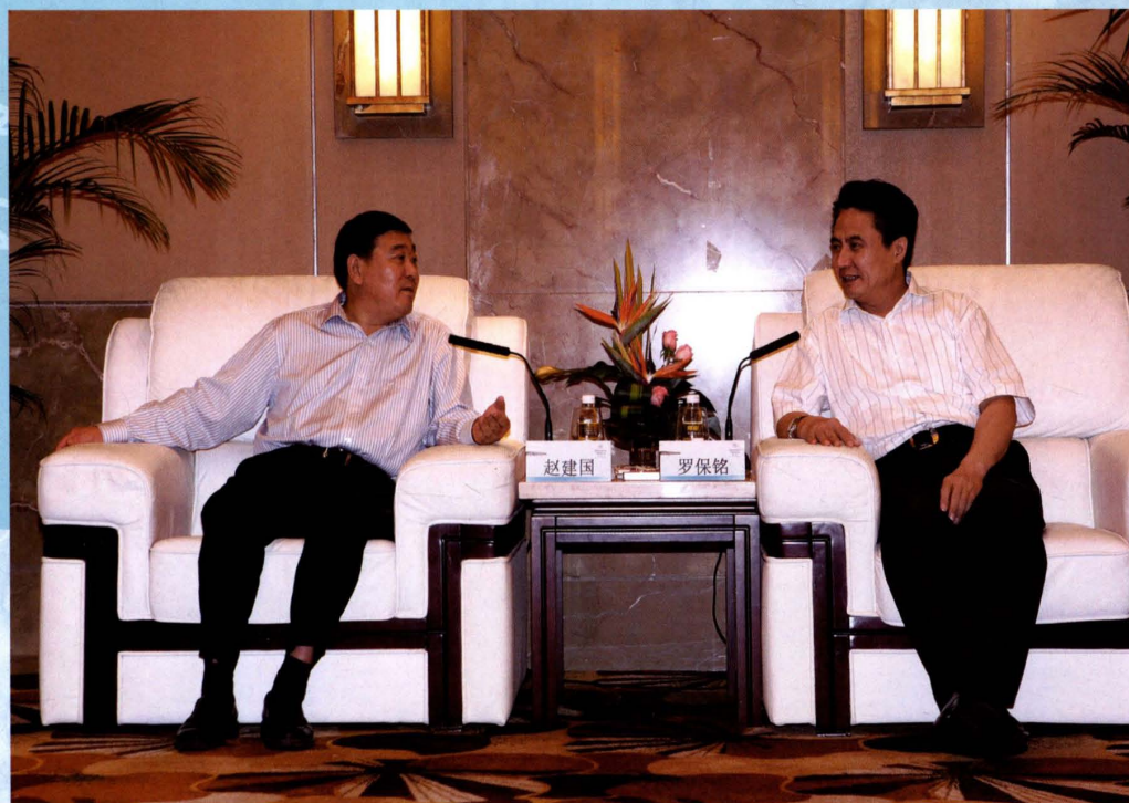
2009年3月22日，中国南方电网公司总经理赵建国（左）与海南省省长罗保铭（右）亲切会谈