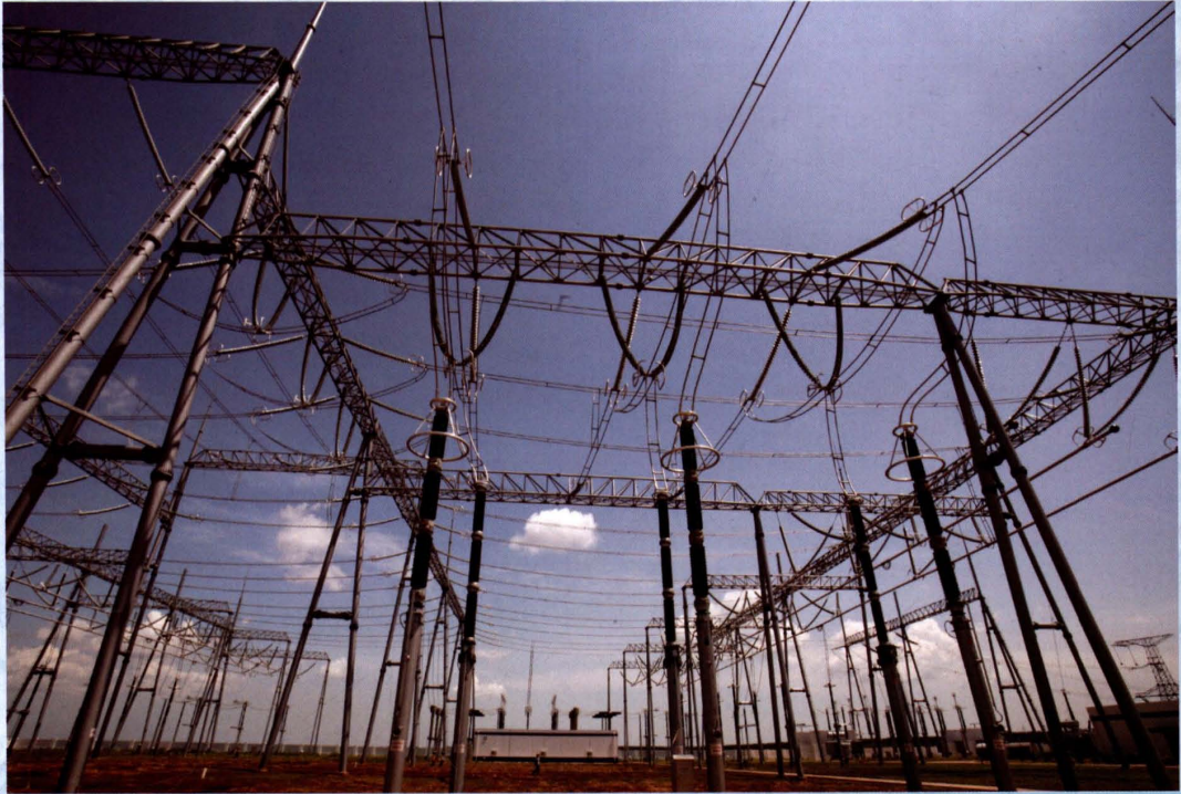
2009年6月23日，500千伏福山变电站建成投产