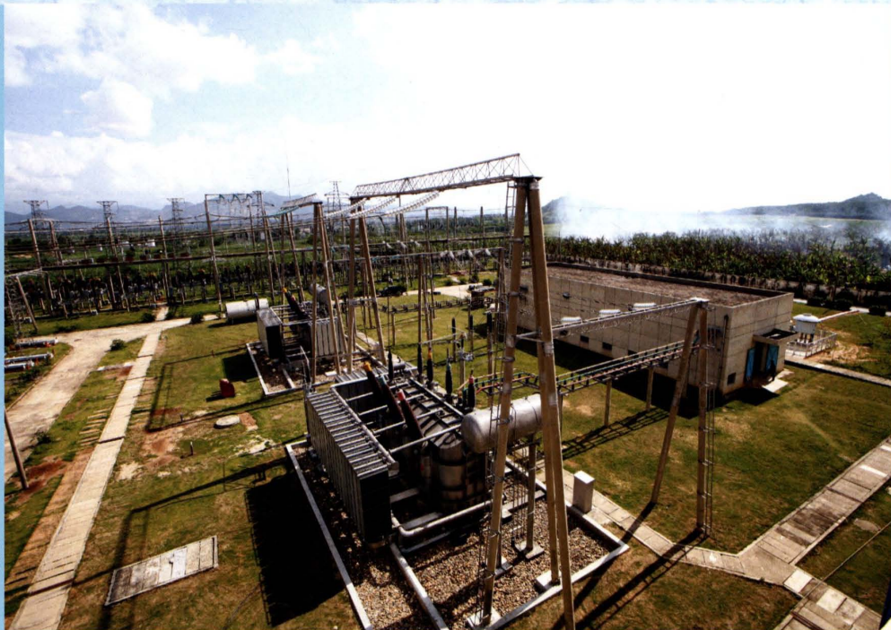
2005年10月26日,澄迈大丰220千伏输变电工程创历史同类工程最短纪录,仅用了五个月的时间就建成投产