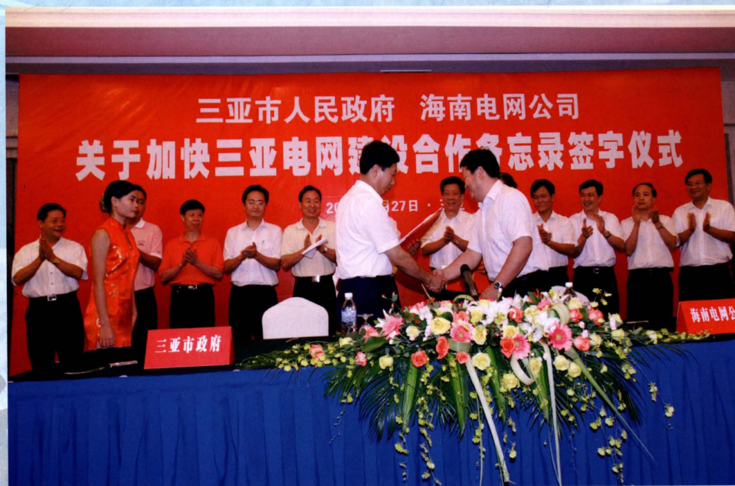
2007年8月27日，海南电网公司与三亚市政府签订电网合作备忘录