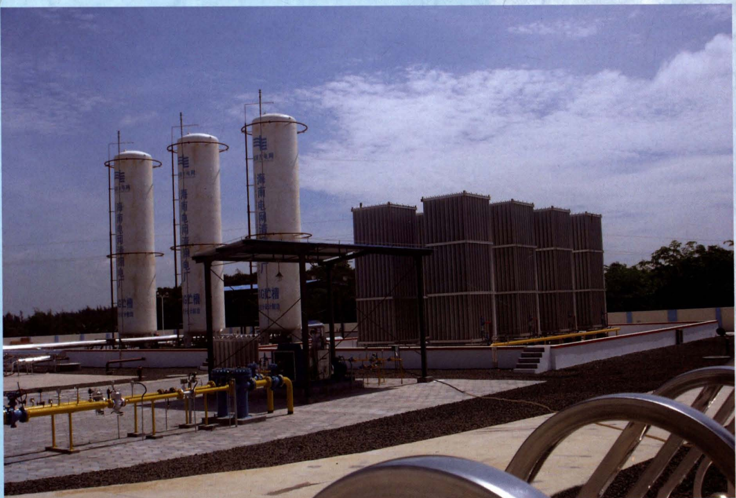
2005年5月18日，清澜电厂完成“油改气”工程投入运行