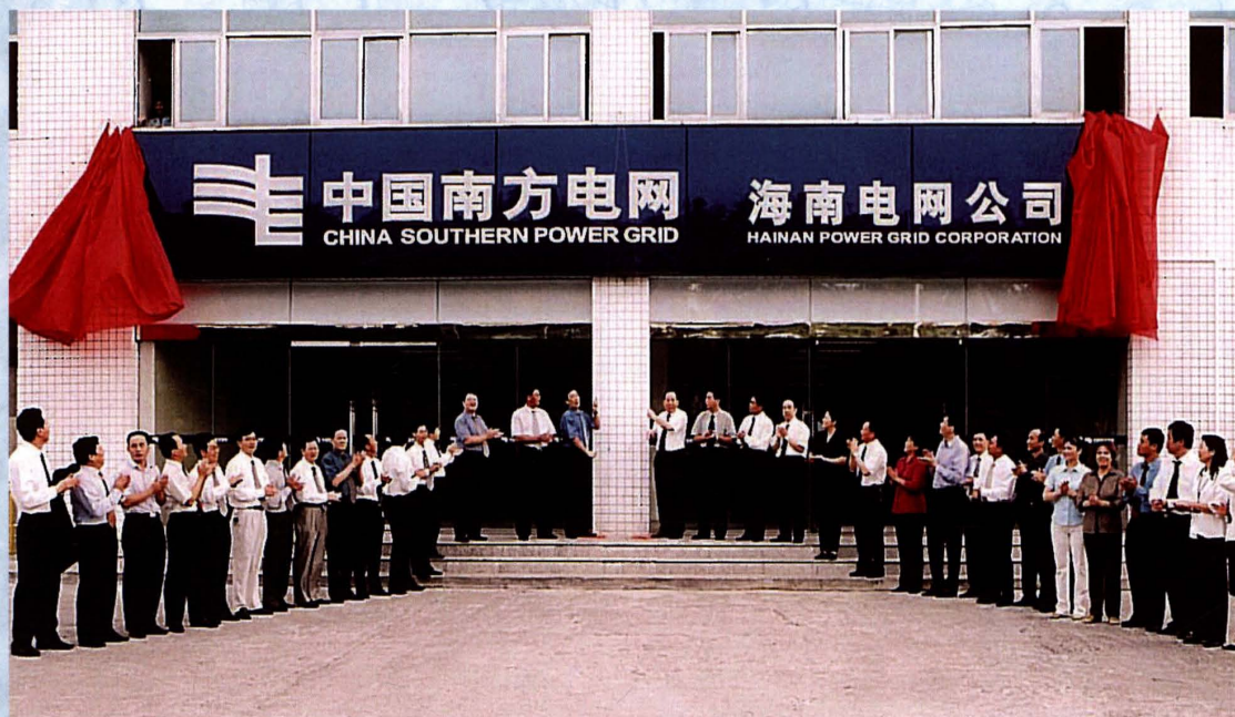
2004年10月16日，中国南方电网海南电网公司挂牌成立