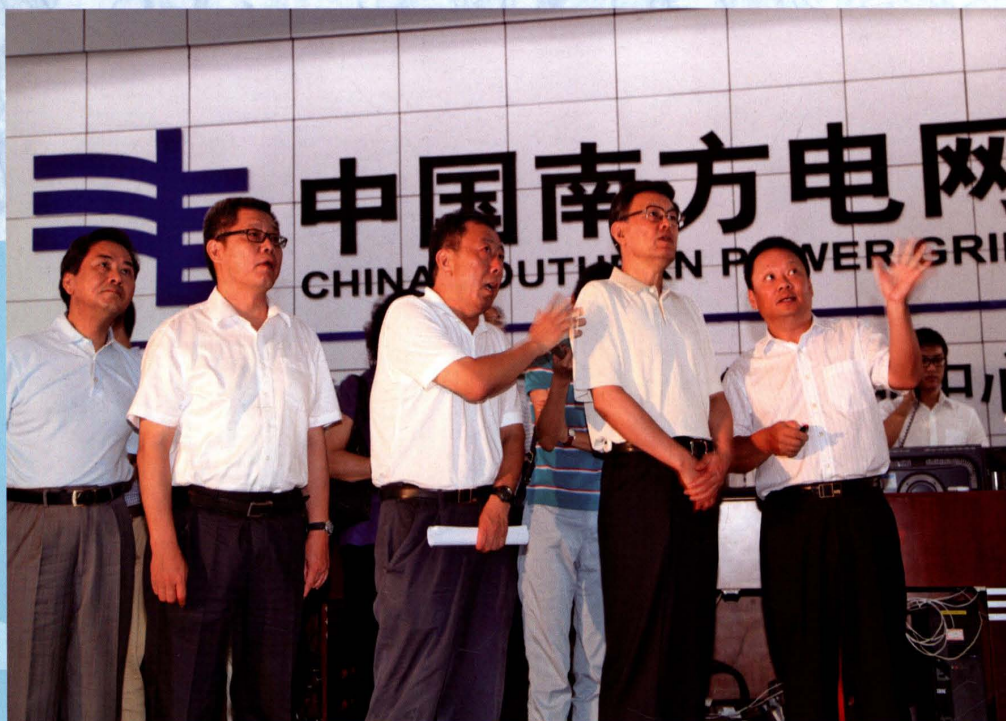
2014年7月20日,海南省省长蒋定之(右二)、副省长李国梁(右三)到海南电网公司视察台风受损情况,海南电网公司董事长金戈鸣(左二)、总经理娄山(右一)陪同