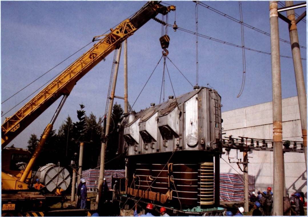
2006年2月17日，玉洲变电站进行大修吊罩情景