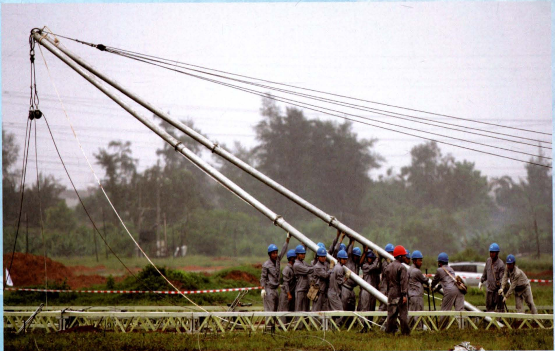
2007年8月10日，海南电网公司举行2007年防风防汛应急联合演习