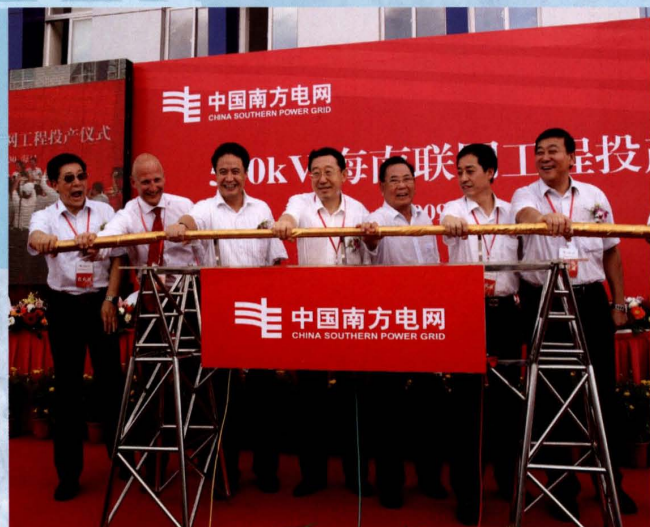
2009年6月30日, 500千伏海南联网工程竣工投产, 中国南方电网公司董事长袁懋振(中)、海南省委书记卫留成(右三)、省长罗保铭(左三)、国家电力监管委员会副主席王野平(右二)、中国南方电网公司总经理赵建国(右一)等领导出席投产仪式