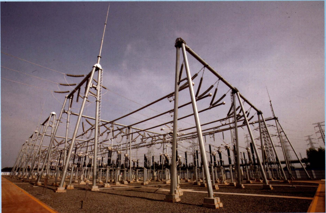
2010年8月31日，长流220千伏输变电工程投入运行