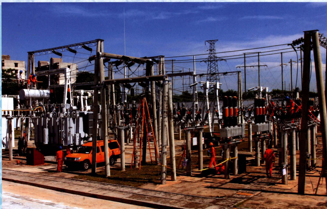
2012年5月19日，昌江供电局110千伏南石站绝缘子清扫现场